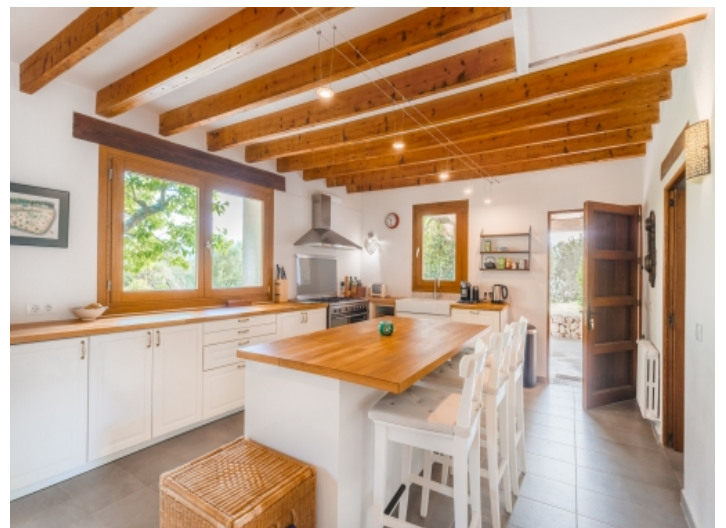
Moderne helle Küche