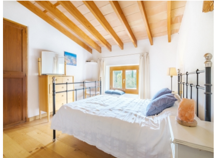
Eines von 7 Schlafzimmern