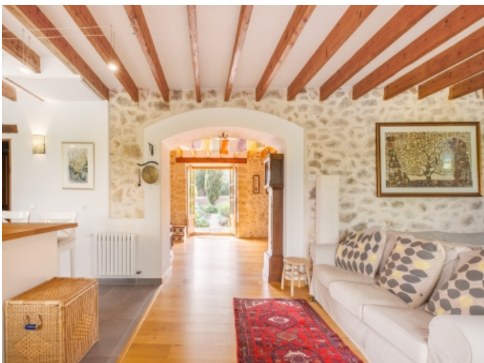
Alternative Ansicht des Wohnbereichs