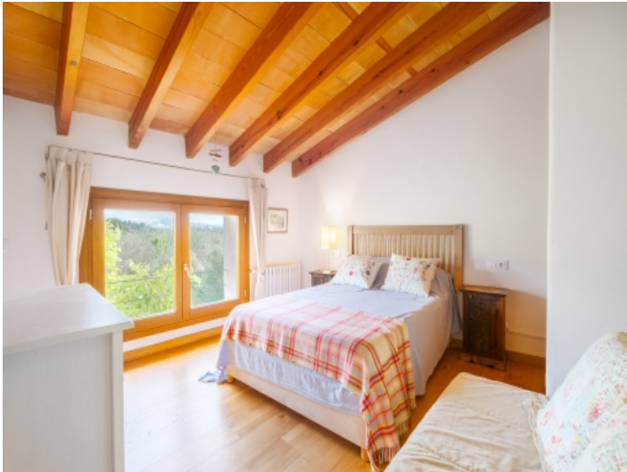
Eines von 7 Schlafzimmern