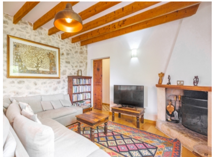
Rustikaler Wohnbereich mit Kamin