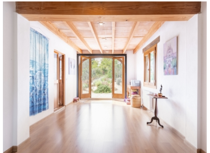
Yoga Zimmer zum Entspannen