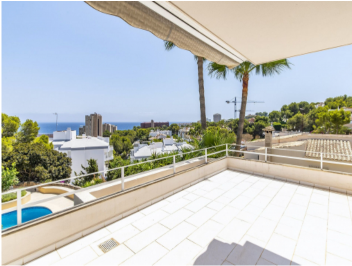
Überdachte Terrasse mit tollem Meerblick