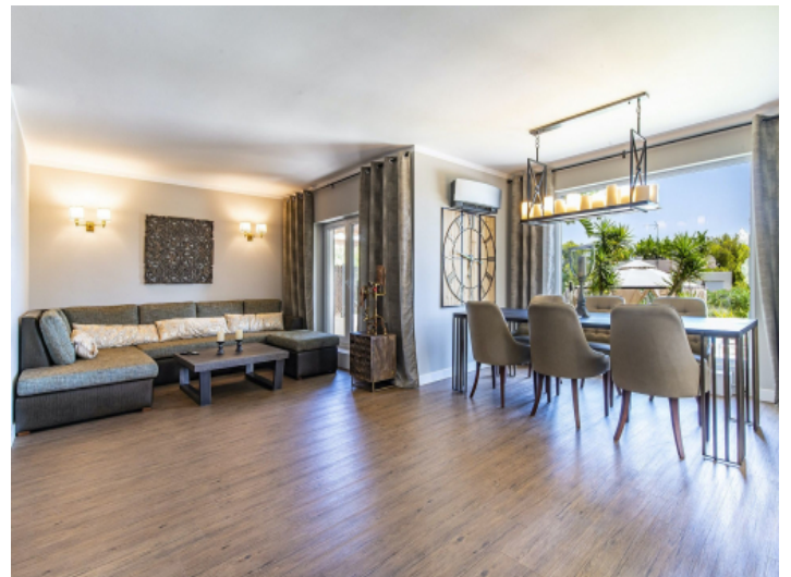
Offen gestalteter Wohn-/Essbereich