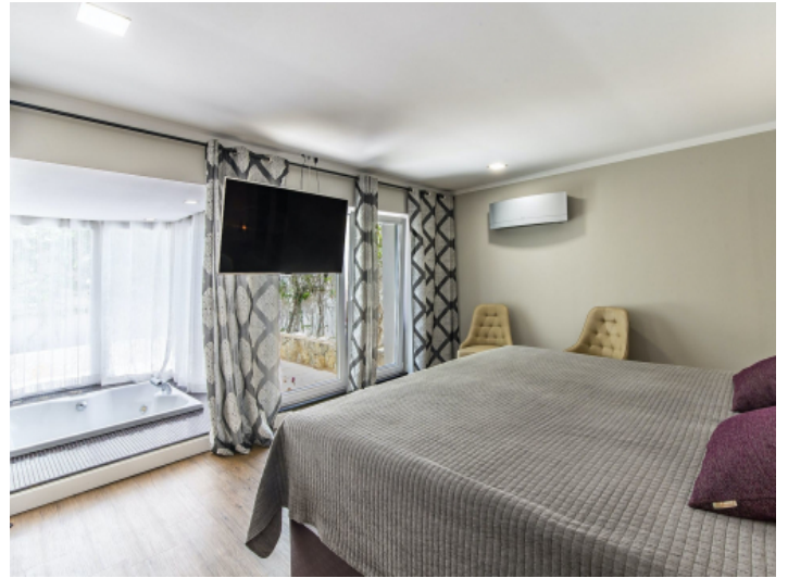
Schlafzimmer mit Bad en Suite