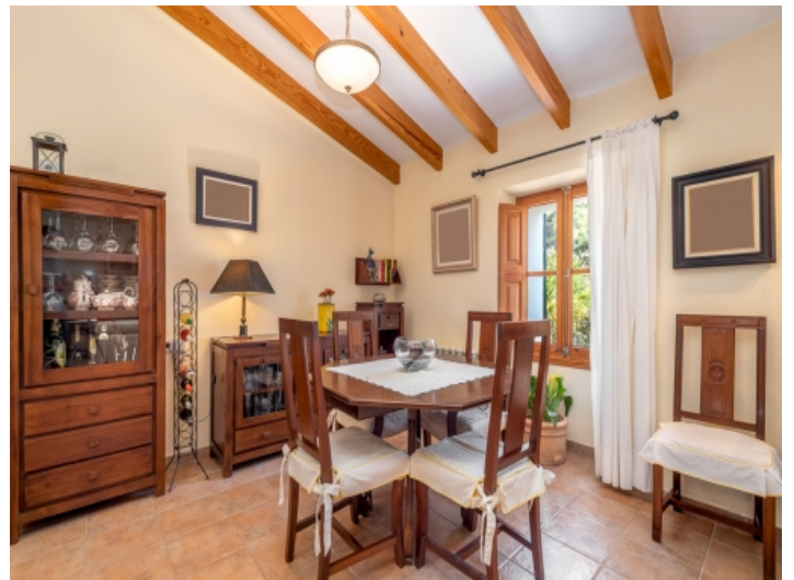
Blick zum Essbereich