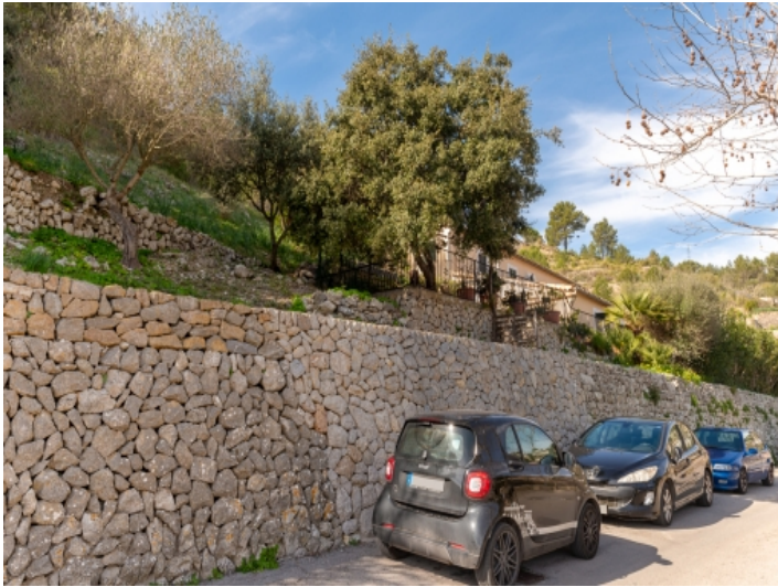
Außenansicht des Hauses