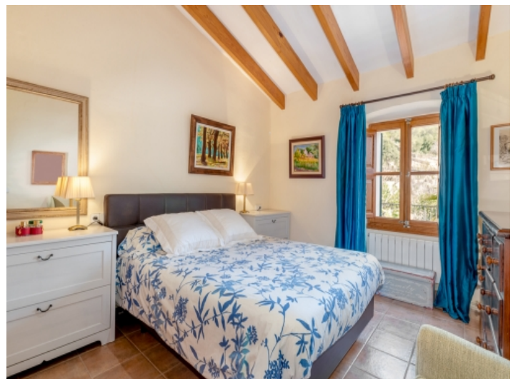
Eines von 2 Schlafzimmern