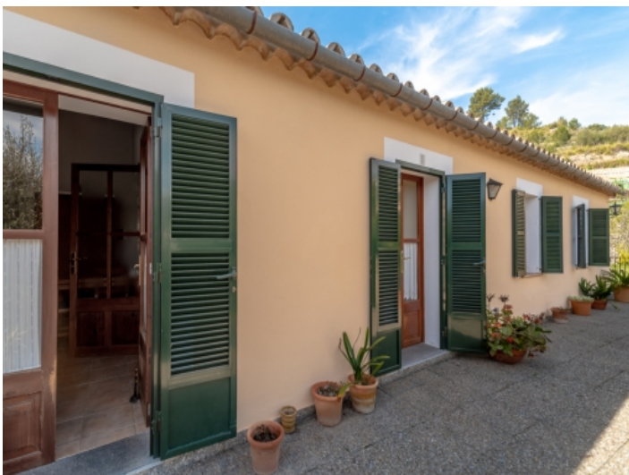
Ansicht der Terrasse