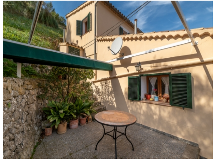
Außenansicht des Hauses