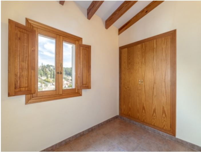
Eines von 2 Schlafzimmern