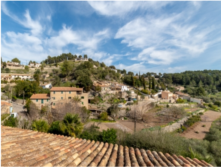
Blick über Galilea