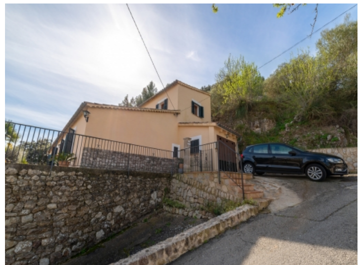
Zugang zum Haus