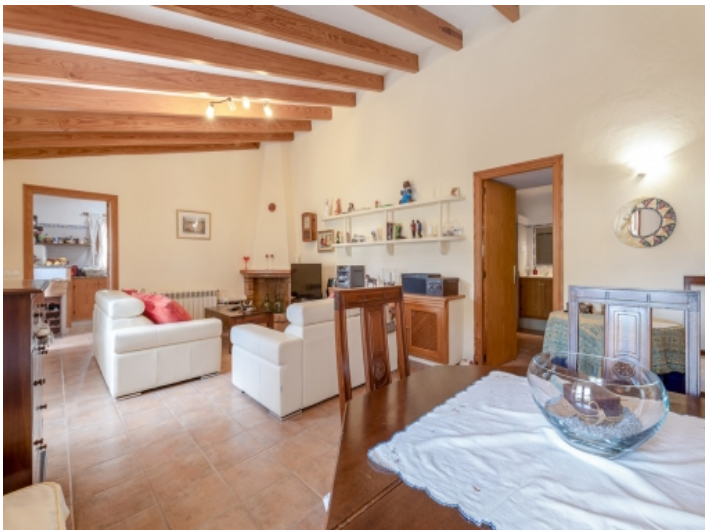
Offener Wohn- und Essbereich