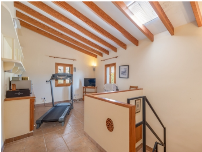
Oberer Flurbereich / Wohnbereich