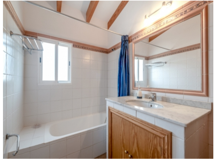
Badezimmer mit Duschwanne