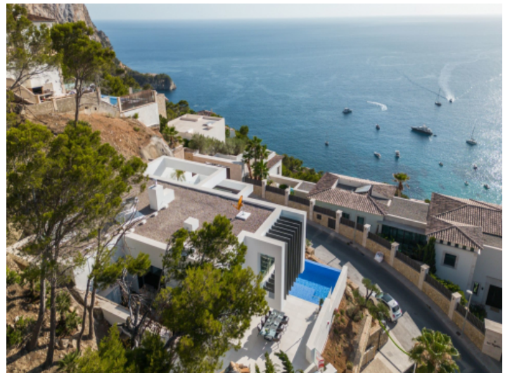
Blick auf die moderne Villa und das Mittelmeer