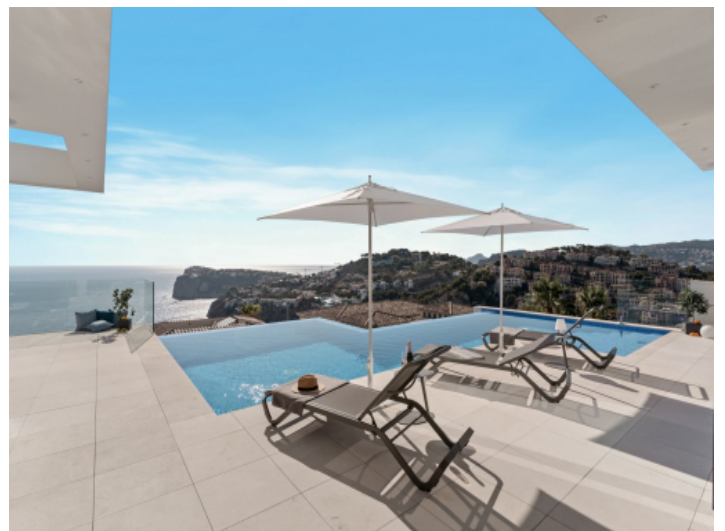
Terrasse mit Meerblick