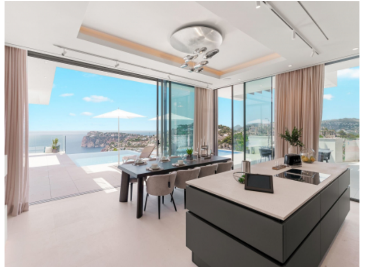
Küche mit Kochinsel