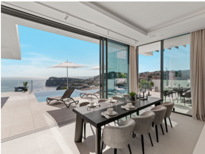
Essbereich mit Zugang zum Balkon