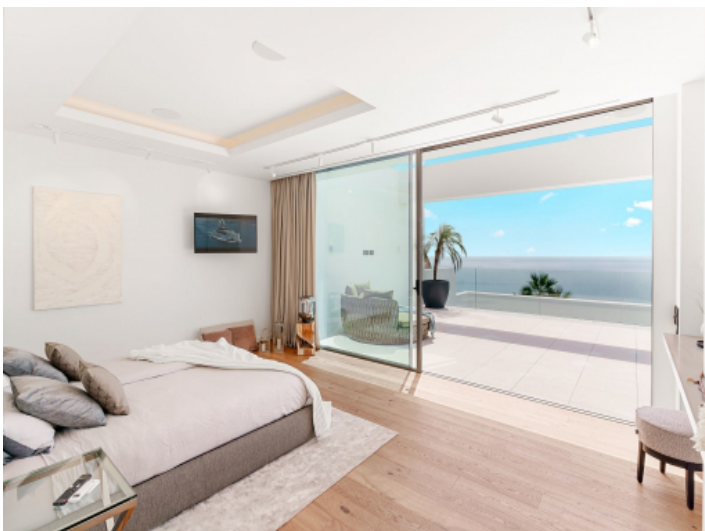
Schlafzimmer mit Balkonzugang