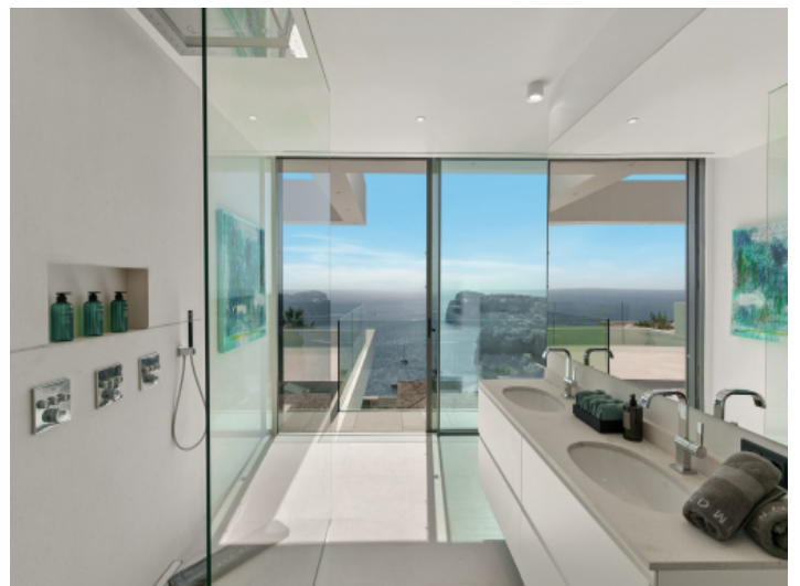
Badezimmer mit Dusche