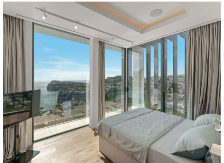
Schlafzimmer mit bodentiefen Fenstern