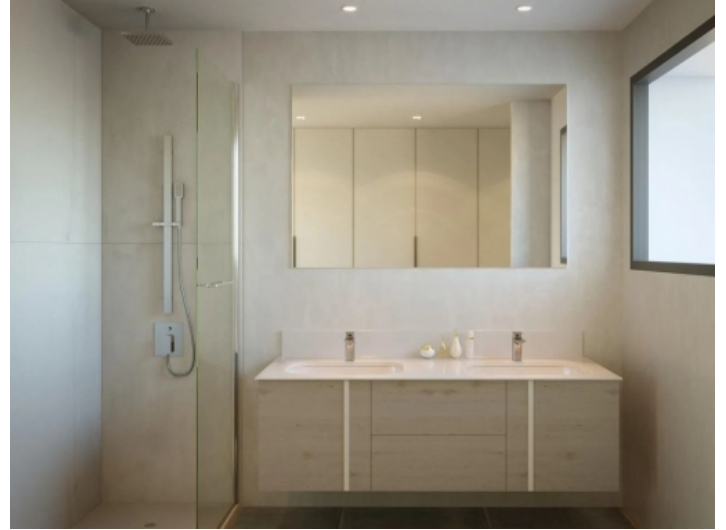
Badezimmer mit ebenerdiger Dusche