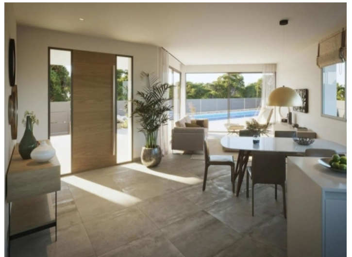
Blick zum Eingangsbereich