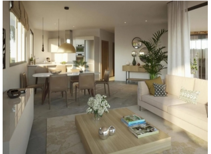
Offener Wohn- Essbereich