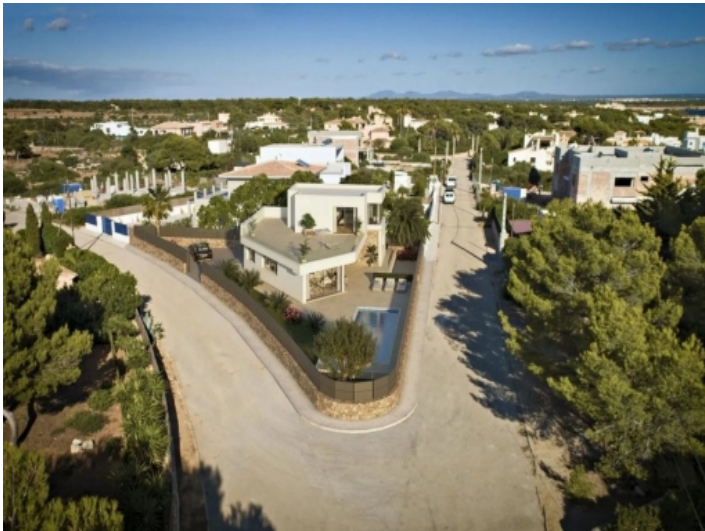
Außenansicht der Villa