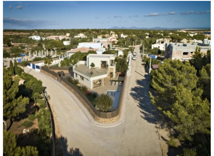
Außenansicht der Villa