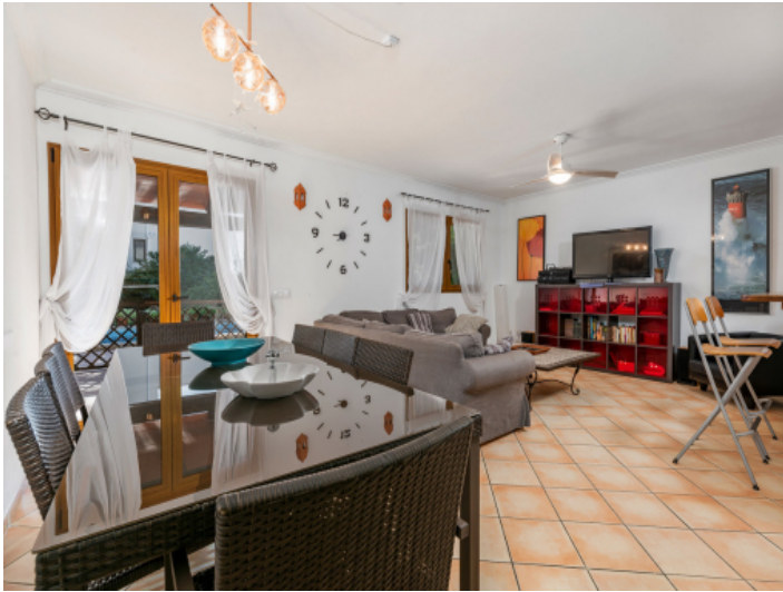
Zugang zum Poolbereich