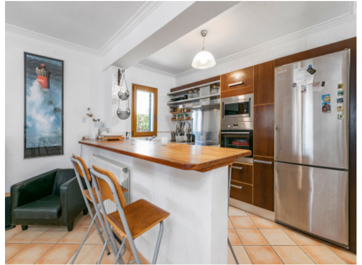
Küche mit Bartisch