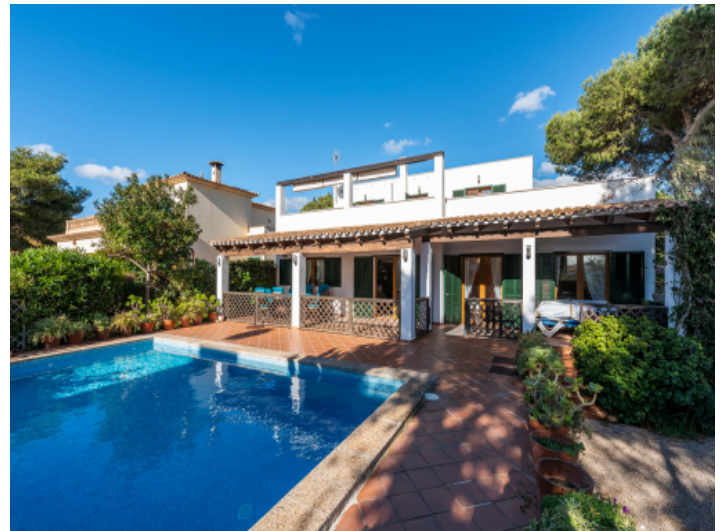
Außenansicht der Villa