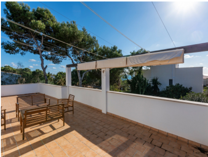
Blick von der Terrasse