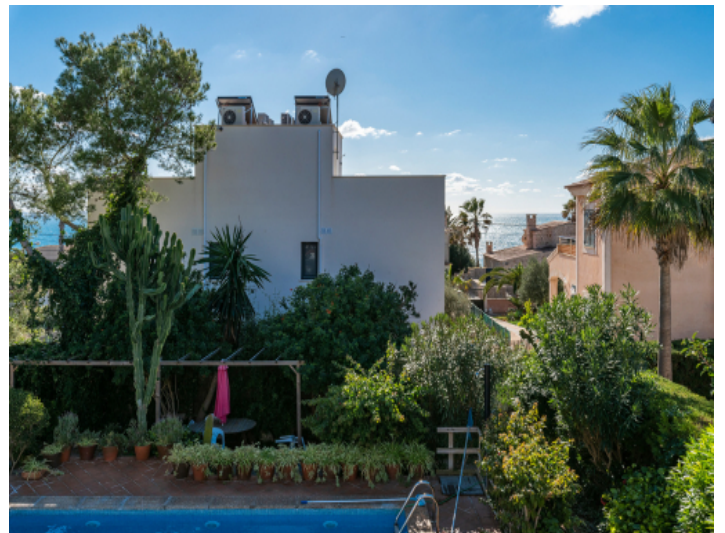
Blick bis zum Meer