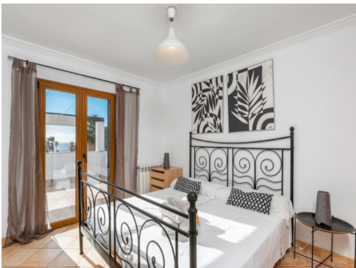
Schlafzimmer im Obergeschoss