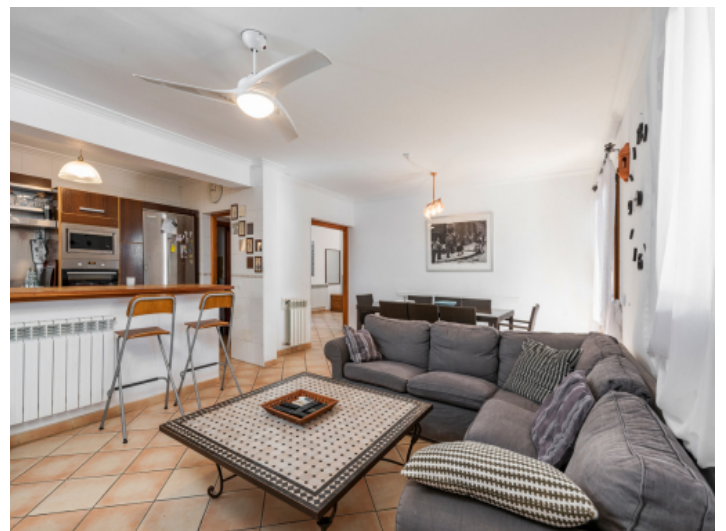
Offener Wohn-, Ess-, und Küchenbereich