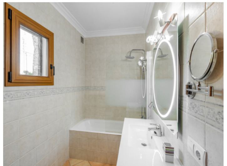
Helles Badezimmer mit Wanne