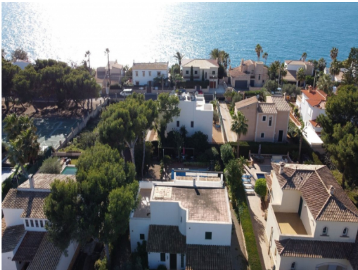
Lage der Villa