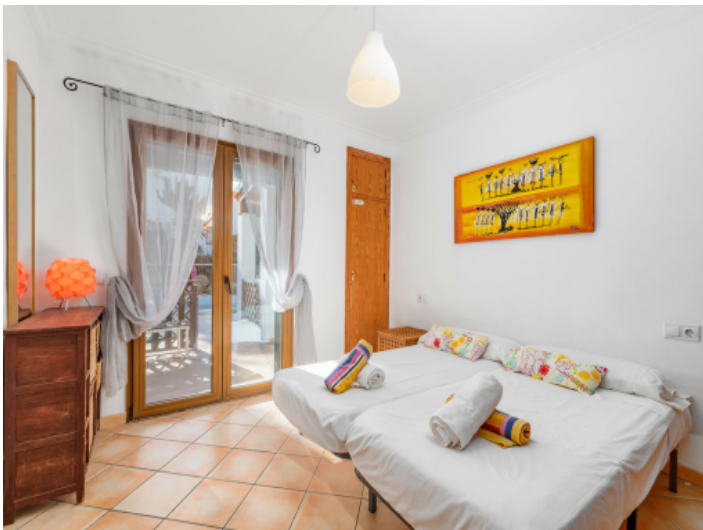
Schlafzimmer im Erdgeschoss