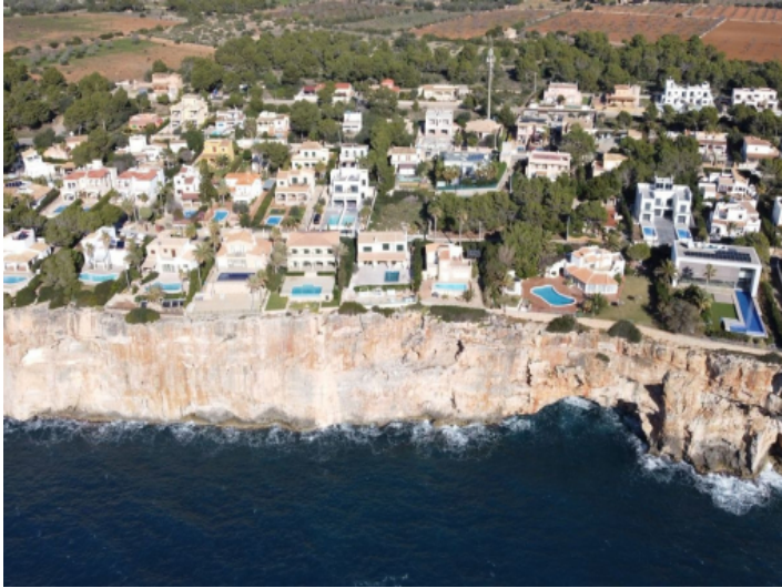
Die Villa aus der Vogelperspektive