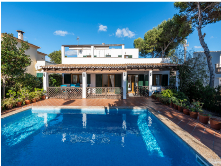
Poolbereich mit Terrasse und Pflanzen