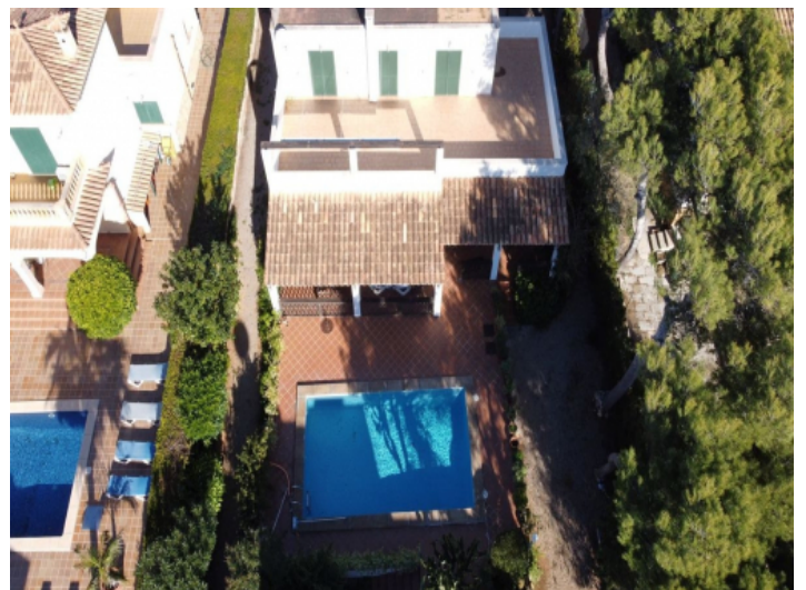
Außenansicht und Poolbereich