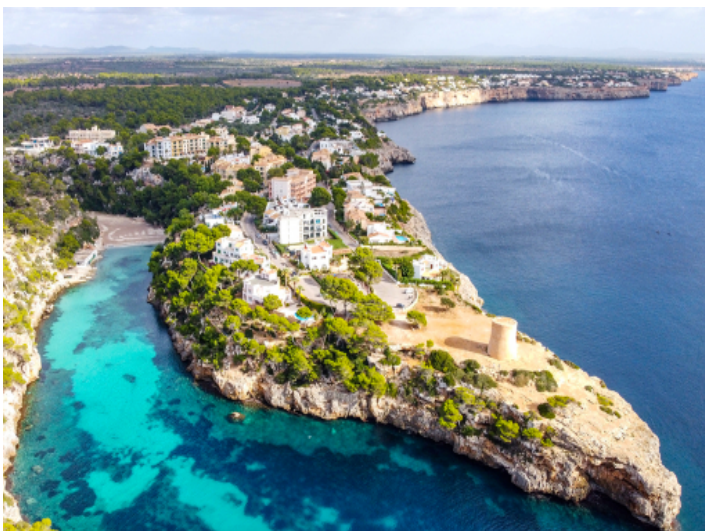
Cala Pi von oben