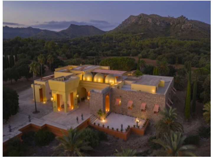
Außenansicht bei Nacht