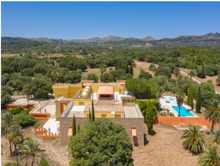
Ansicht des Anwesens in absoluter Privatsphäre