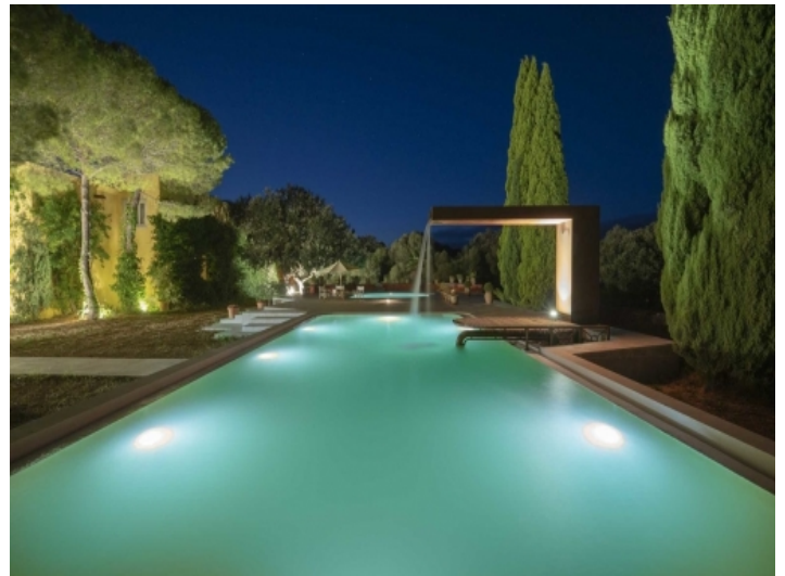
Großer, traumhafter Poolbereich