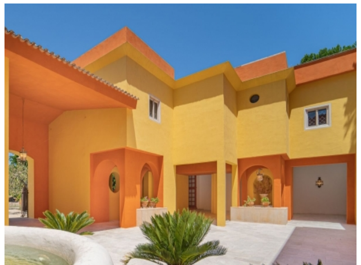
Außenansicht und Außenbereich