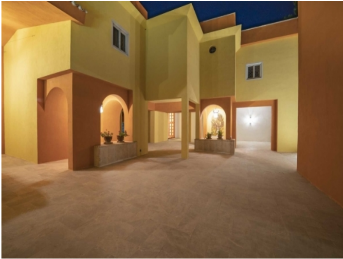
Außenansicht und Außenbereich