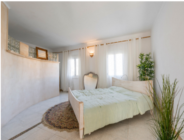
Eines von 2 Schlafzimmern