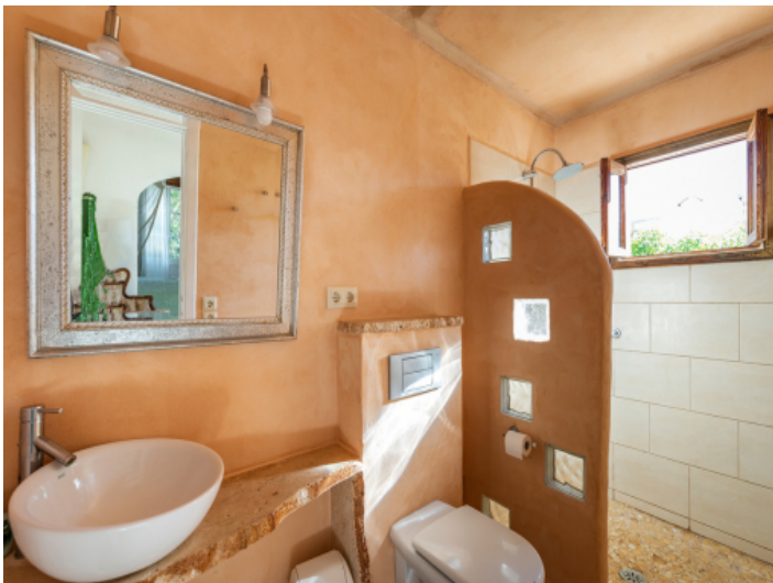
Helles Badezimmer mit Dusche