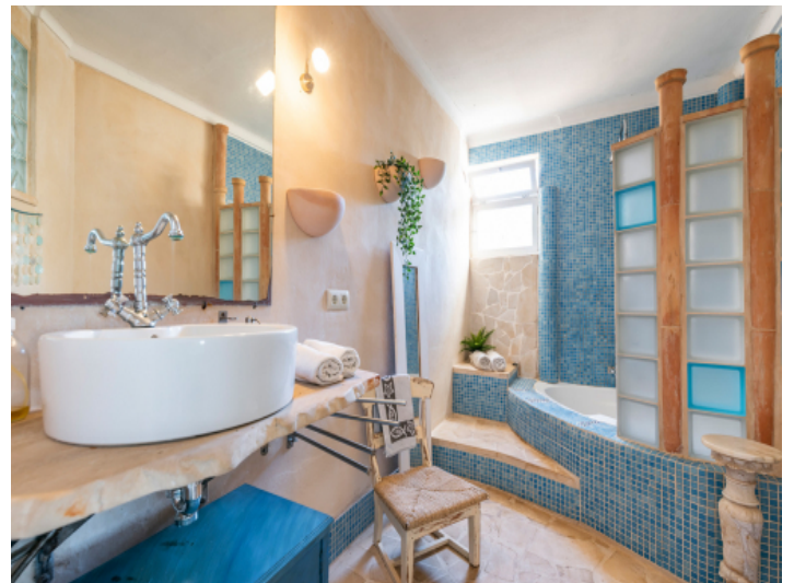
Schönes Badezimmer mit Wanne