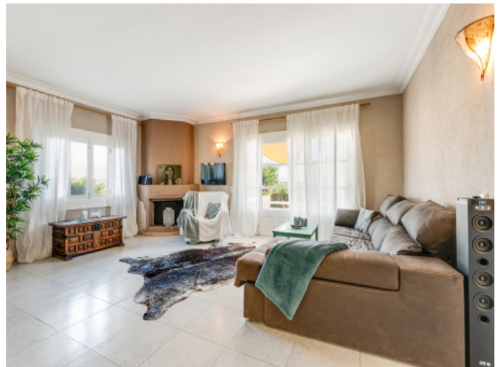
Schöner Wohnbereich mit Terrassenzugang