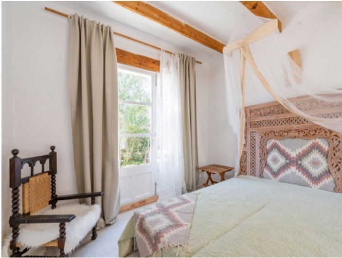
Schlafzimmer mit Terrassenzugang