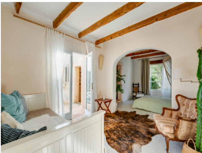
Großes Schlafzimmer mit Loungecke