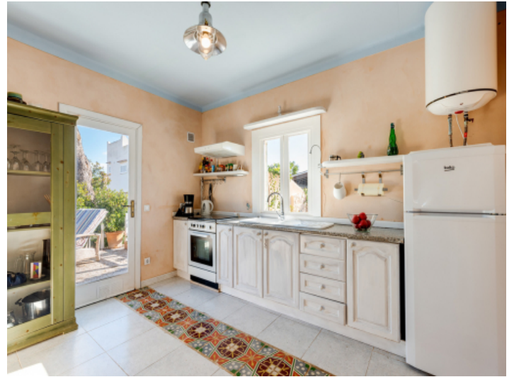
Sonnige Küche mit Terrassenzugang