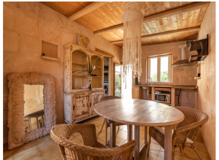
Sommerhaus mit Küche