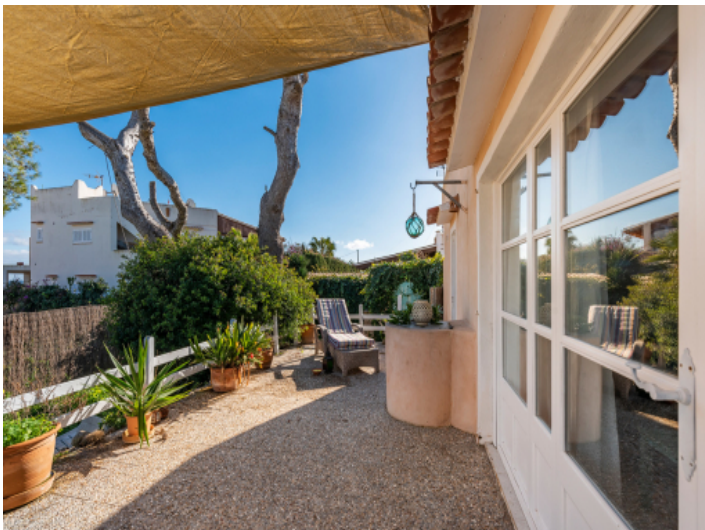
Terrasse mit Zugang zum Haus