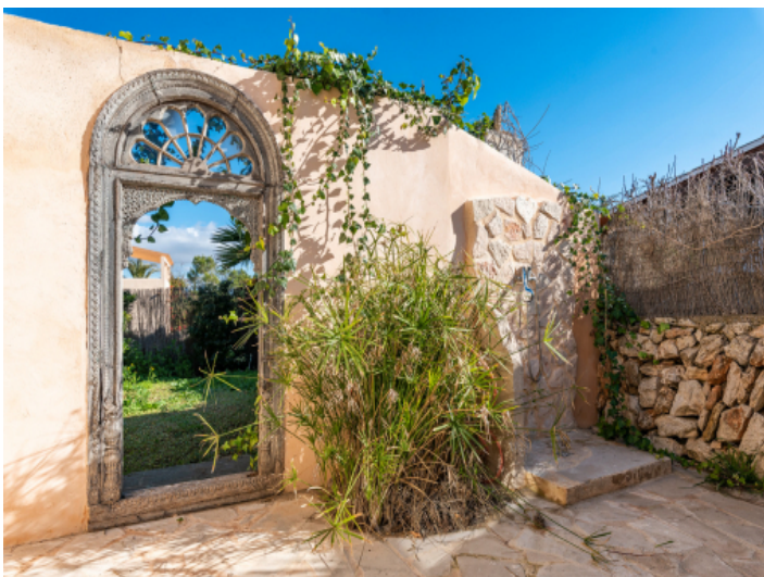
Außendusche und Garten