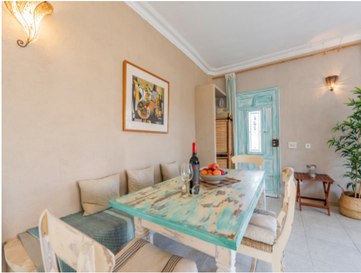
Essbereich mit Blick zum Eingang