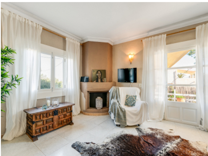
Gemütlicher Kamin für Wintertage