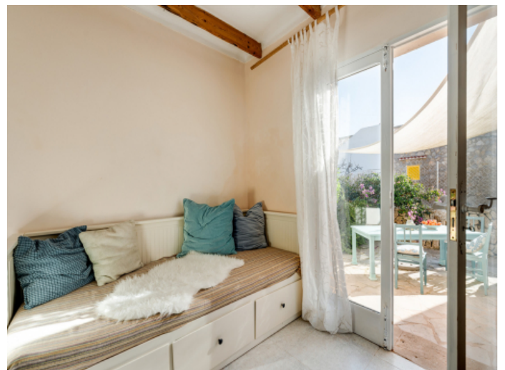
Zugang zu einer weiteren Terrasse