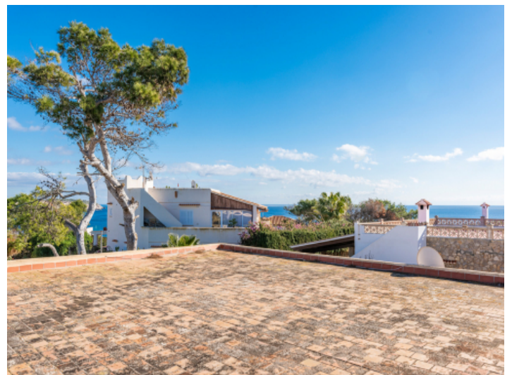
Dachterrasse mit Meerblick