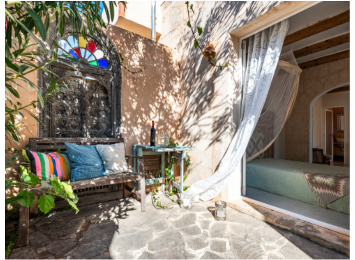
Terrasse mit viel Charakter