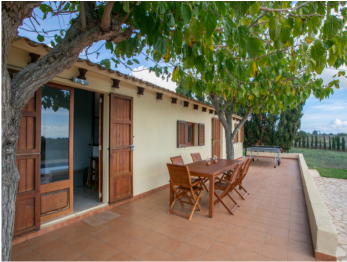
Essbereich auf der Terrasse