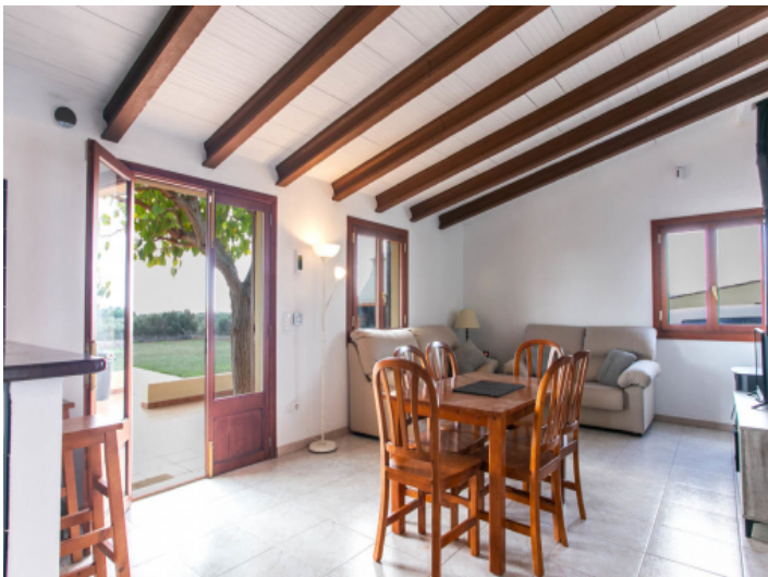
Heller Wohn- und Essbereich