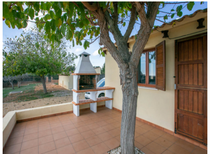
Grillbereich auf der Terrasse