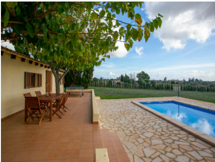
Terrasse und Pool