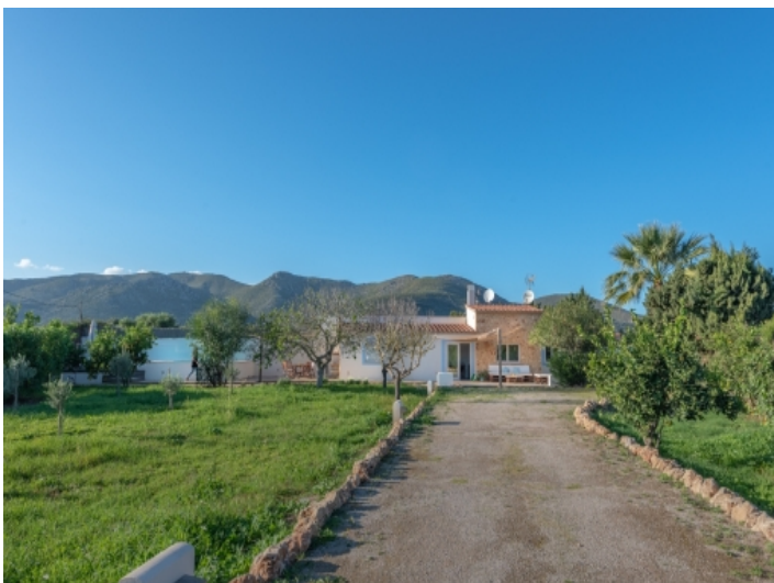
Zufahrt zur Finca