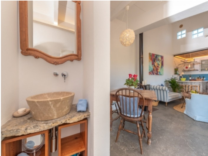
Wohnbereich und Badezimmer