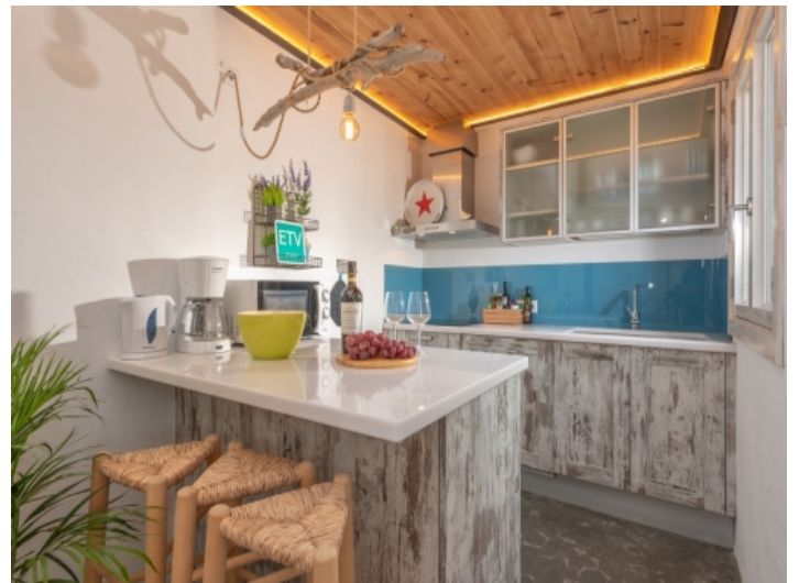
Offene, voll ausgestattete Küche