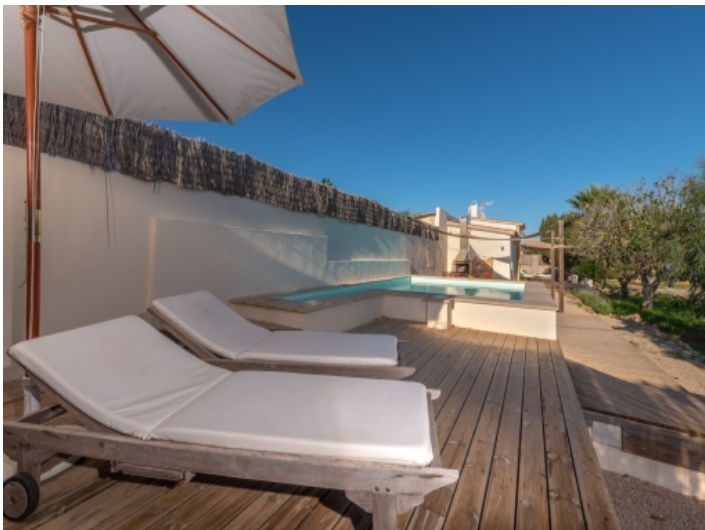
Pool mit Sonnenterrasse