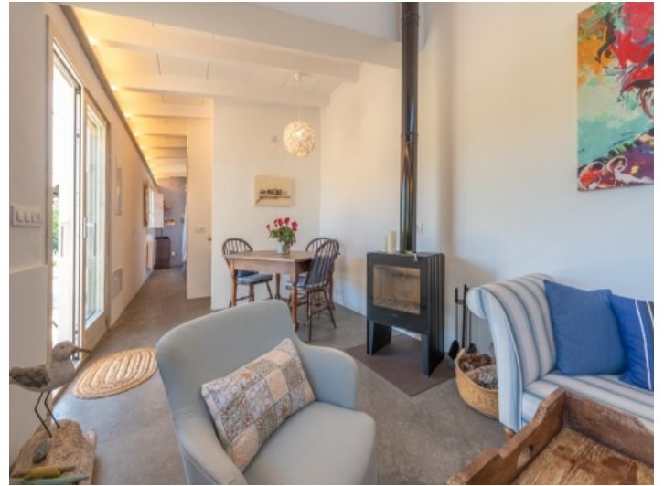
Wohn-und Essbereich mit Kamin