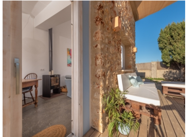
Wohnbereich und Terrasse