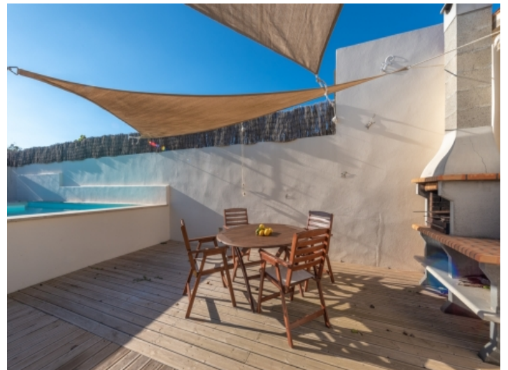
Grill- und Essbereich