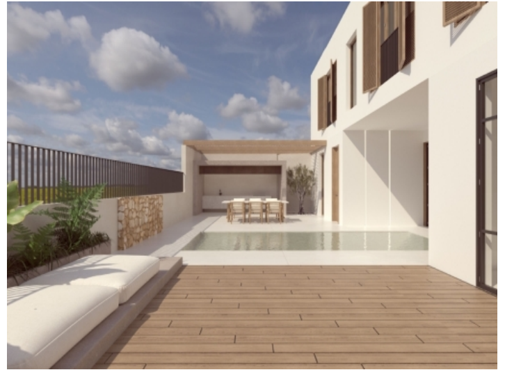
Moderne Neubauvilla mit Pool in Santanyi