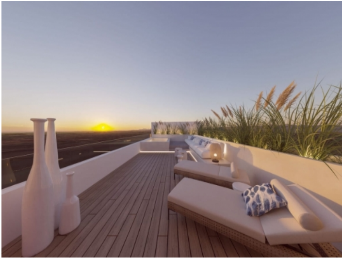
Eindrucksvolle Dachterrasse mit Ausblick