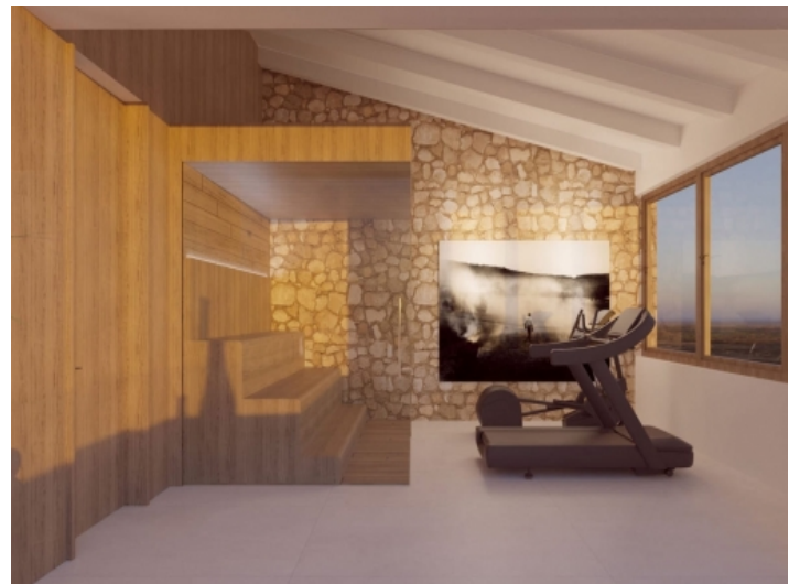
Gym und Sauna