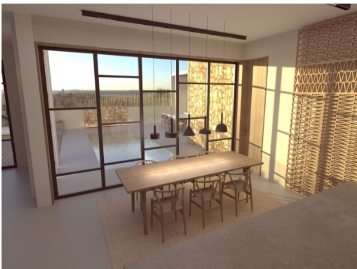
Ansicht des Essbereichs