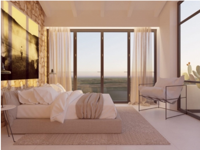
Schlafzimmer mit Ausblick