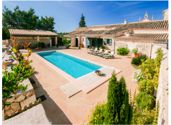
Großer, sonniger Poolbereich