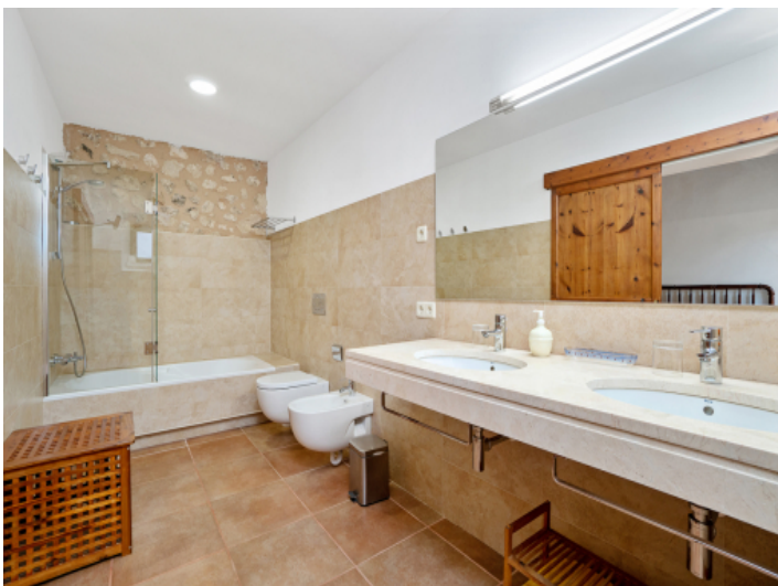
Moderne en Suite Badezimmer