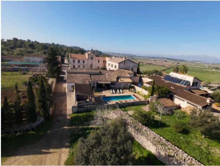
Ansicht der Luxusresidenz