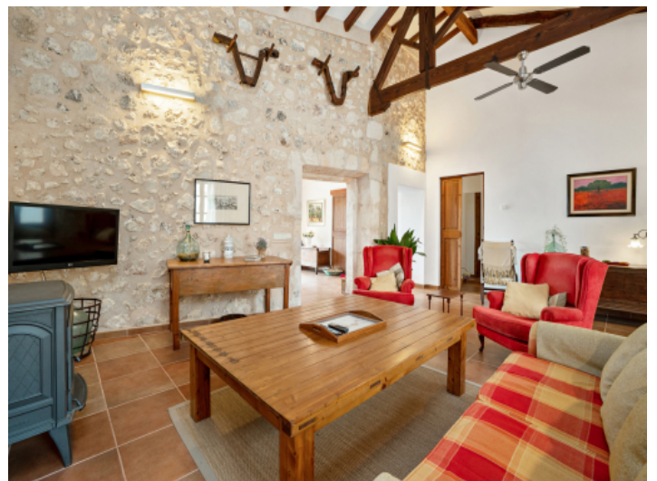
Authentischer und gemütlicher Wohnbereich