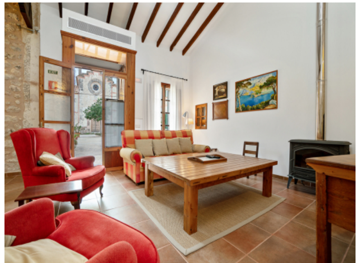
Heller Eingangs- und Wohnbereich