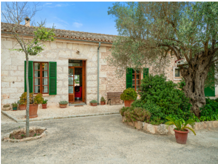
Zugang zum Haus