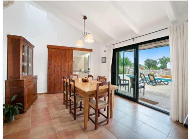
Essbereich mit Terrassenzugang