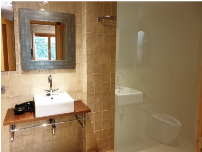
Eines von 7 Badezimmern