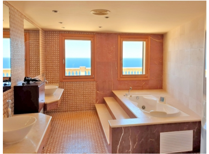
Eines von 7 Badezimmern