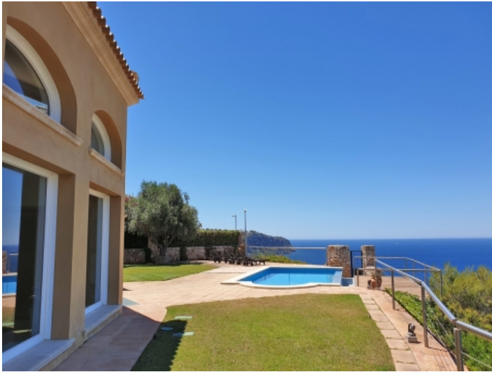
Seitenansicht der Villa