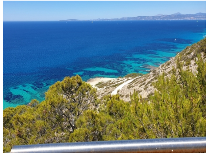
Traumhafter Blick von der Terrasse