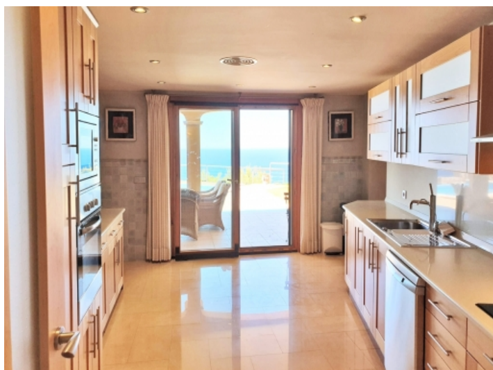
Große Küche mit Terrassenzugang