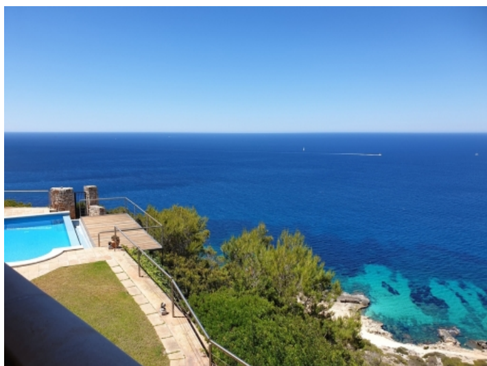
Pool über den Klippen