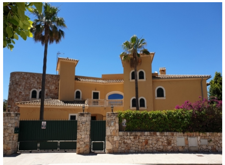
Frontansicht der Villa