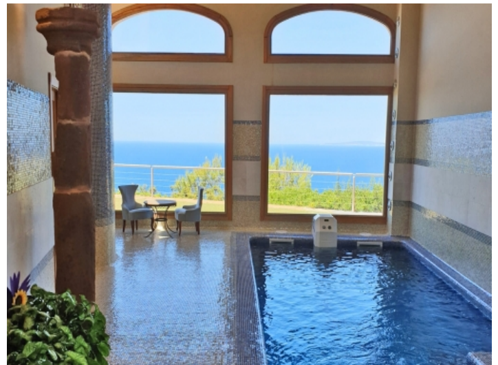
Innenpool mit Panoramameerblick