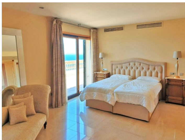
Eines von 5 Schlafzimmern