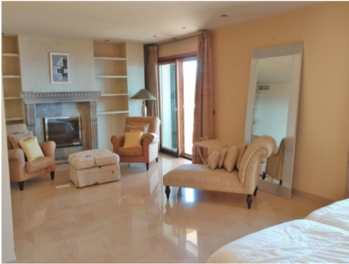
Eines von 5 Schlafzimmern