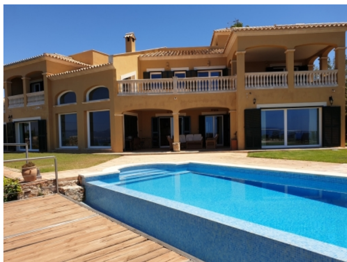
Außenansicht der Villa mit Pool