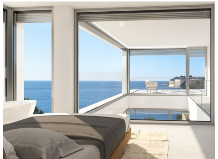
Schlafzimmer mit Panoramafenstern