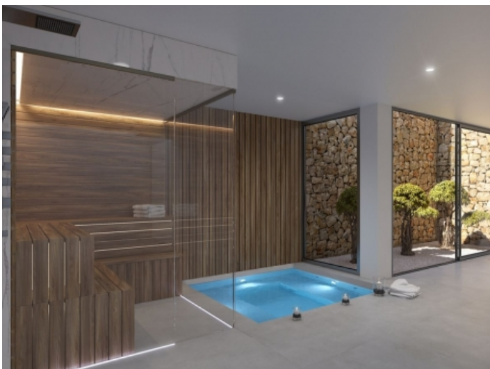
Attraktiver Spabereich mit Sauna