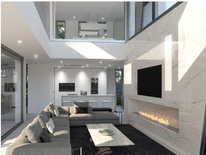
Moderner Wohnbereich mit Kamin