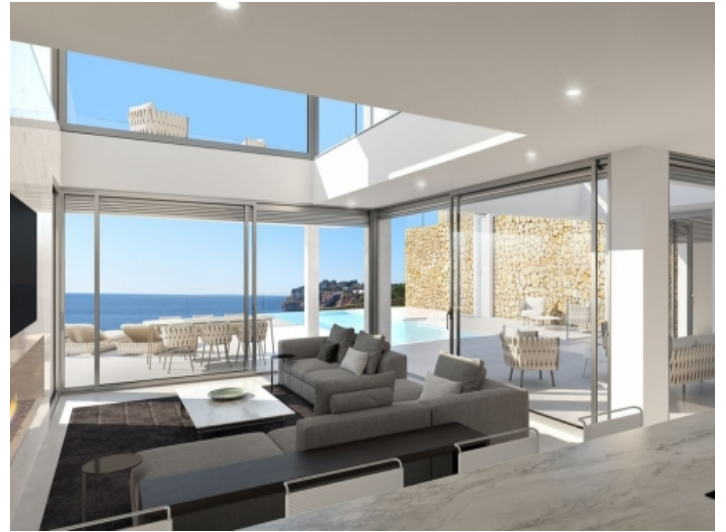
Großzügiger Wohnbereich mit Zugang zum Pool