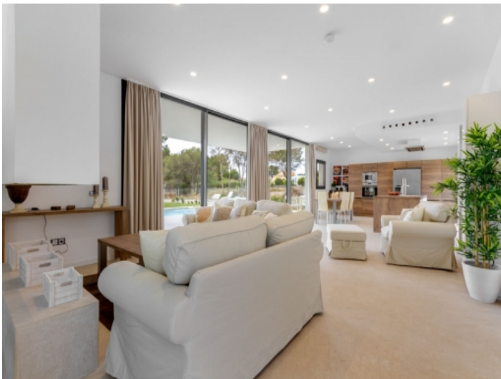
Wohnbereich mit Panoramafenstern