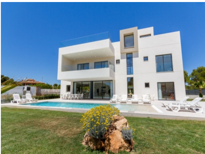
Pool- und Gartenbereich