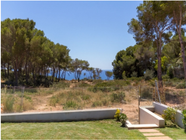
Direkter Zugang zur Küste