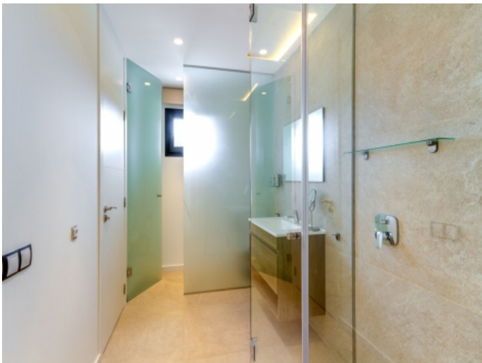
Eines von 4 Badezimmern