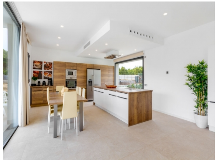
Moderne Küche und Essbereich