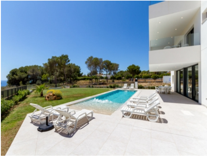
Herrlicher Pool- und Gartenbereich