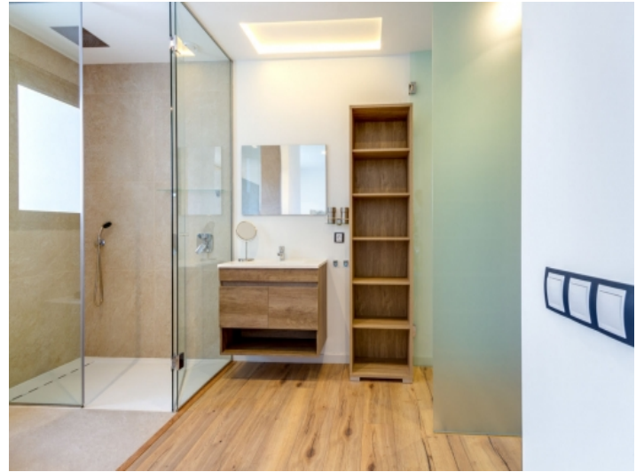
Eines von 4 Badezimmern