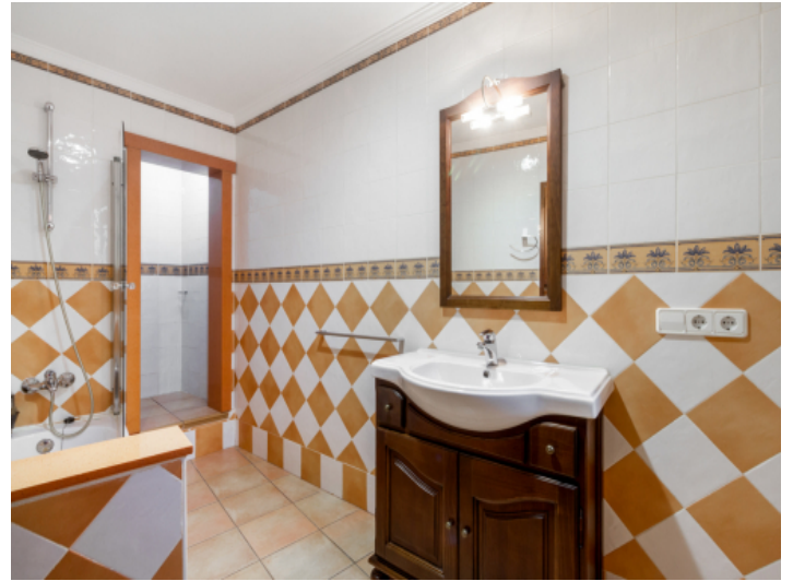
Eines von 3 Badezimmern