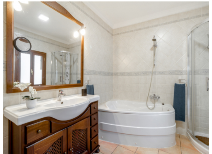
Eines von 3 Badezimmern