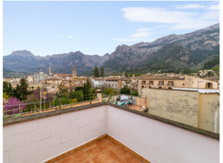
Dorfhaus mit großer Dachterrasse und Bergblick in Soller