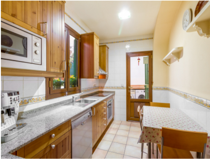
Küche mit Zugang zum Innenhof