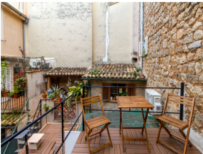
Charmante Terrasse im ersten Stock