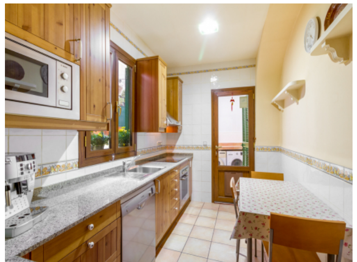
Küche mit Zugang zum Innenhof