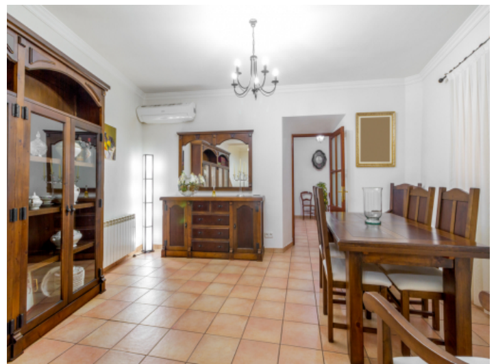
Geräumiger Wohn- und Essbereich