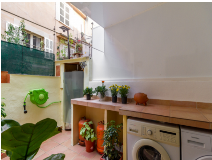
Innenhof im Erdgeschoss