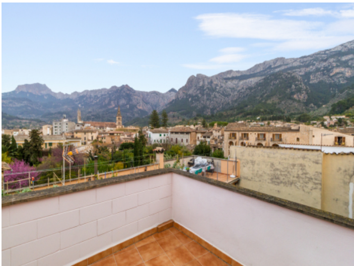
Dorfhaus mit großer Dachterrasse und Bergblick in Soller