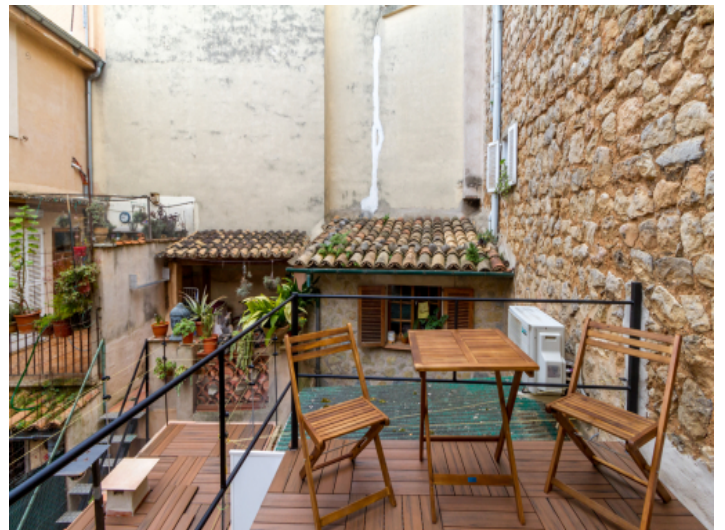
Charmante Terrasse im ersten Stock