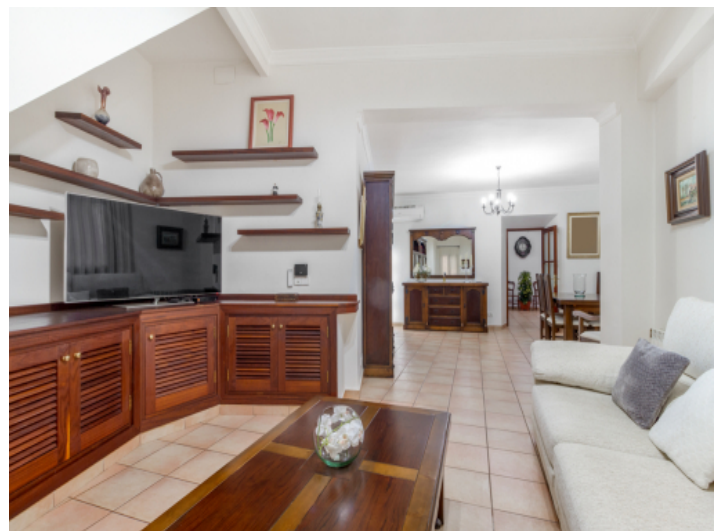
Blick zum Essbereich