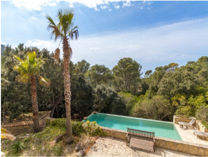
Poolbereich umgeben von Natur