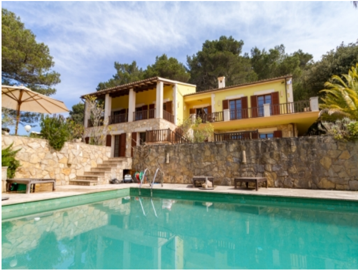
Poolbereich mit Sonnenliegen