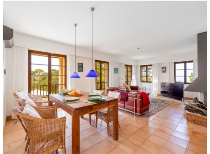
Lichtdurchfluteter Wohn- und Essbereich