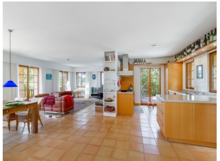
Wohnbereich und offene Küche