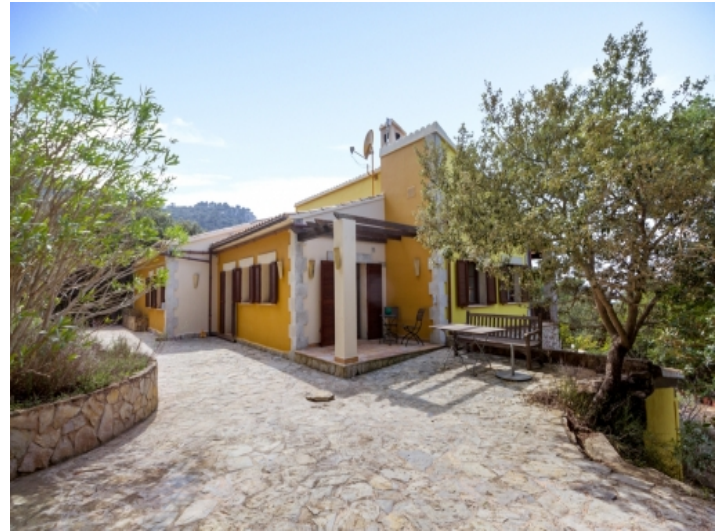
Zugang zum Anwesen