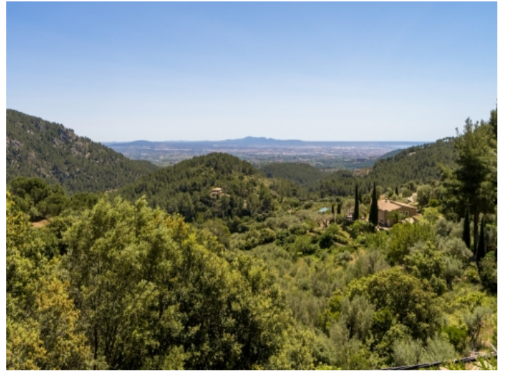
Beeindruckender Blick über die Landschaft