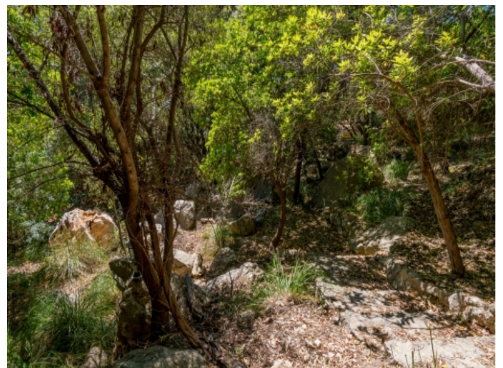
Ansicht des Außenbereiches