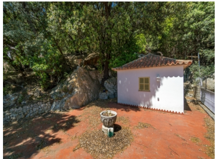
Terrasse mit absoluter Privatsphäre