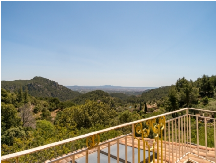
Weitblick vom Obergeschoss