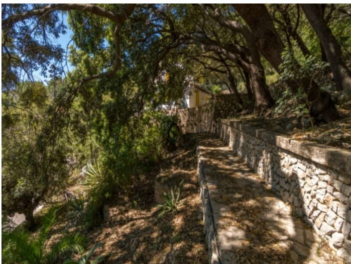
Ansicht des Außenbereiches