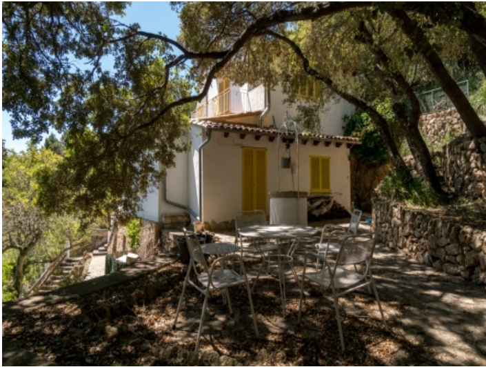
Das Haus befindet sich inmitten von Natur