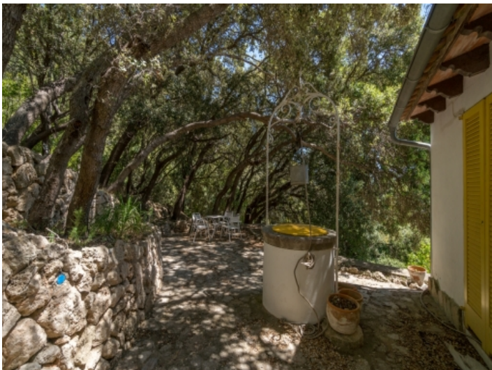
Entspannter Platz unter den Bäumen