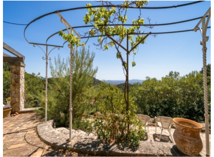
Terrasse mit wundervollen Ausblick