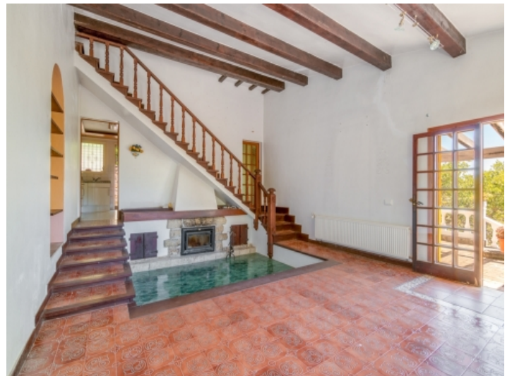
Großer Wohnbereich mit Kamin