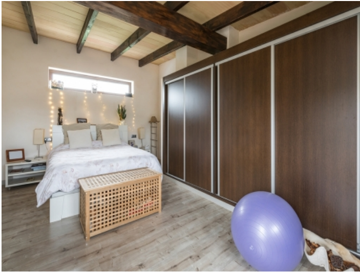
Alternative Ansicht des Schlafzimmers