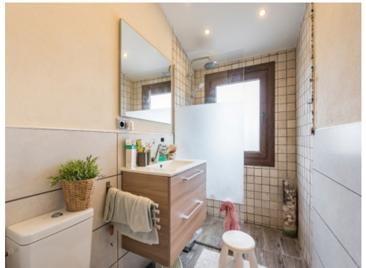
Eines von 2 Badezimmer