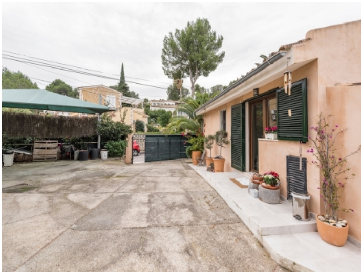
Seitenansicht des Hauses mit Terrasse