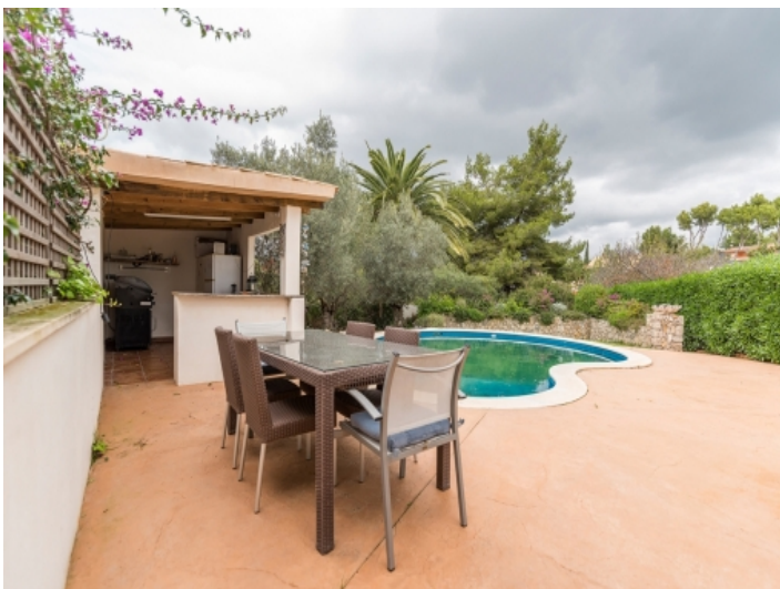
Grillbereich mit Bar