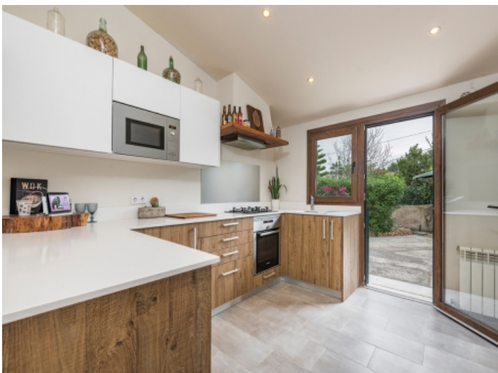
Moderne Küche mit Zugang nach Außen