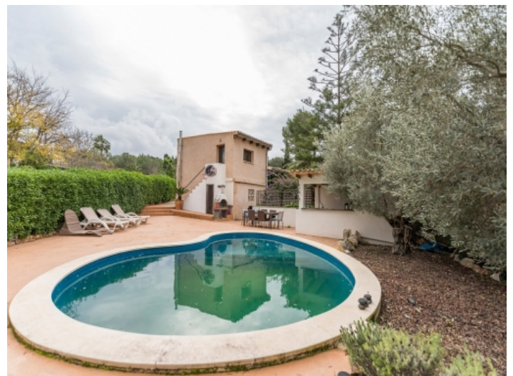
Ansicht des privaten Pools