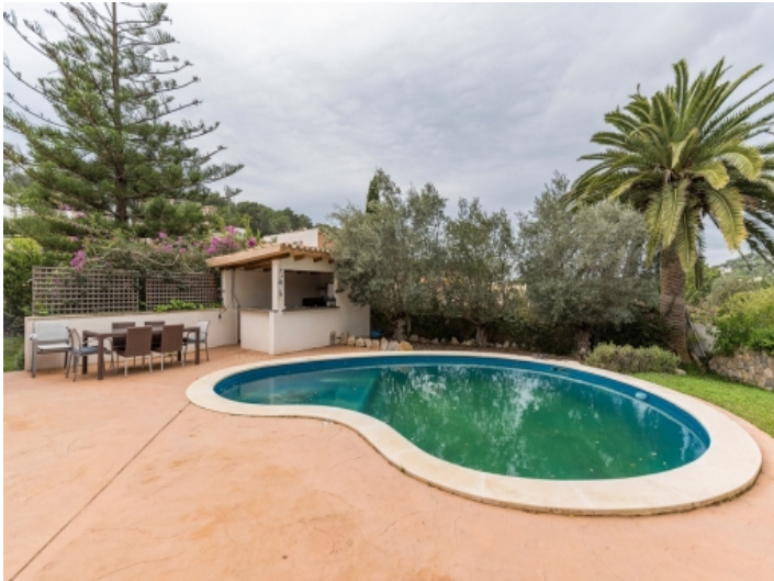
Großzügiger Pool- und Grillbereich