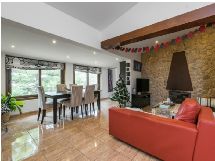
Offener Wohn-und Essbereich