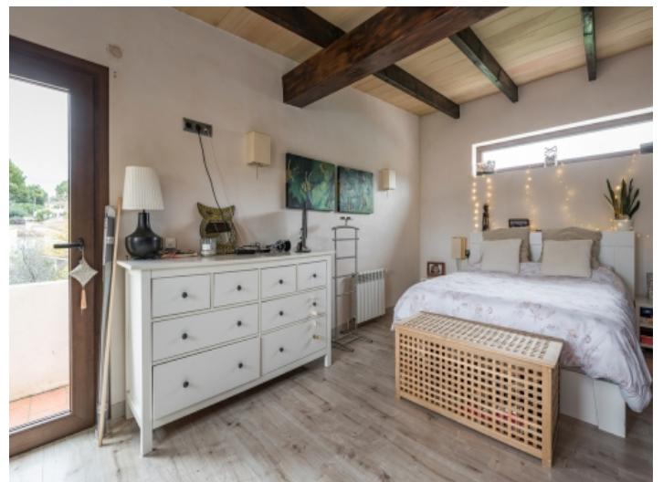
Hauptschlafzimmer mit Terrasse