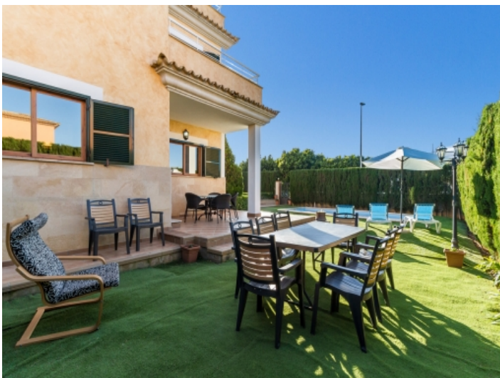
Essbereich im Garten