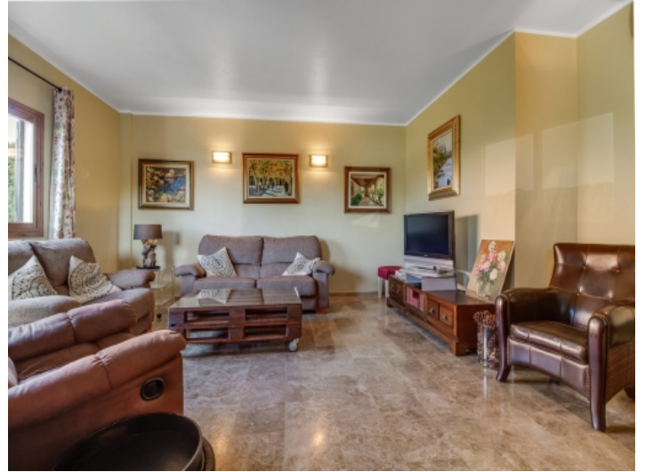
Gemütlicher und großzügiger Wohnbereich