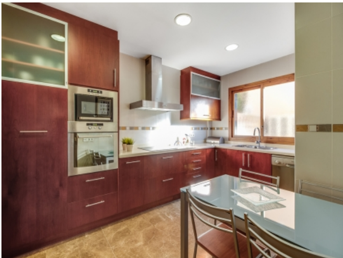
Voll ausgestattete, charmante Küche