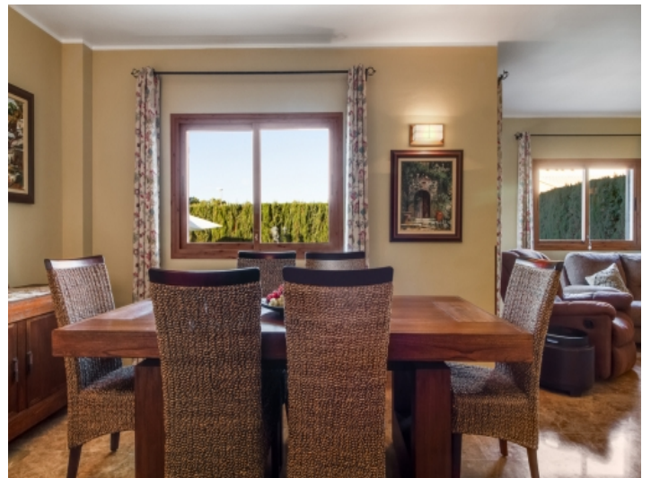
Wunderschöner, heller Essbereich