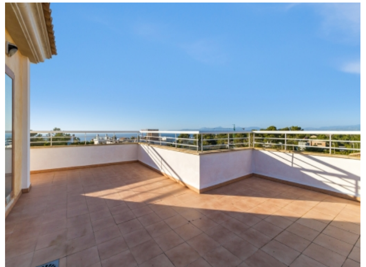
Traumhafte Terrasse mit Ausblick