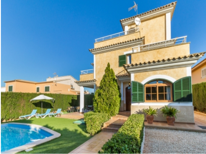
Herrliche Frontansicht des Hauses