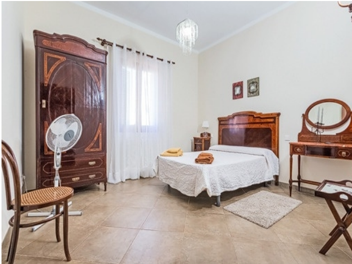
Eins von sechs Schlafzimmern