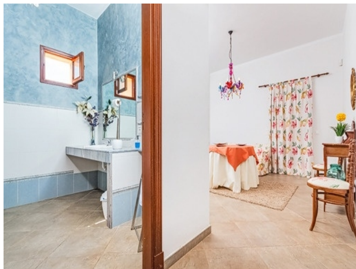
Schlafzimmer mit Badezimmer en suite