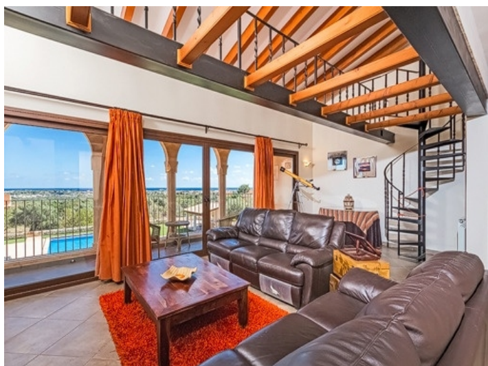
Heller Wohnbereich im Obergeschoss