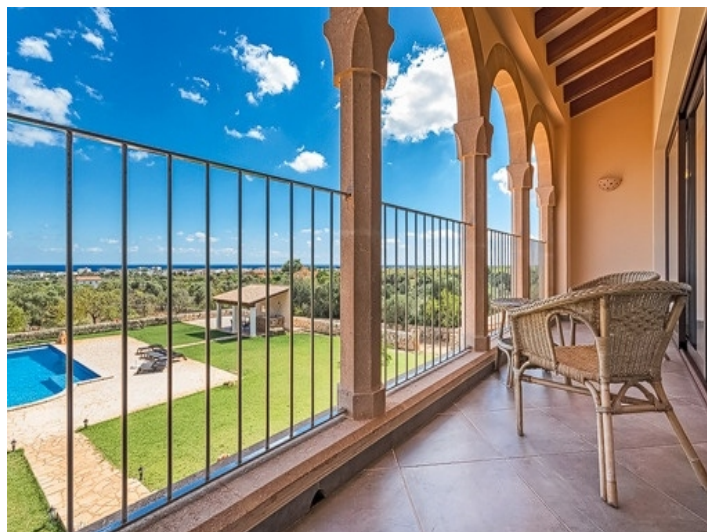
Toller Meerblick von der Terrasse