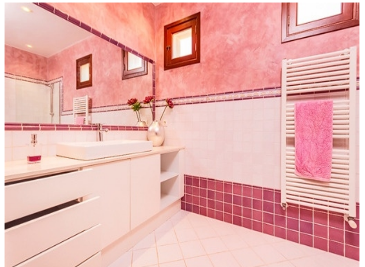
Weiteres Badezimmer mit Heizung