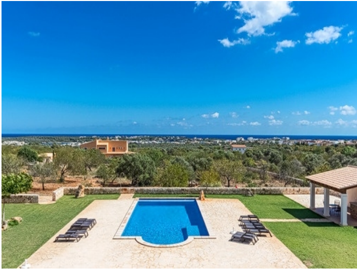
Fantastischer Blick auf das Meer und den Garten