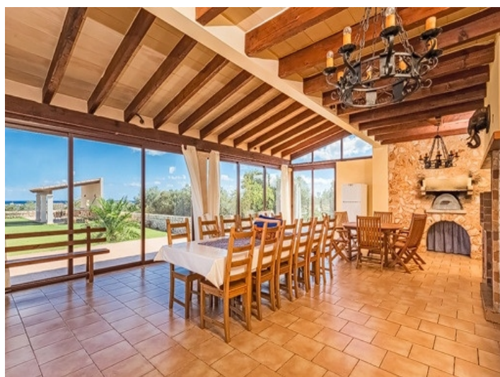
Alternative Ansicht vom Essbereich