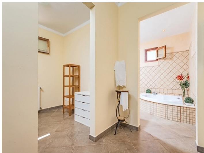
Badezimmer en suite