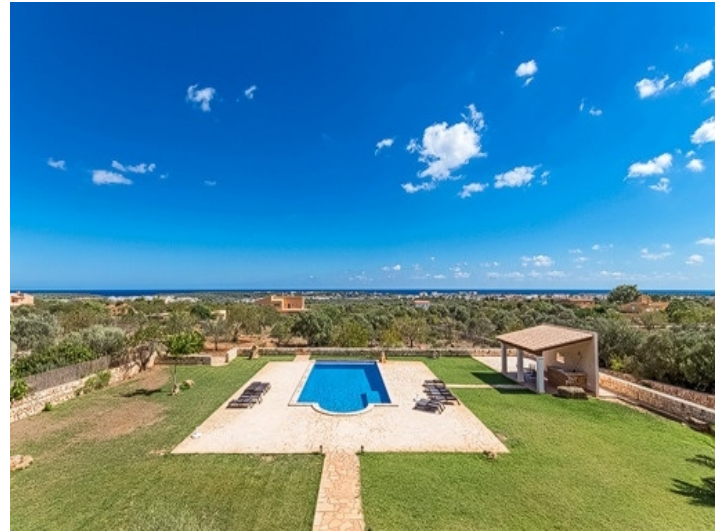
Panoramaaussicht von der Terrasse