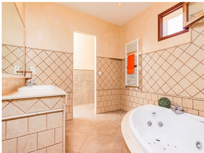
Hauptbadezimmer mit Badewanne