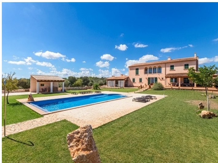
Finca mit großzügigem Grundstück von 21.000 qm