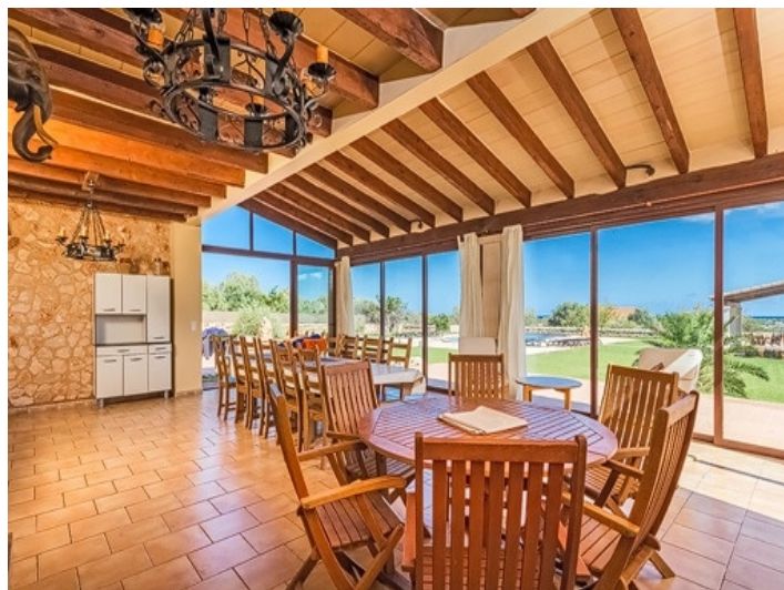
Überdachte Terrasse mit Panoramafenstern