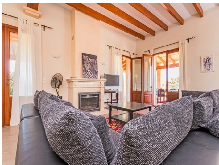
Gemütlicher Wohnbereich mit Kamin