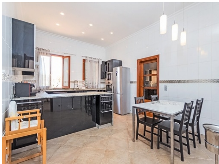
Alternative Ansicht der Küche