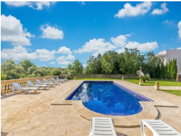
Toller Poolbereich und Garten