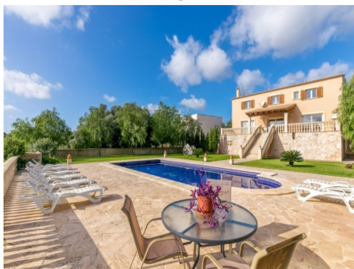
Idyllischer Garten und Poolbereich mit Entspannungsmöglichkeiten