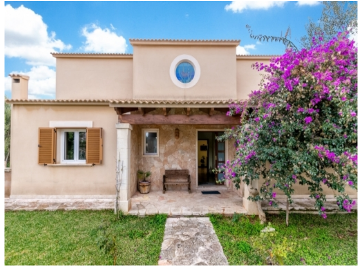
Frontansicht und Eingang in die Immobilie