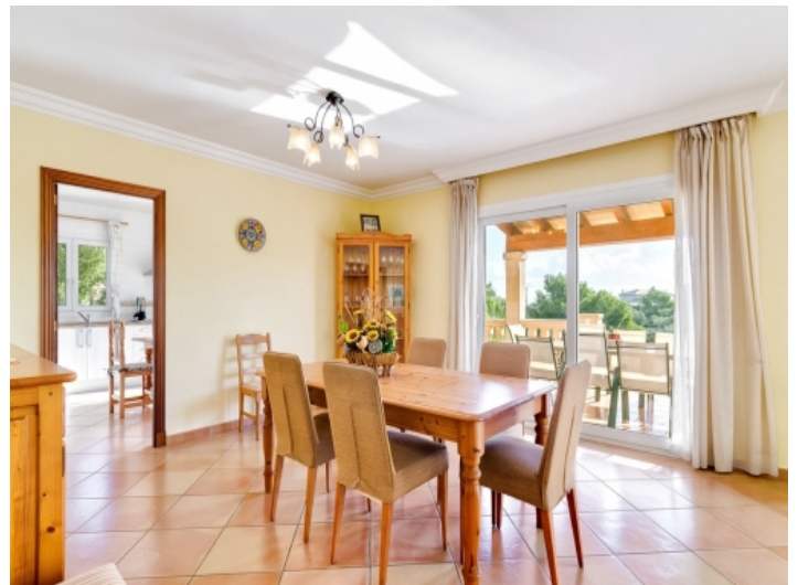
Heller Essbereich mit Terrassenzugang