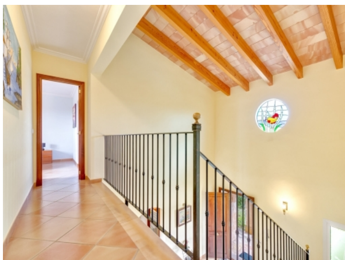
Treppenaufgang in das Obergeschoss