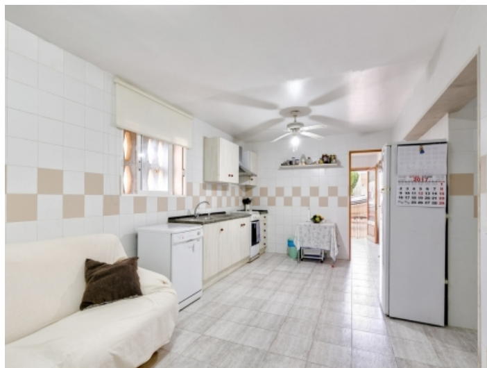
Zweite, voll ausgestattete Küche