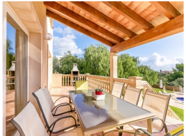
Überdachte Terrasse mit Sitzgelegenheit und Grill