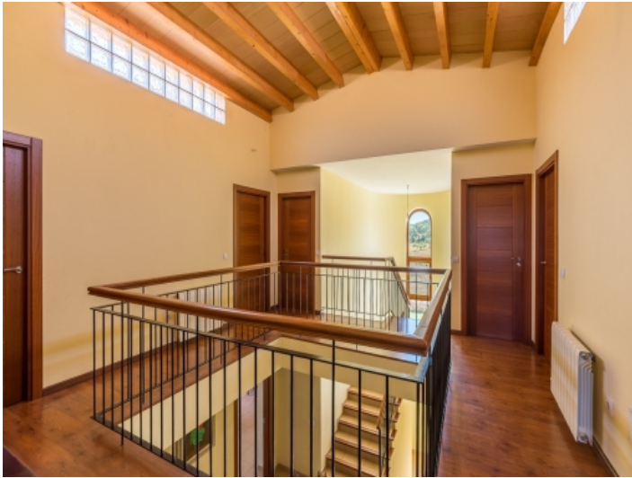
Galerie auf der oberen Etage