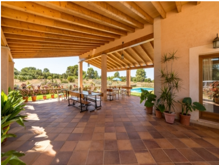
Überdachte Terrasse mit Essbereich