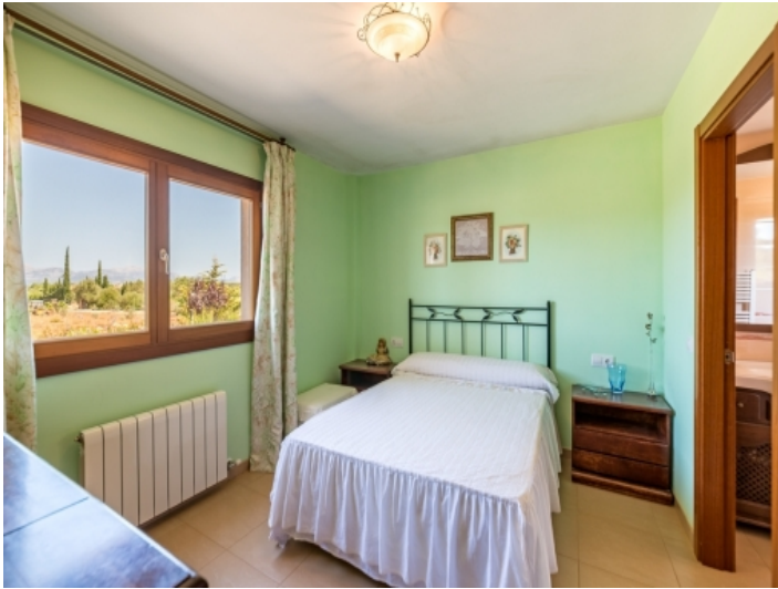
Schlafzimmer mit Heizung