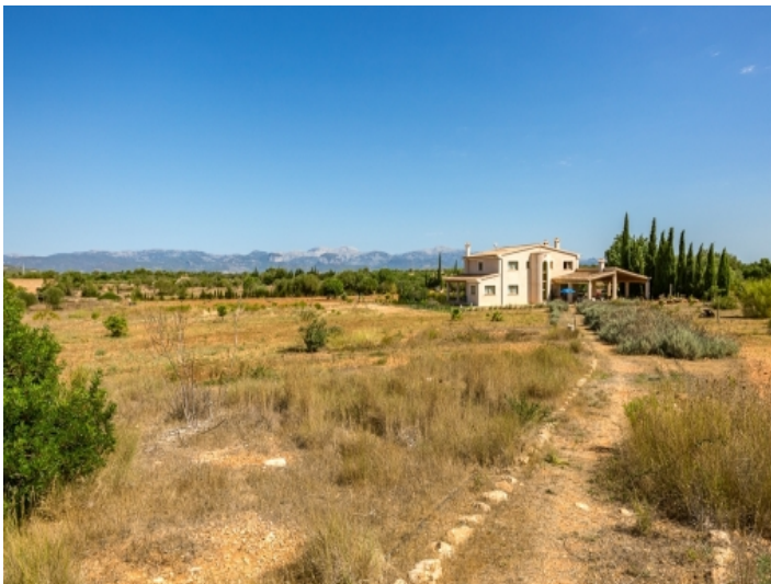
Blick über das Grundstück