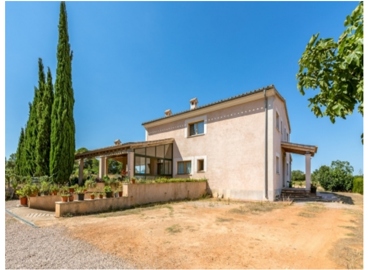
Blick auf die Rückseite der Finca