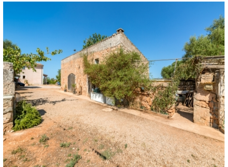
Großzügiges Grundstück mit Finca