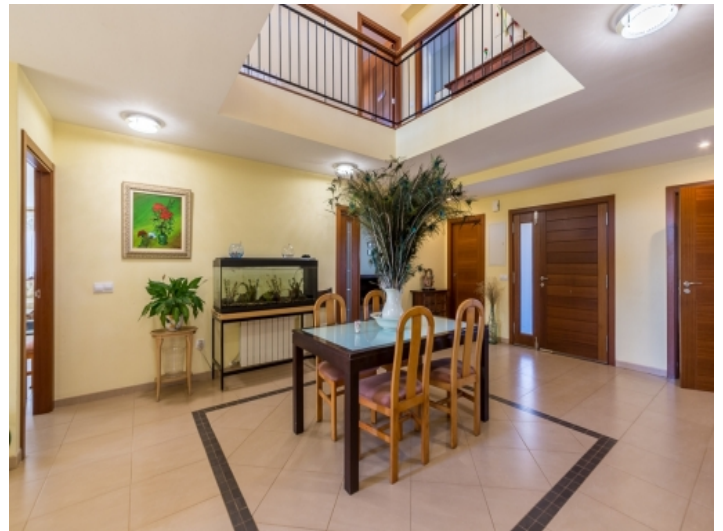
Essbereich mit Galerie