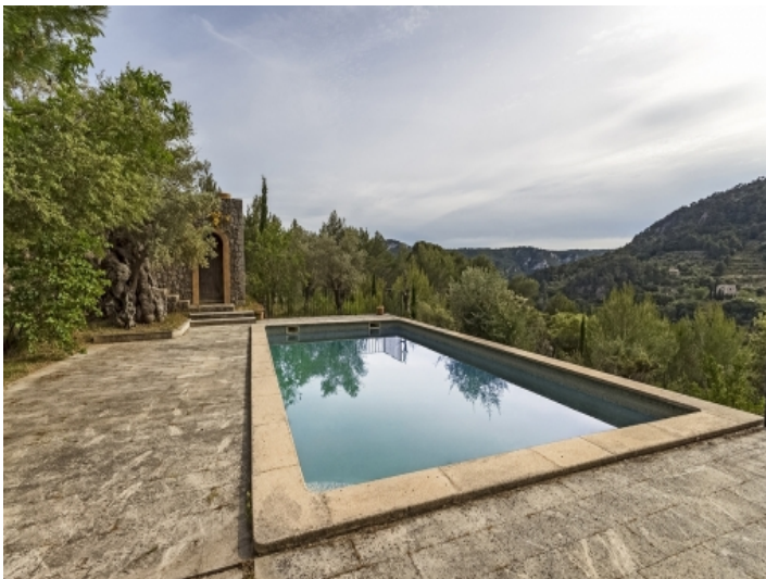
Pool mit Ausblick