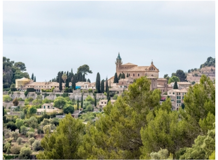
Blick auf Valldemossa