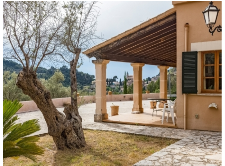
Terrasse und Blick auf Valldemossa