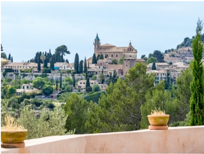
Blick auf Valldemossa