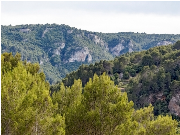
Blick aufs Gebirge