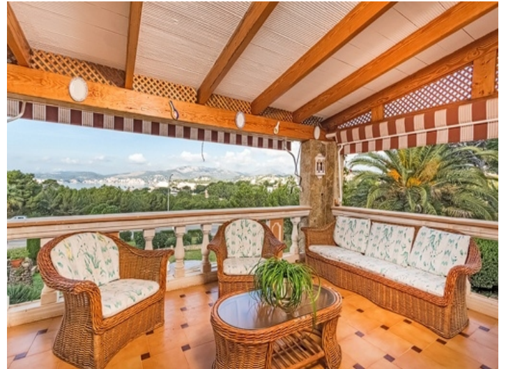
Loungebereich auf dem Balkon