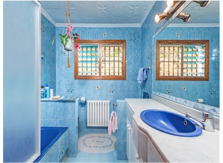
Badezimmer mit Badewanne und Tageslicht