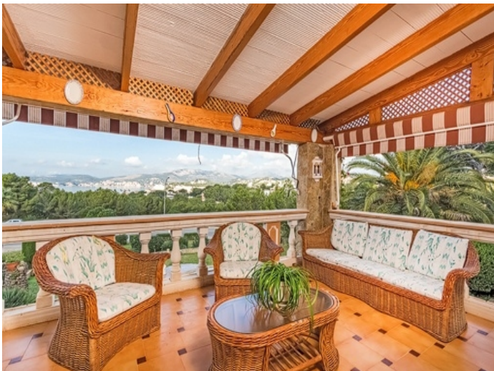
Loungebereich auf dem Balkon