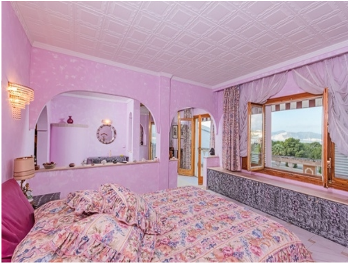
Schlafzimmer mit herrlichem Landschaftsblick