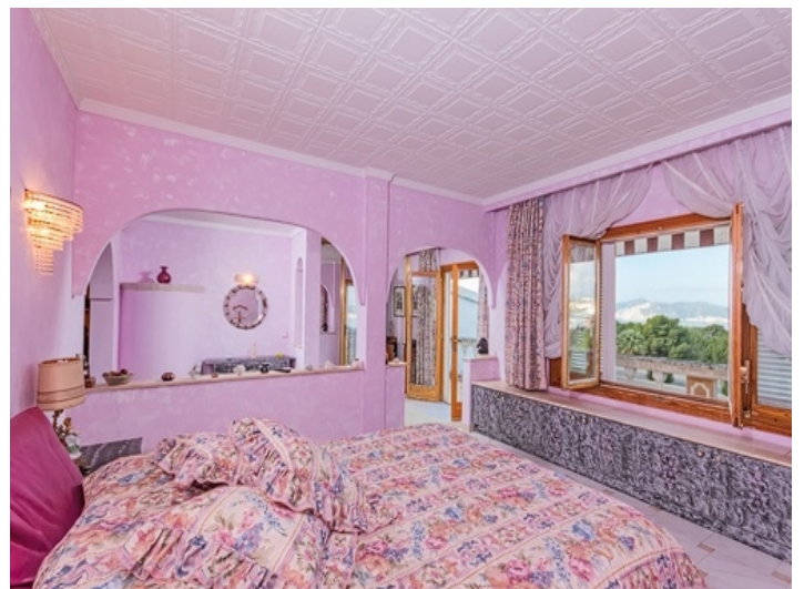
Schlafzimmer mit herrlichem Landschaftsblick