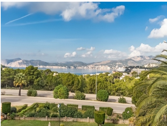
Einmaliger Meerblick von der Villa