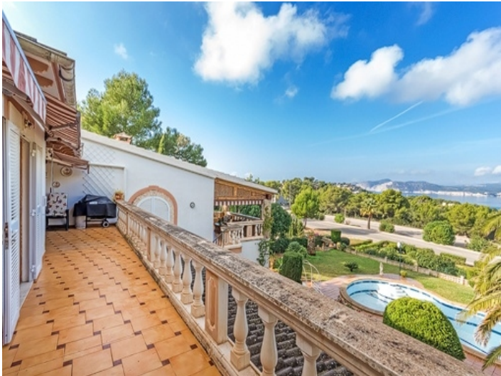
Beeindruckender Meerblick vom Balkon