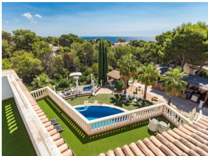
Blick von der Villa über das Grundstück