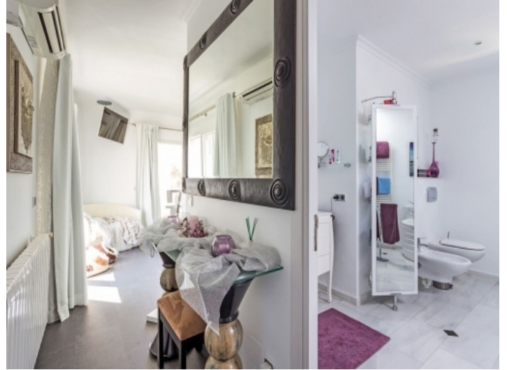
Blick vom Badezimmer en Suite auf das Schlafzimmer