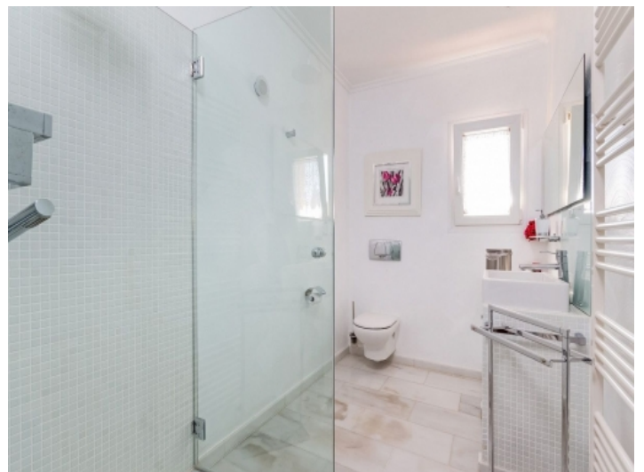
Tageslichtbadezimmer mit Dusche