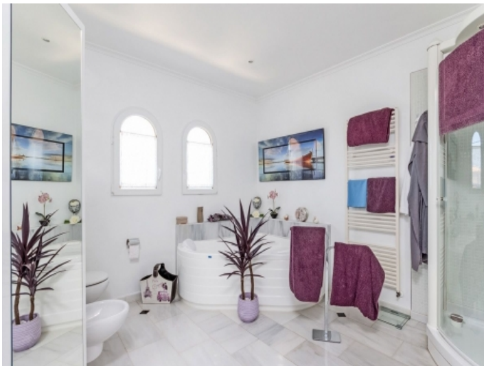
Badezimmer mit Badewanne und Dusche