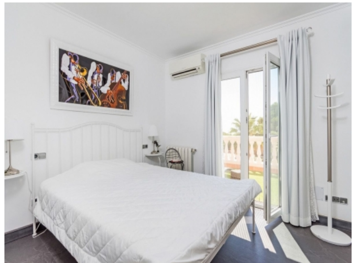
Schlafzimmer mit Panoramafenster