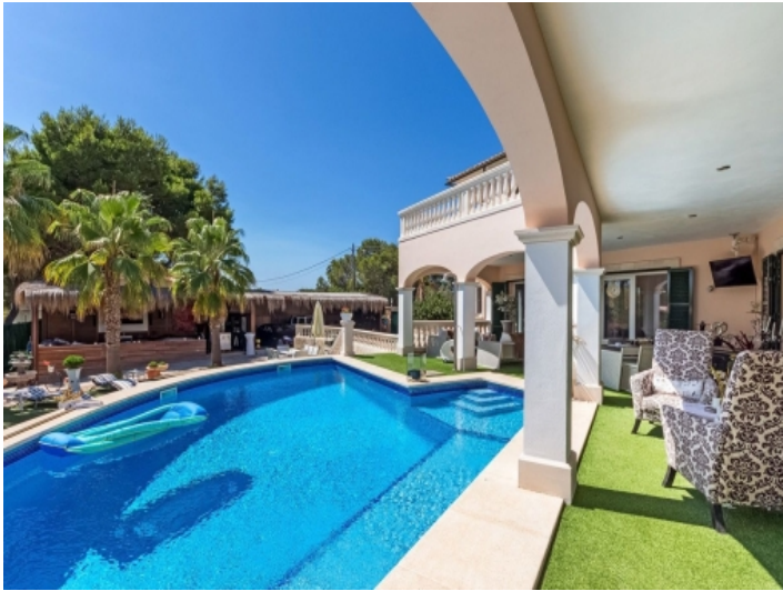
Blick von der überdachten Terrasse auf den Poolbereich