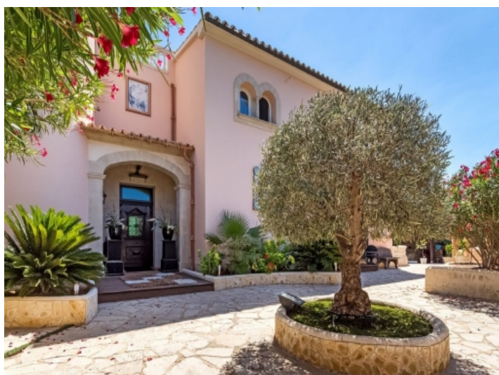
Eingangsbereich der Villa