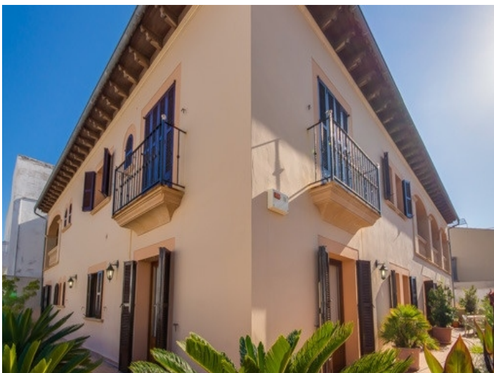
Blick auf die Außenfassade