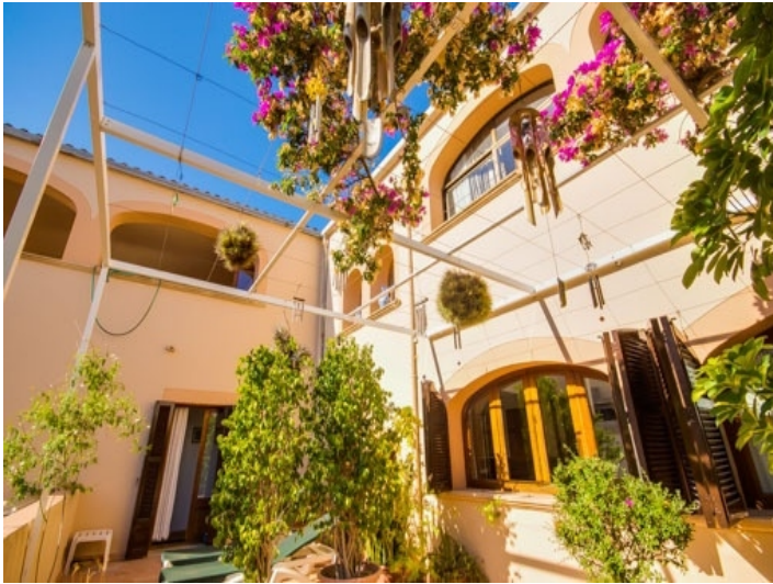
Blick vom Patio auf das Anwesen