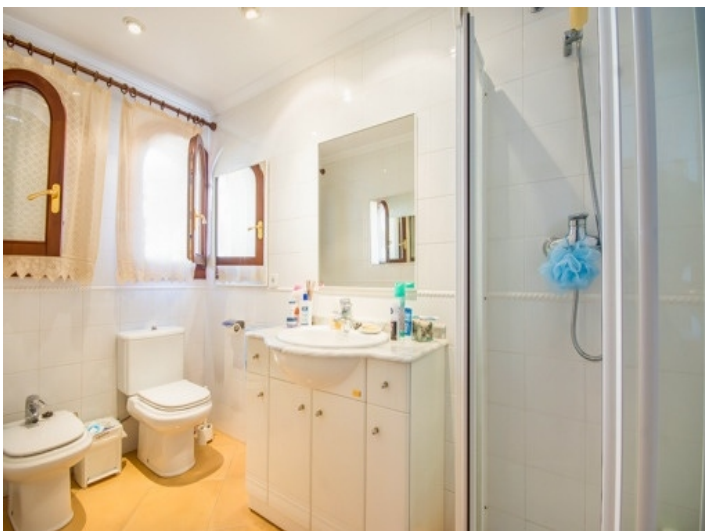
Tageslichtbadezimmer mit Dusche