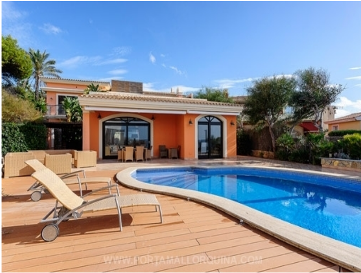
Außenansicht der Villa mit Pool