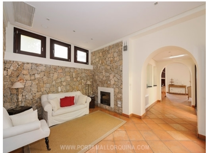
Sitzbereich mit Kamin