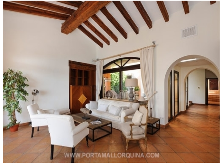
Wohnbereich mit Holzdeckenbalken