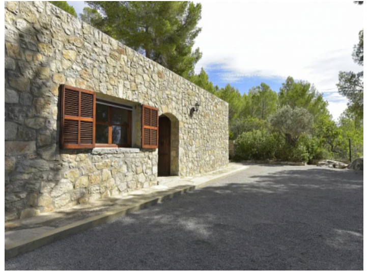
Cala Millor Finca