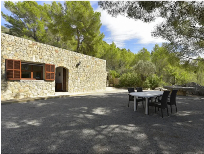
Cala Millor Finca