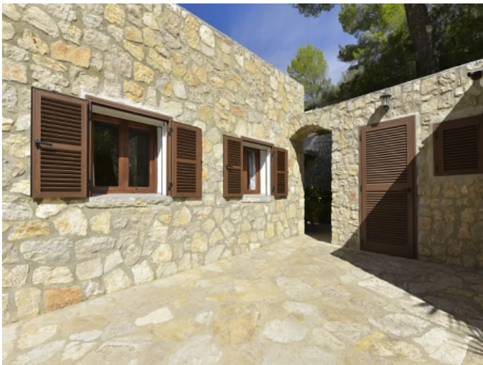
Cala Millor Finca