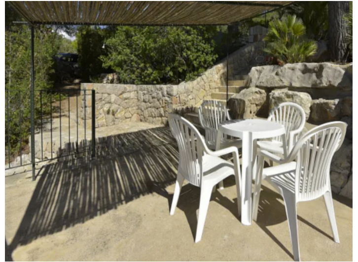
Cala Millor Finca