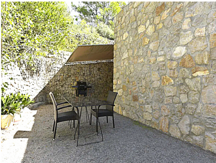
Cala Millor Finca