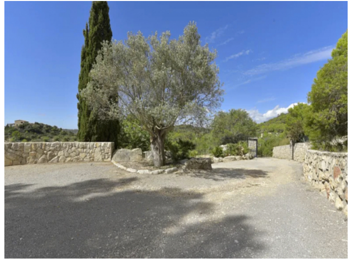
Cala Millor Finca