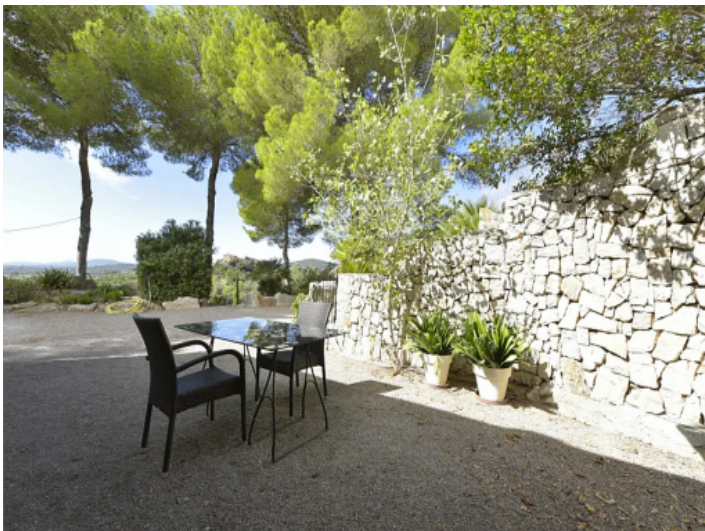
Cala Millor Finca