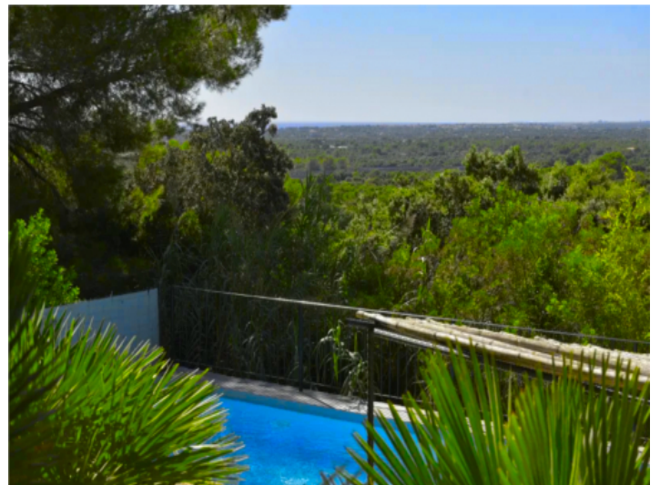
Cala Millor Finca