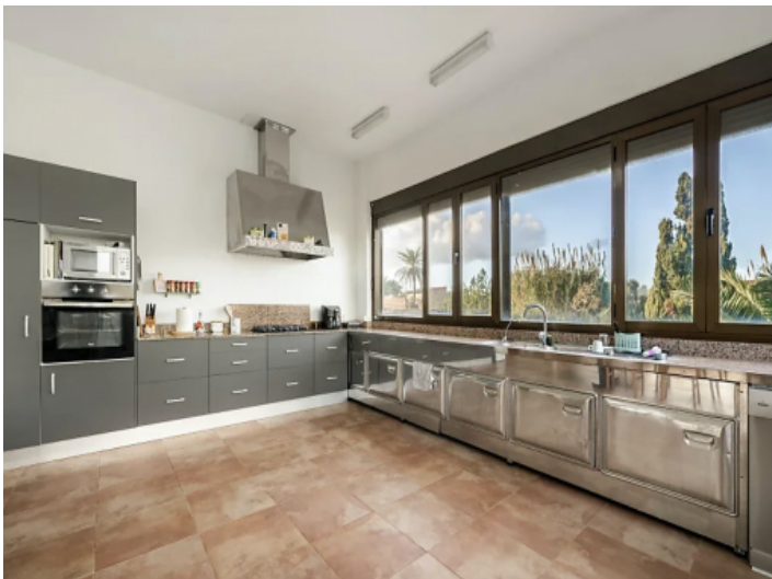
Son Mas Küche 2