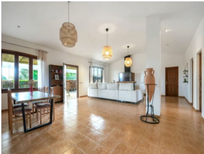
Son Mas Küche