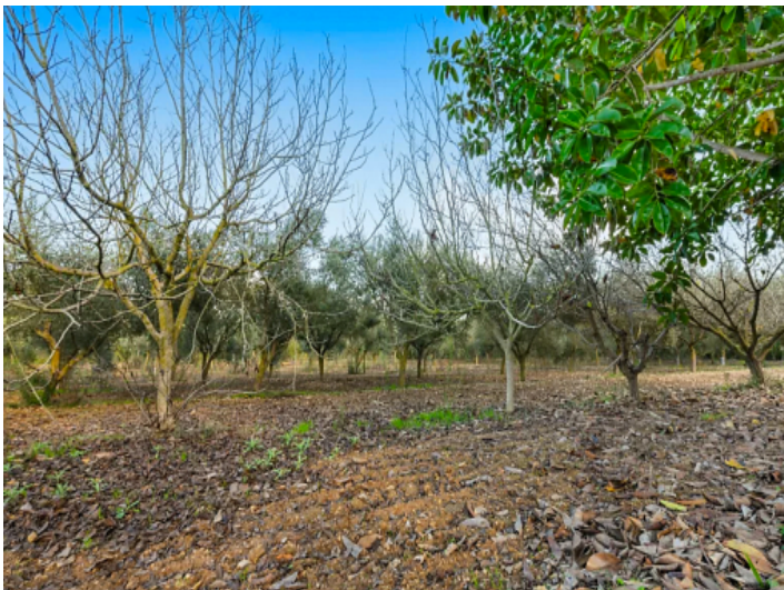
Son Mas Grundstück 2