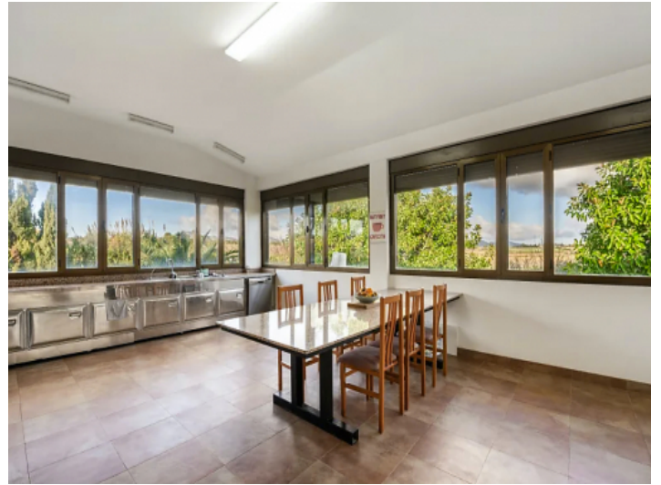
Son Mas Küche