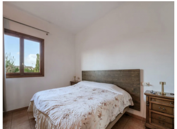
Son Mas Schlafzimmer