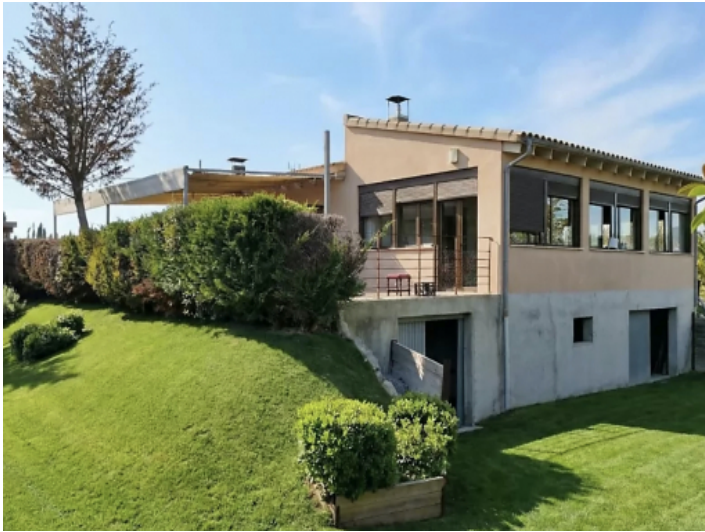
Son Mas Finca