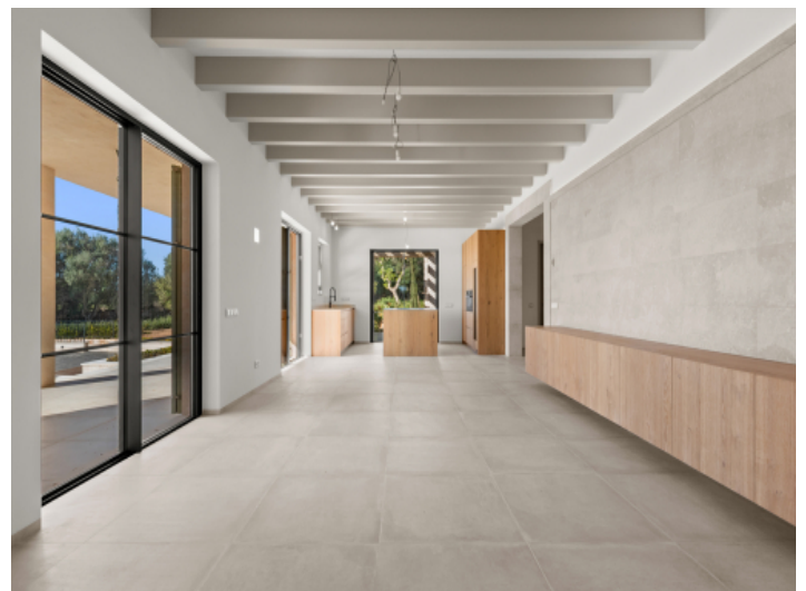
Offener heller Essbereich mit angrenzender Küche