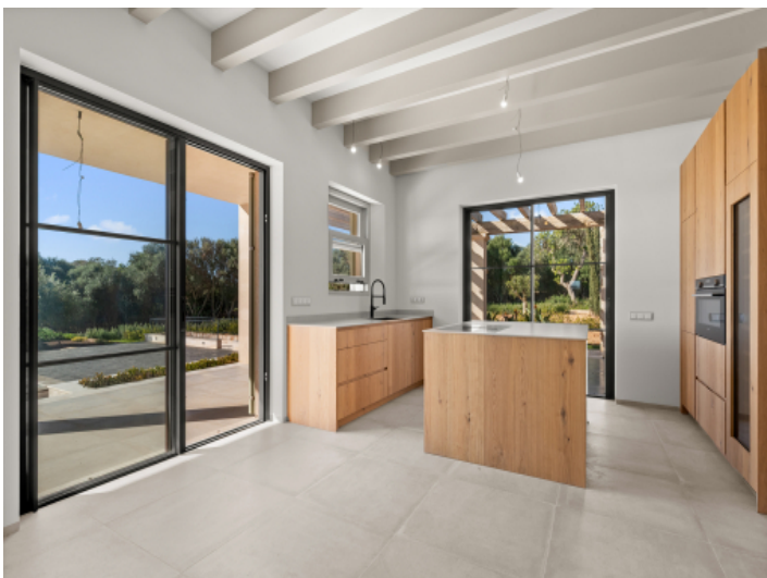
Offene vollausgestattete Küche