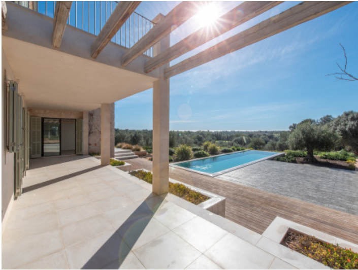
Weitblick bis zum Meer