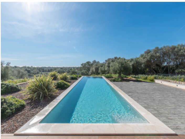
Großzügiger Pool mit Weitblick