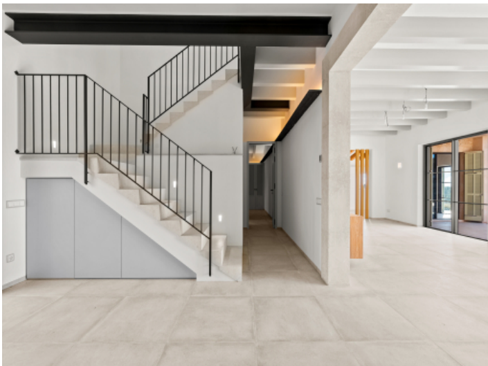
Eingangsbereich mit Treppe ins Obergeschoss