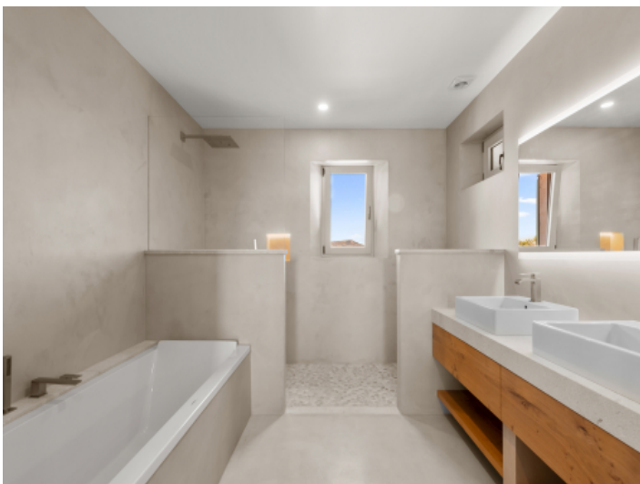
Badezimmer in Microzement