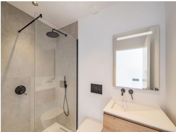
5. Badezimmer EG