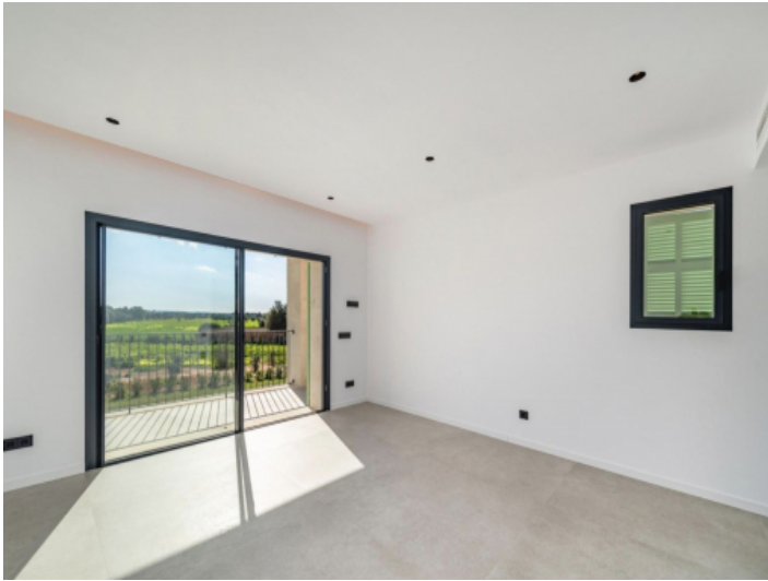
Masterbedroom 1.0Gim 1.0G