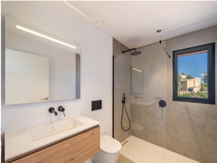
Bad en Suite 3. Schlafzimmer