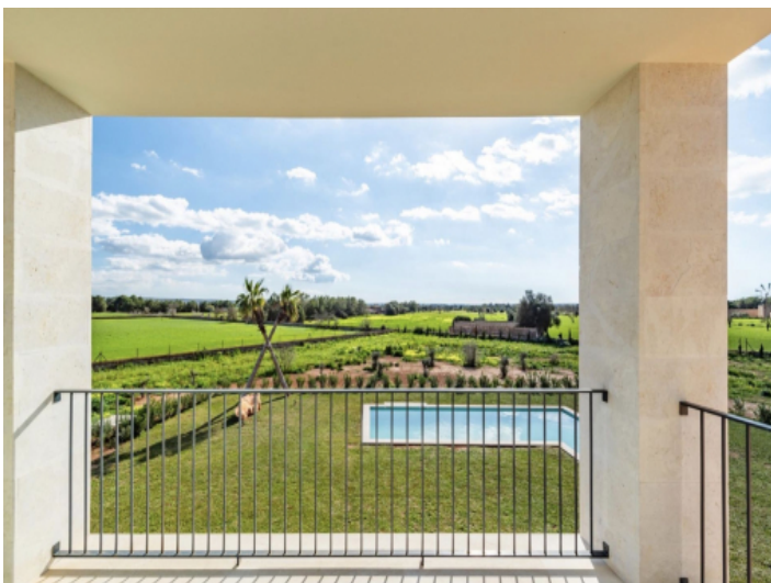
Terrasse von Masterbedroom 1.OG