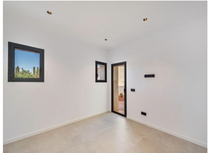
Büro / 5. Schlafzimmer EG mit Ausgang zum Hof