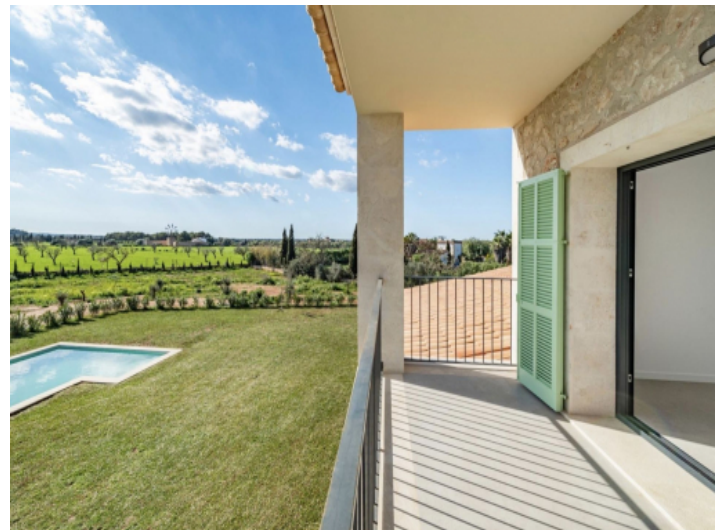
Terrasse von Masterbedroom 1.OG