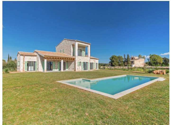
Garten und Poolansicht