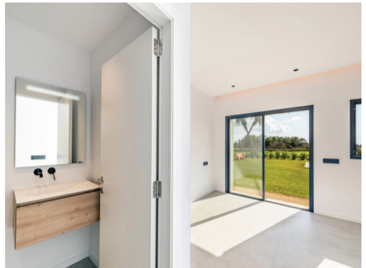
Bad en Suite 1. Schlafzimmer