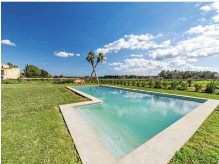
64 m 2 Pool mit Treppe