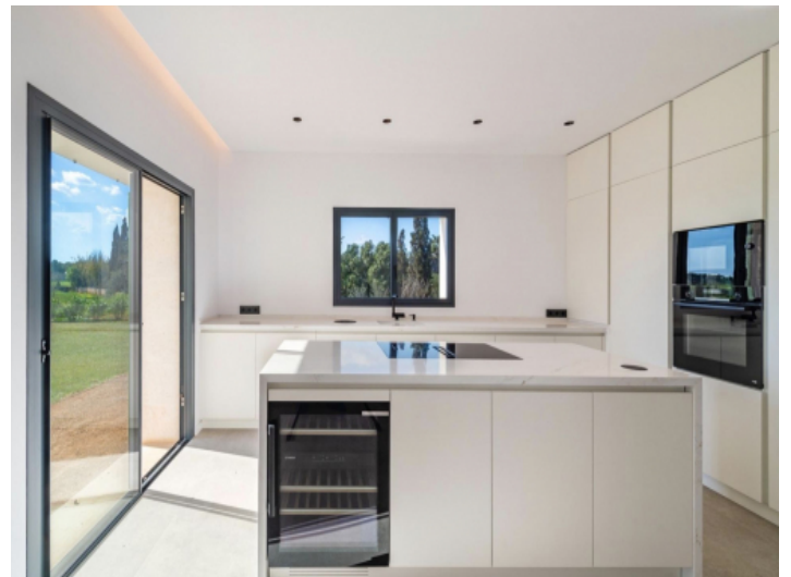
Küche mit Kochinsel