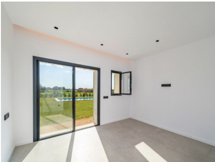
1. Schlafzimmer EG