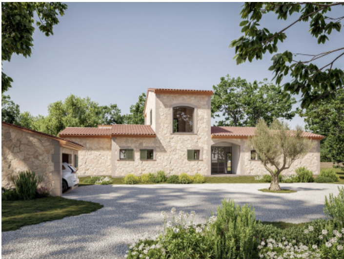
Finca in Campos