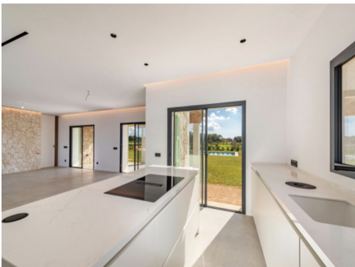
Küche mit Blick ins Wohn- und Esszimmer