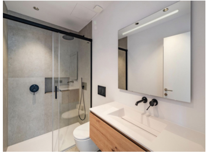
Bad en Suite Masterbedroom