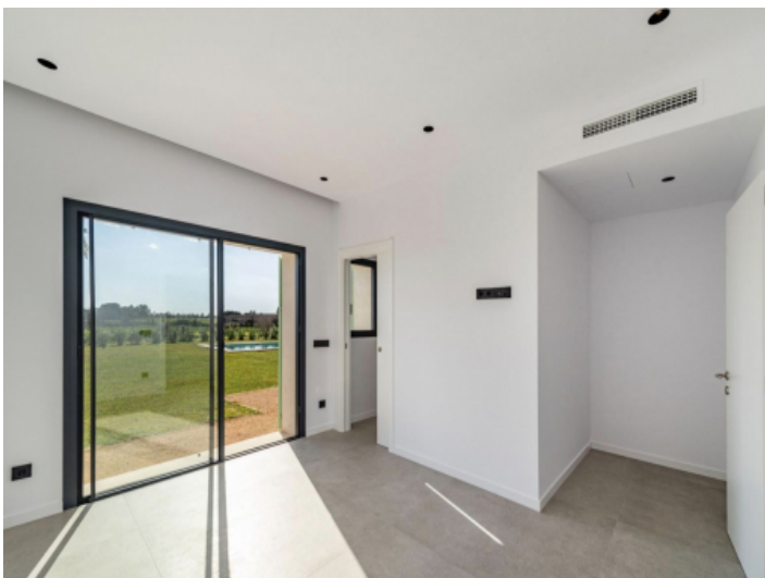
2. Schlafzimmer EG rechts Nische für Garderobe