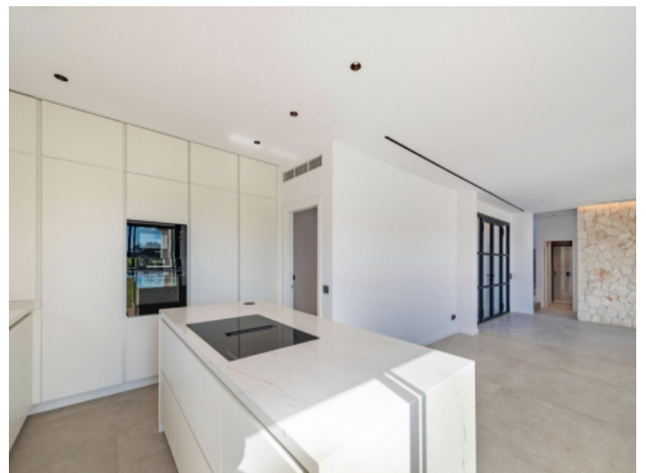
Küche mit Blick zum Abstellraum links und Eingangstür rechts