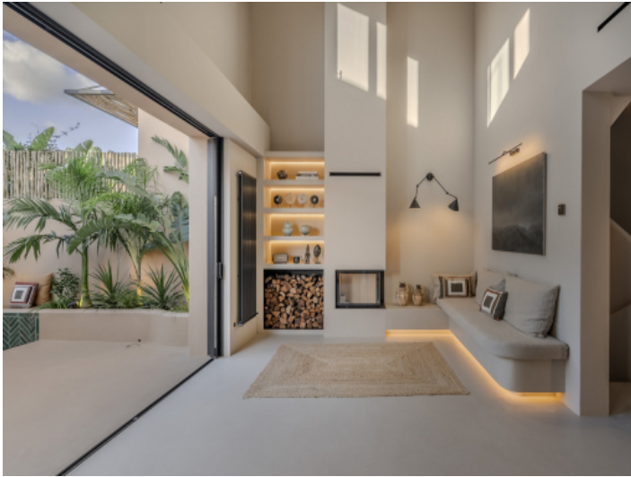
Wohnbereich mit angrenzender Terrasse