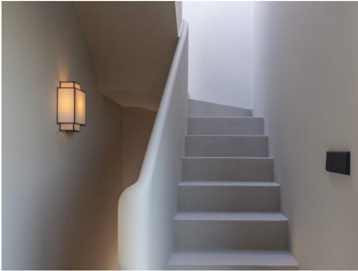
Treppe ins Obergeschoss