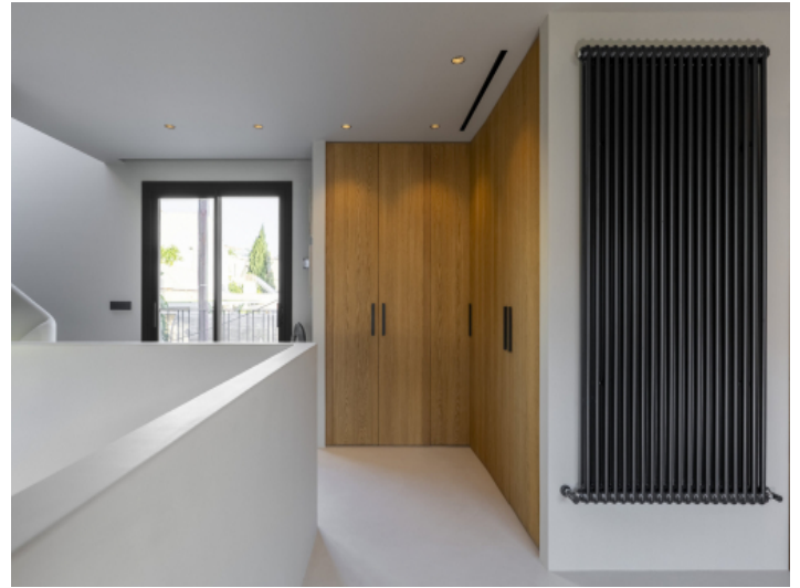
Master-Bereich mit angrenzendem Bad