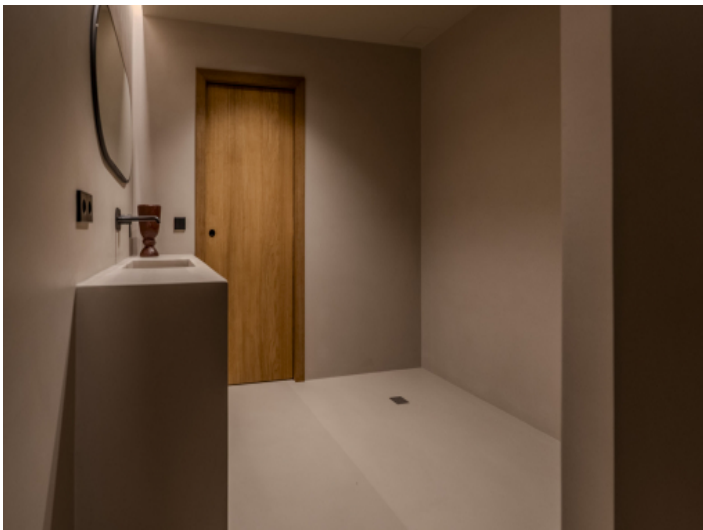
Badezimmer im Untergeschoss