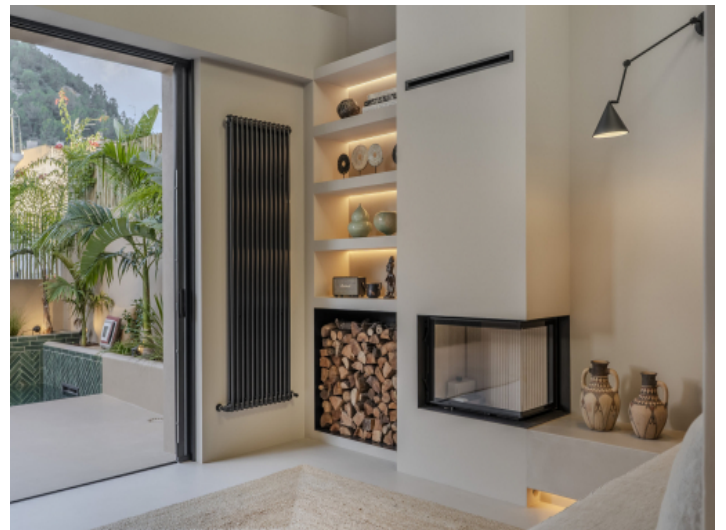
Kamin im Wohnbereich