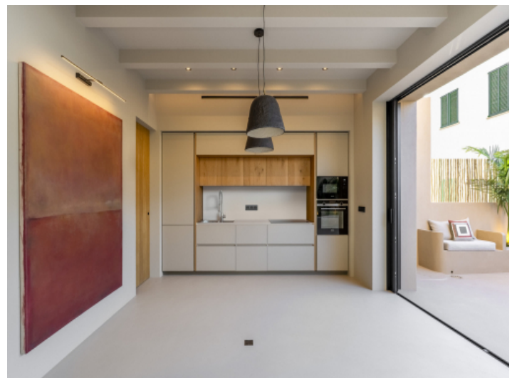
Wohnbereich mit angrenzender Terrasse