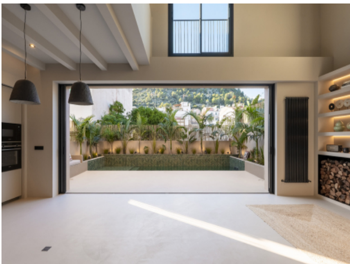
Wohnbereich mit Blick