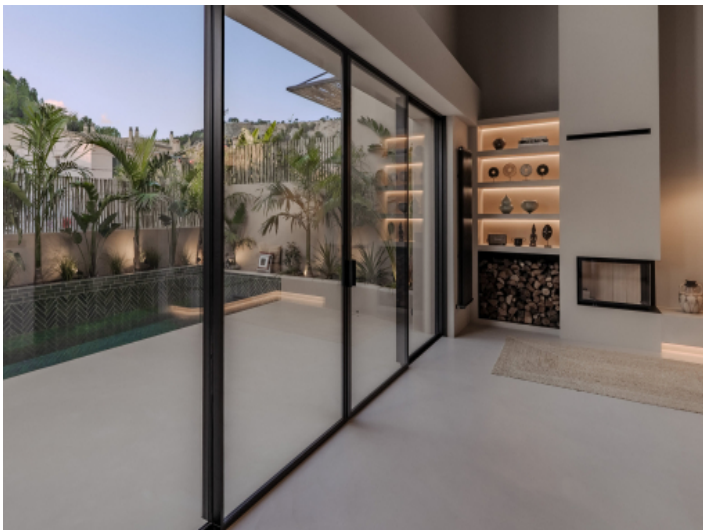
Wohnbereich mit angrenzender Terrasse