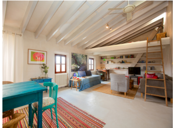
Einliegerwohnung 2 Stock