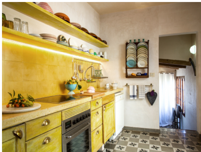
Küche erster Stock