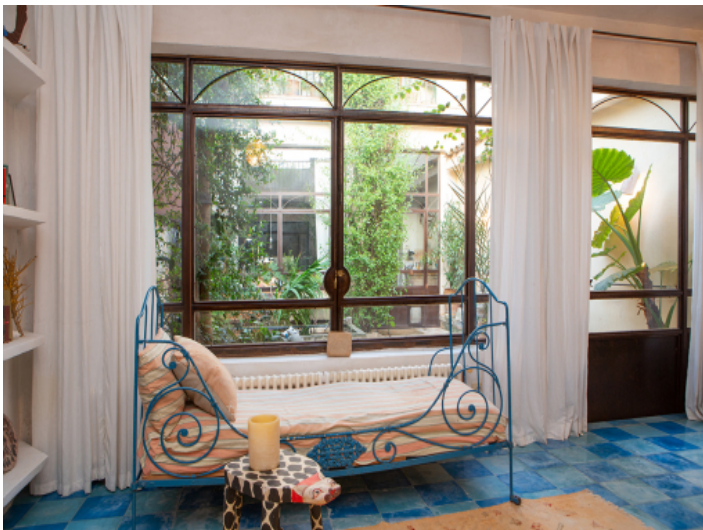
Zimmer zum Patio