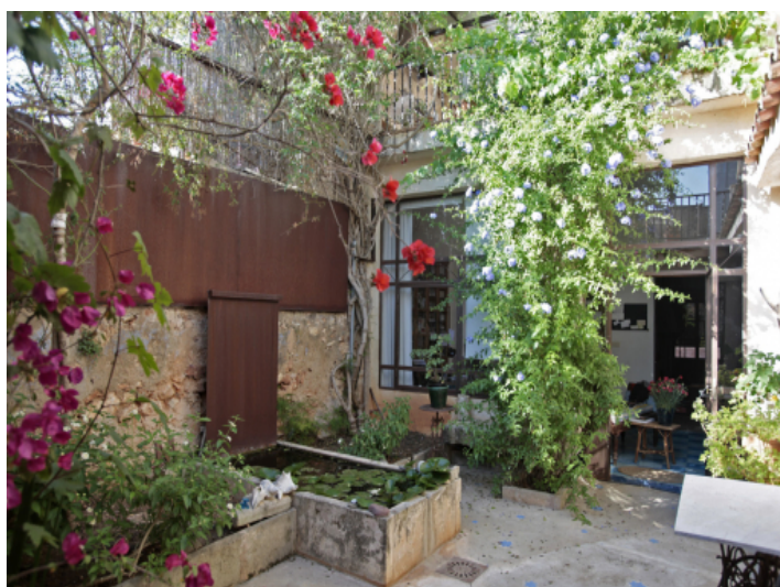
Innenhof mit Teich