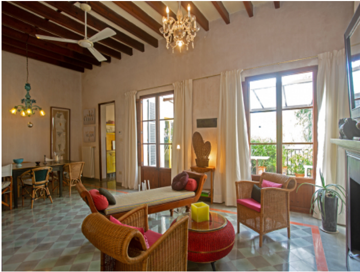
Salon 1 Stock