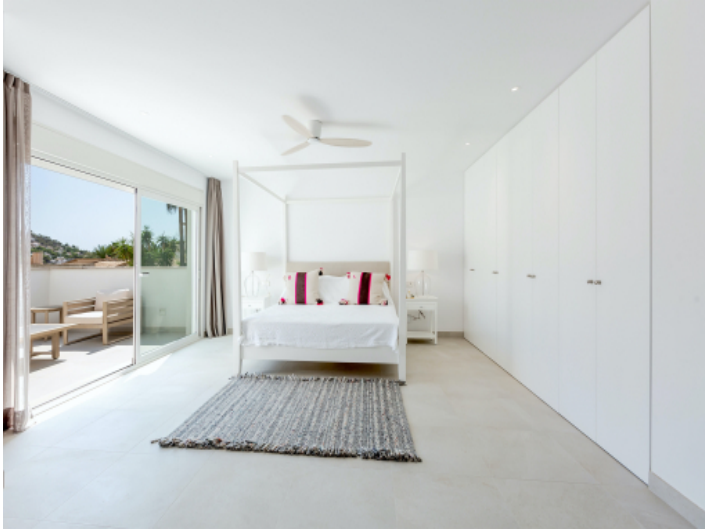
Eines von 5 Schlafzimmern