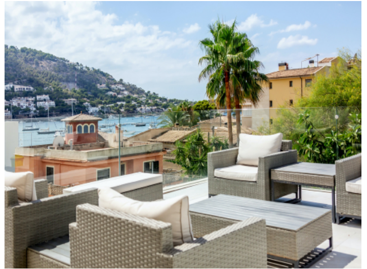
Terrasse mit Meerblick