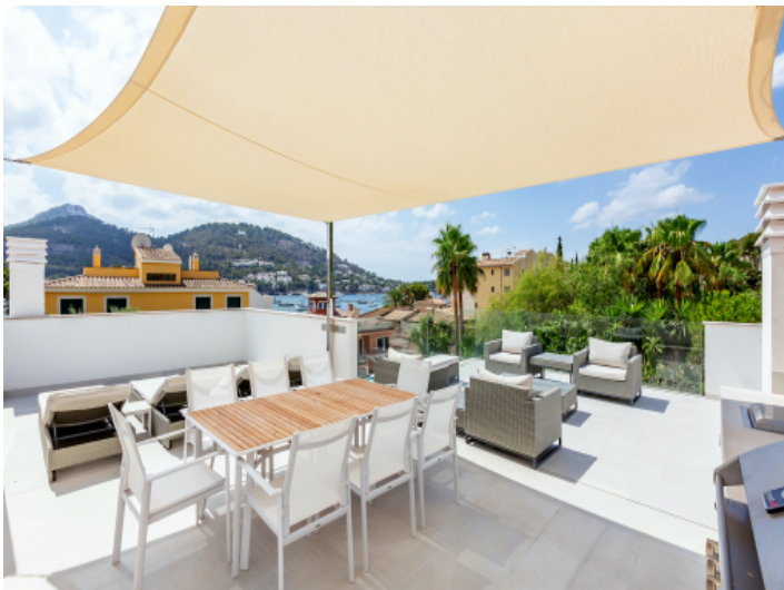
Essbereich im Freien