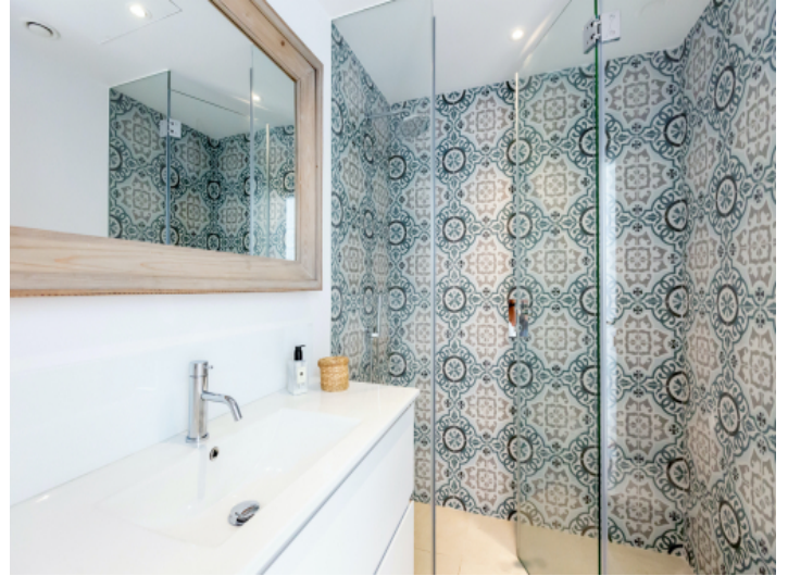
Eines von 4 Badezimmern