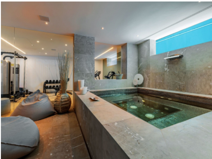
Fitness und SPA Bereich