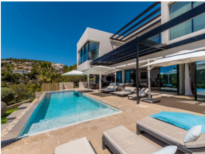
Großer Pool und Terrasse