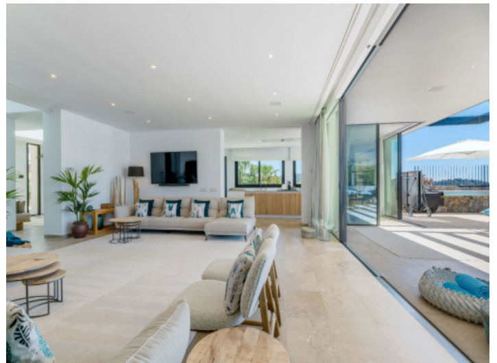
Wohnbereich und Küche