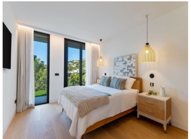
Eines von 12 Schlafzimmern 9