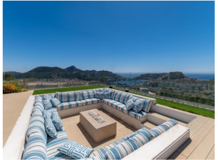
Sitzecke und Feuerstelle