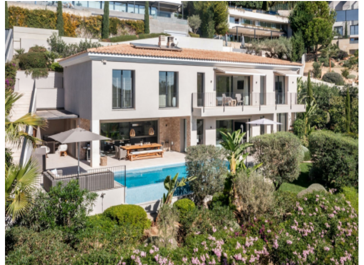
Außenansicht der Luxusvilla