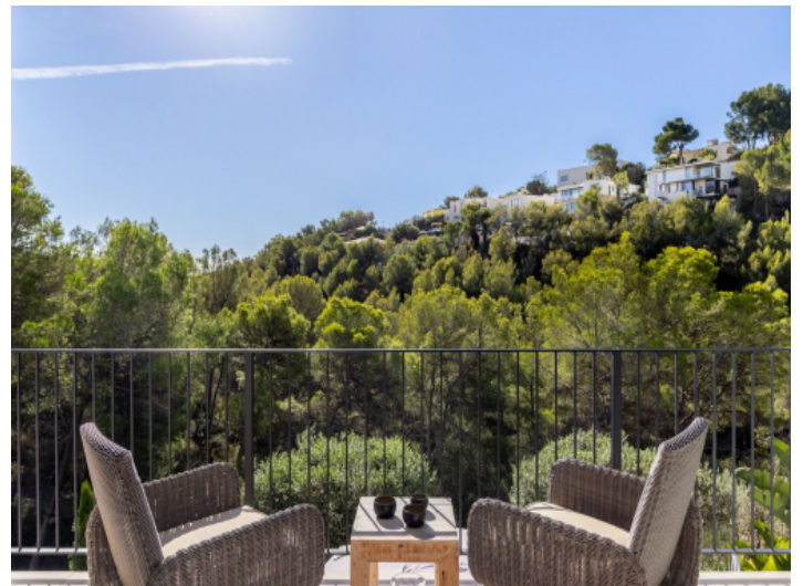
Sitzbereich mit Blick in die Natur