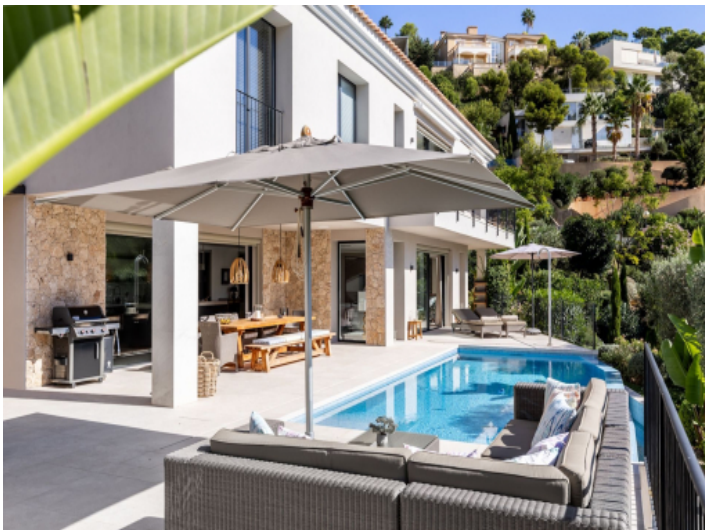
Villa in Costa d'en Blanes mit luxuriösem Wellnessbereich