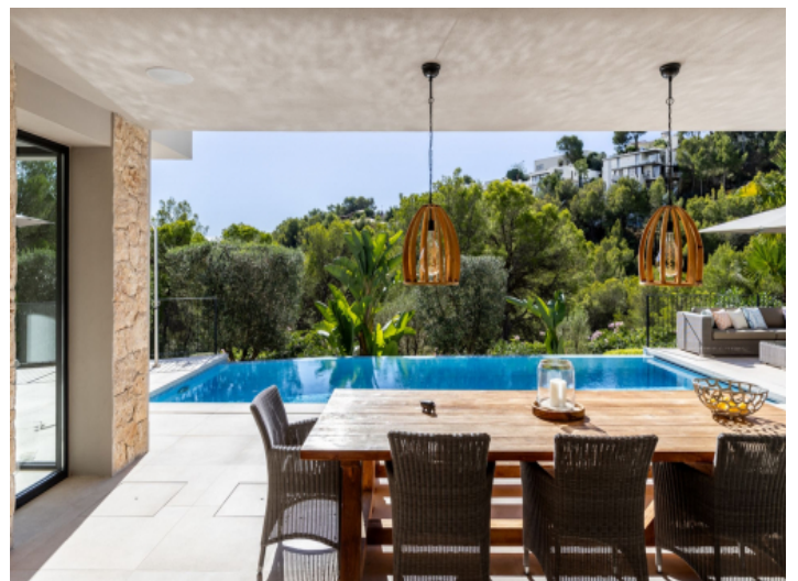
Überdachte Terrasse mit Blick in die Natur