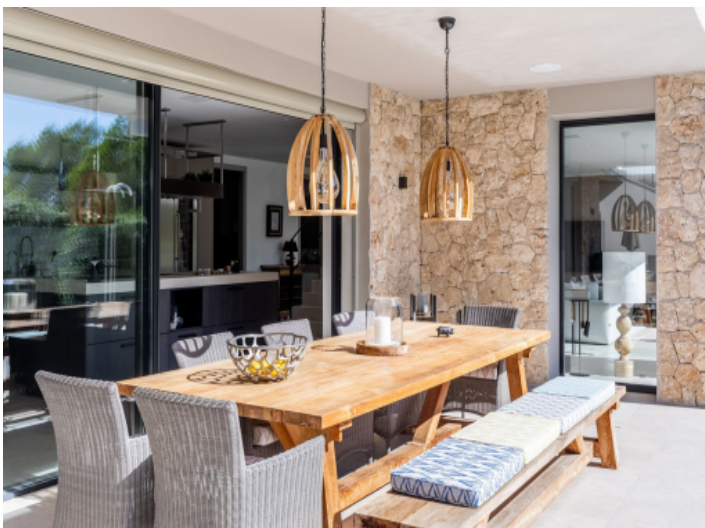
Wunderschöner Essbereich im Freien