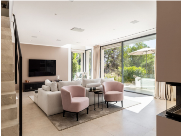
Wohnbereich mit Terrassenzugang