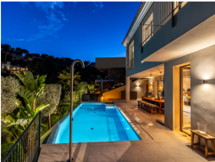
Poolbereich bei Nacht