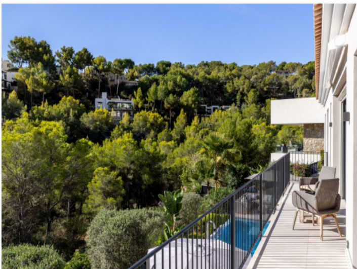
Terrasse mit Weitblick