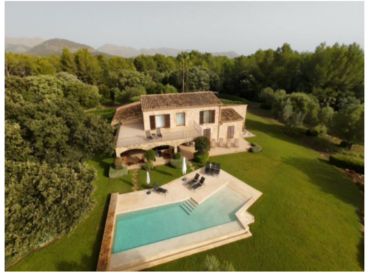
Wunderschön gelegene Finca