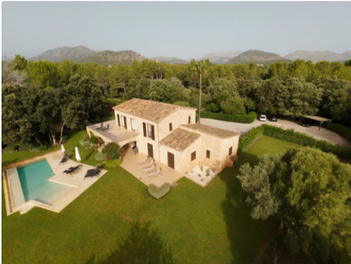
Ansicht auf diese wunderschöne Finca