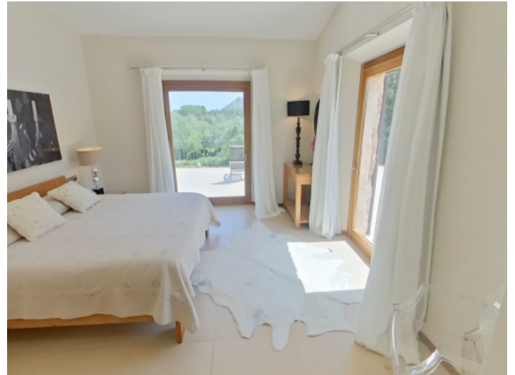
Eines von 6 Schlafzimmern