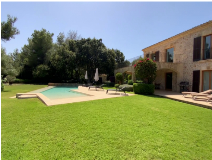
Weitläufiger Garten mit Pool