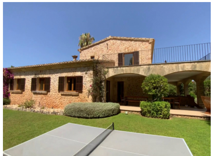
Gartenansicht auf die Finca