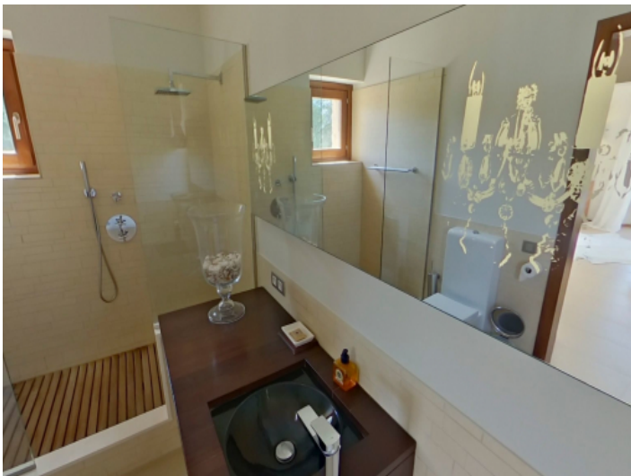
Die Finca hat 7 Badezimmer