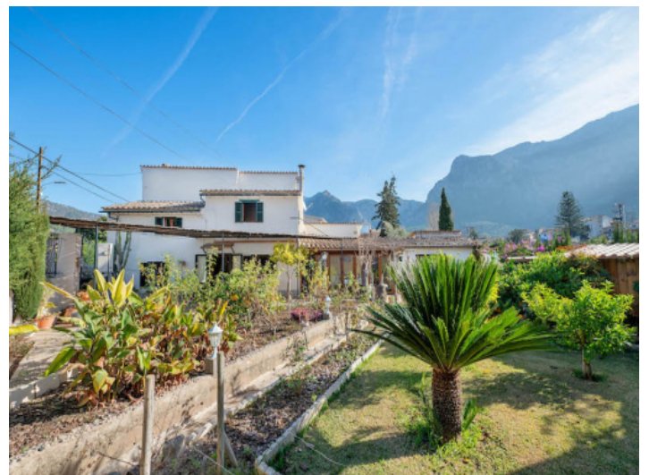
Garten und Fassade