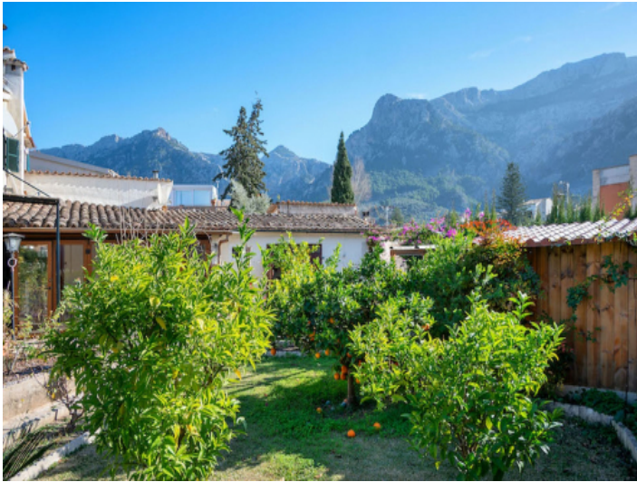
Mit Aussicht auf das Tramuntana Gebirge