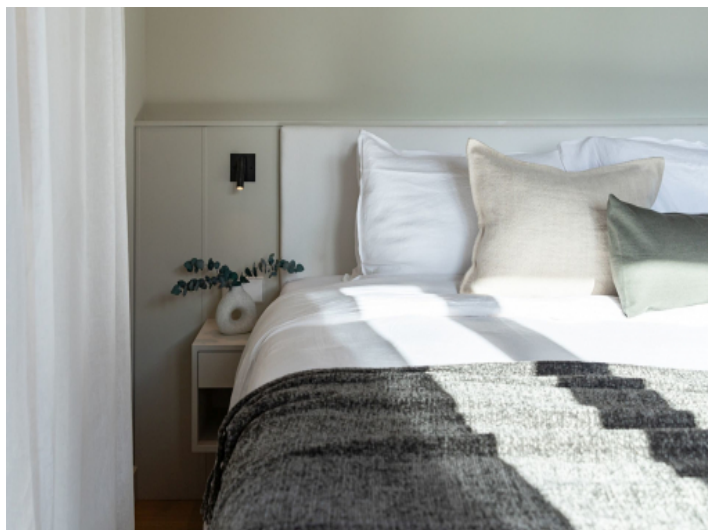
Haus mit 2 Schlafzimmern