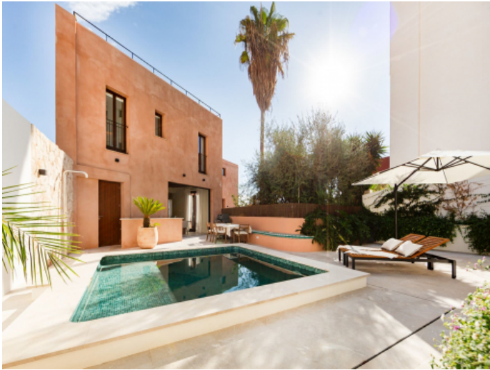
Schöner Patio mit Pool