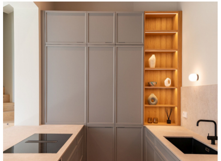
Arbeitsflächen aus Naturstein