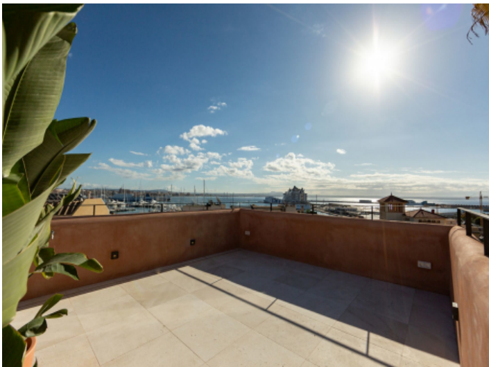
Dachterrasse mit Hafenblick