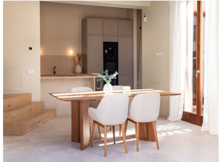
Essbereich vor der Küche