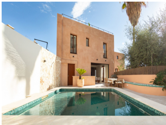
Pool und Ansicht auf die Fassade