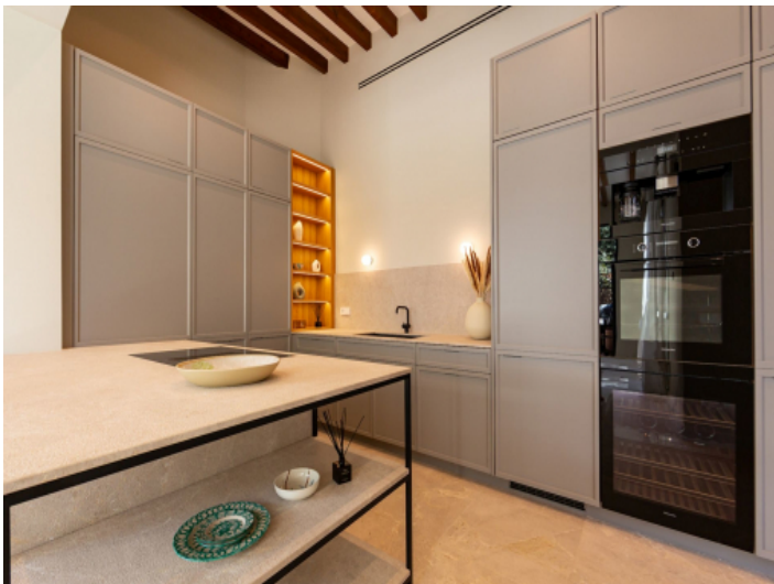
Küche mit viel Stauraum