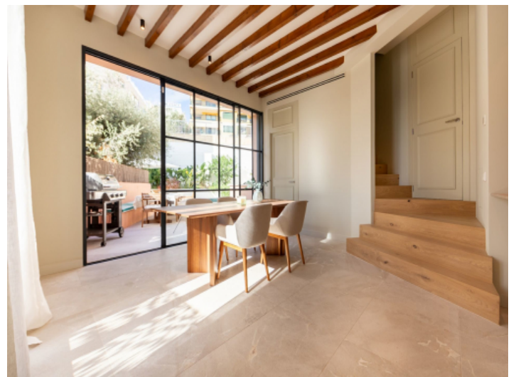
Essbereich mit viel Tageslicht