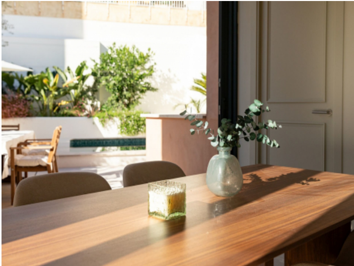
Essbereich mit Aussicht auf den Patio