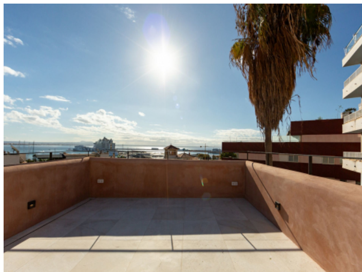
Dachterasse mit Traumaussicht