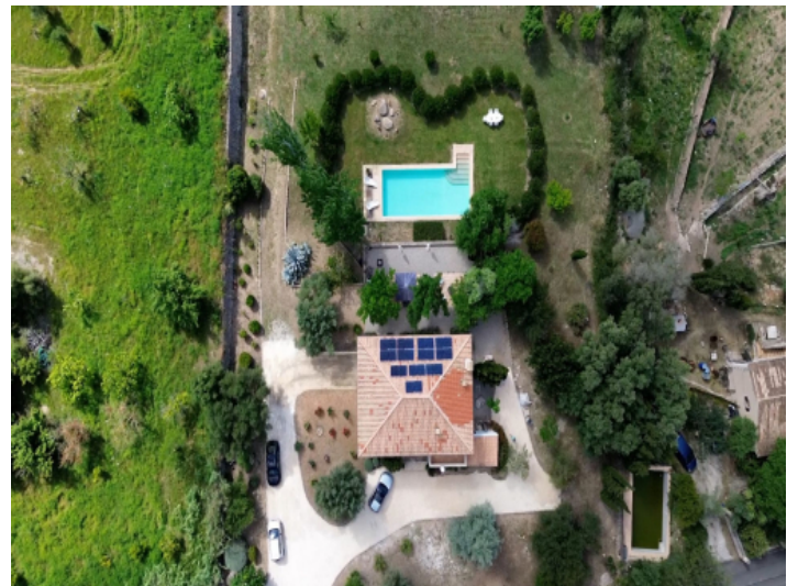
Blick aus der Vogelperspektive