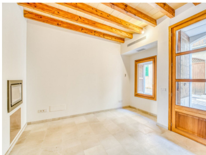
Eingangs- und Wohnbereich