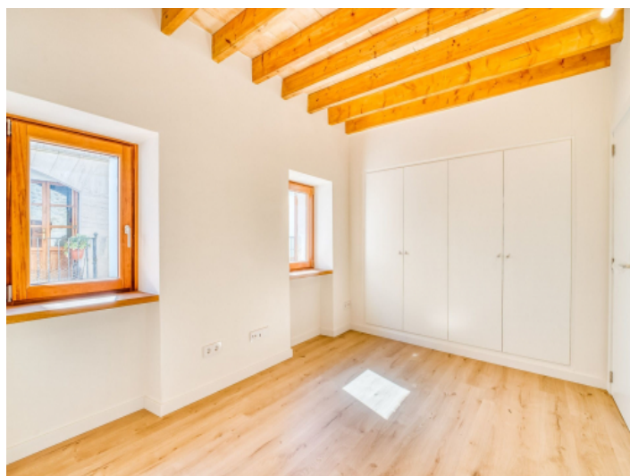
Zweites Schlafzimmer auf der 1. Etage