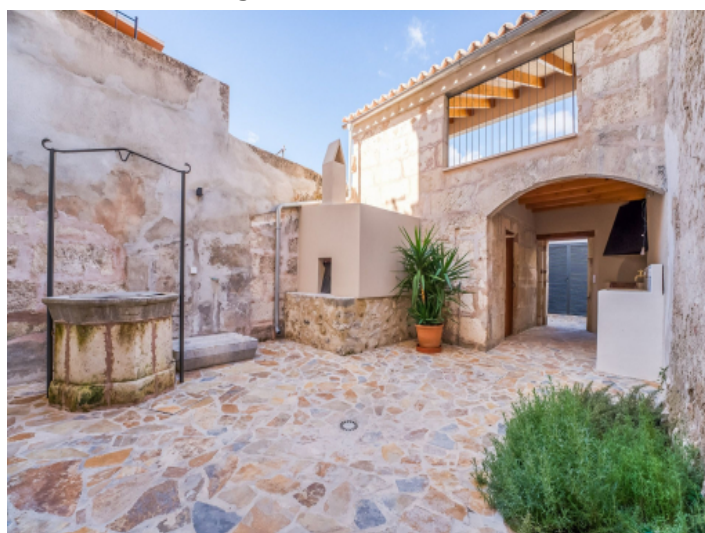
Zugang zum Poolbereich und ins Haus