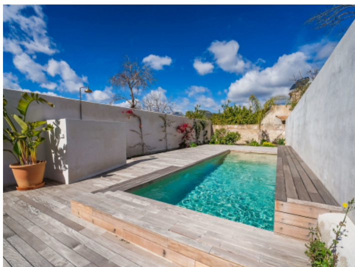
Private Sonnenterrasse mit Pool