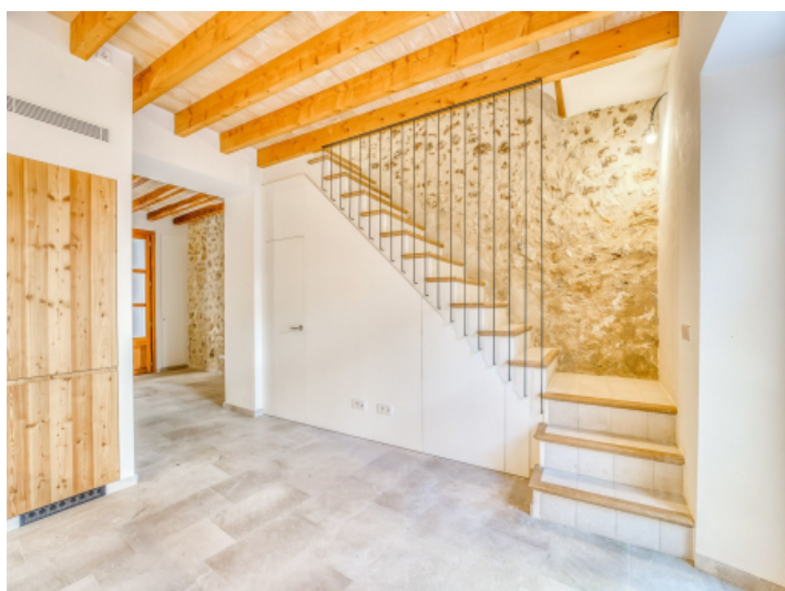
Treppe nach oben