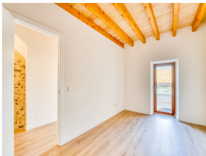
Erstes Schlafzimmer in der ersten Etage