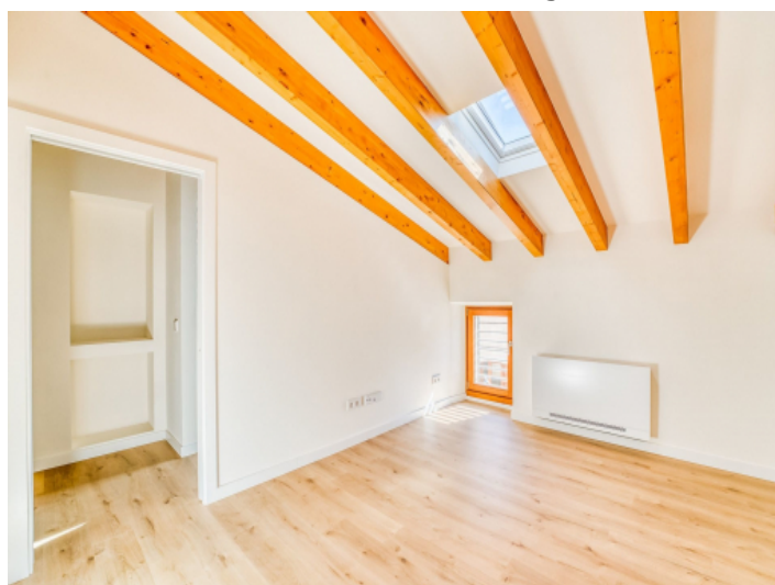
Schlafzimmer auf der 2. Etage