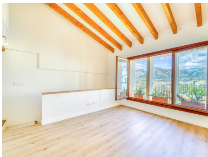
Wohnbereich auf der 2. Etage