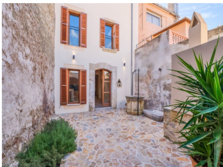
Patio de Houses