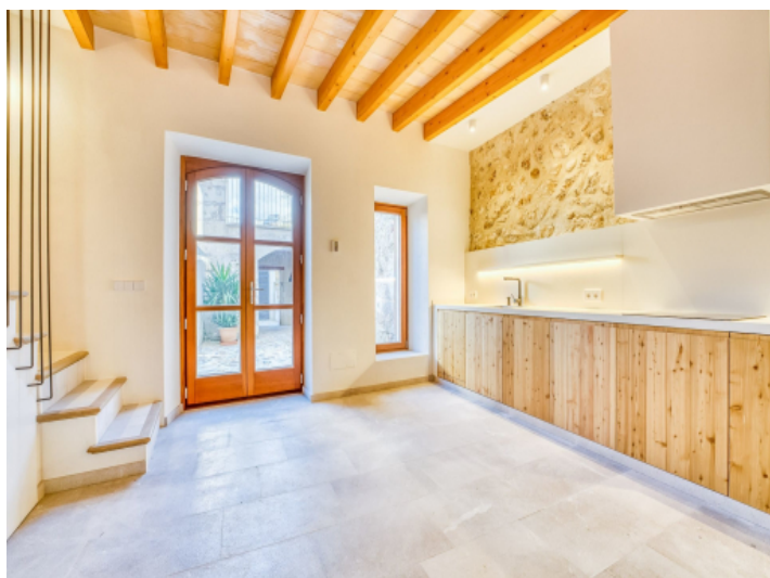
Küche mit Patiozugang