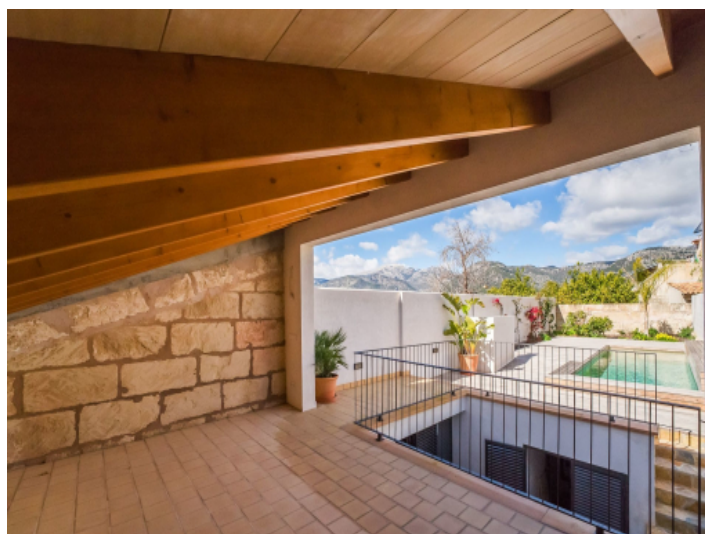
Loungeterrasse neben dem Pool