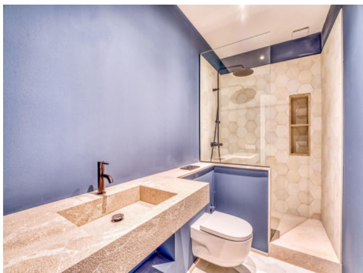
Badezimmer auf der 1. Etage