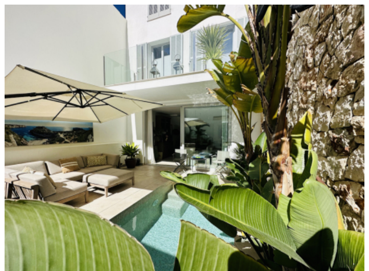
Wohlfühloase mit einheimischen Pflanzen