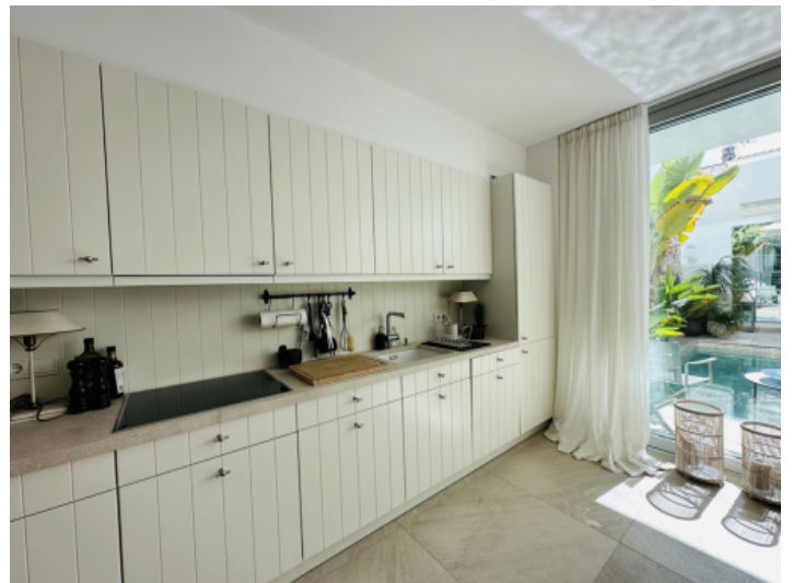
Offene, komplett ausgestattete Küche