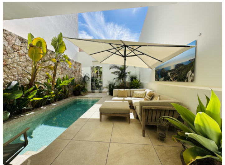
Patio mit Pool und Chill-Out-Bereich