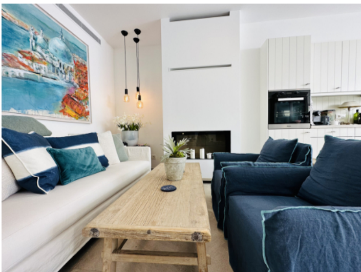
Gemütlicher Wohnbereich mit Kamin