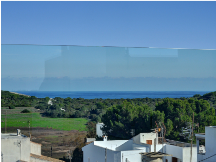
Traumhafter Panoramablick bis zum Meer