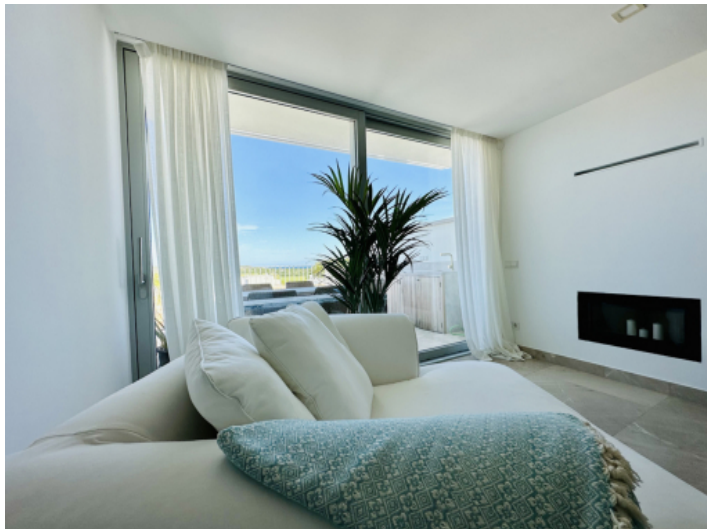
Zweiter Wohnbereich mit Kamin