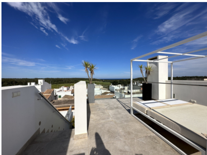
Große Dachterrasse mit spektakulären Blick