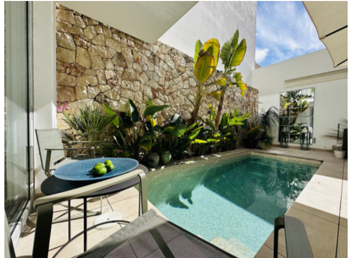
Mediterraner, geräumiger Patio mit Pool