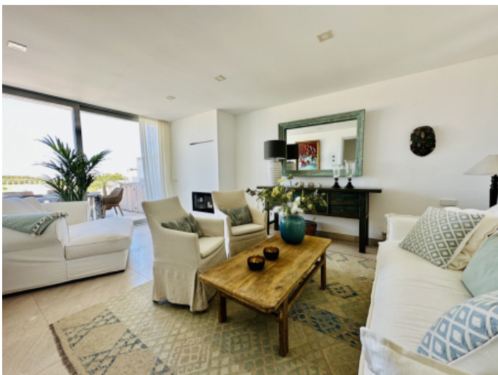
Wohnbereich auf der obersten Etage