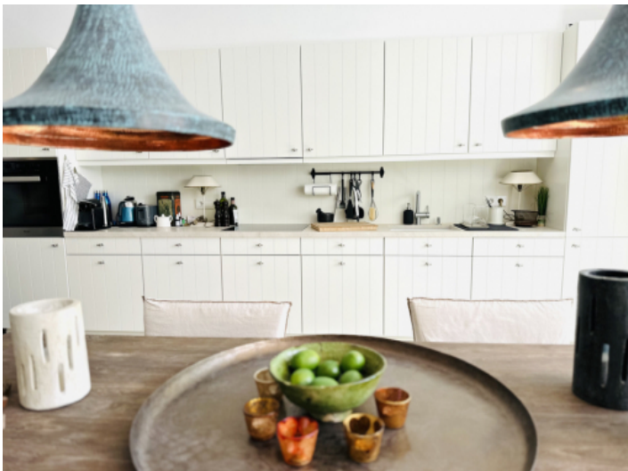
Küche im Landhausstil