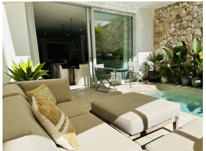
Einladender Chill-Out-Bereich am Pool