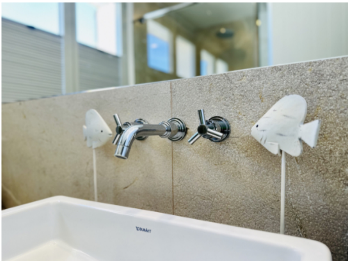
Detailaufnahme im Badezimmer