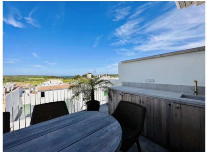
Einladende Sitzmöglichkeit auf der Terrasse