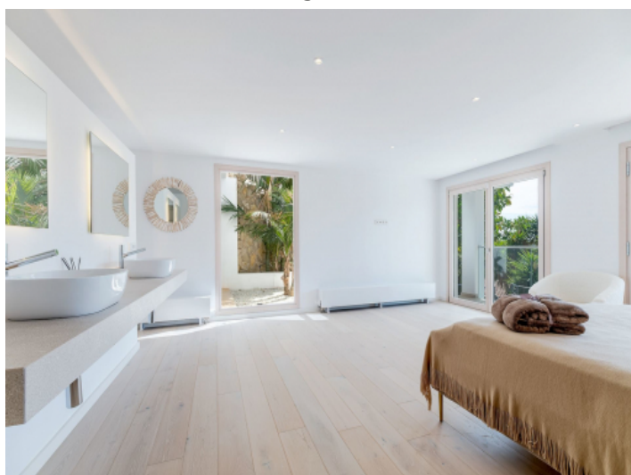
Schlafzimmer mit Bad en Suite