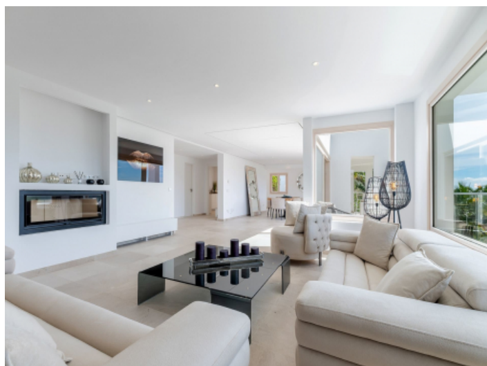
Gemütlicher Wohnbereich mit Gaskamin