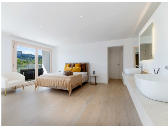
Eines von 6 Schlafzimmern