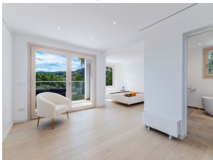
Ein weiteres komfortables Schlafzimmer