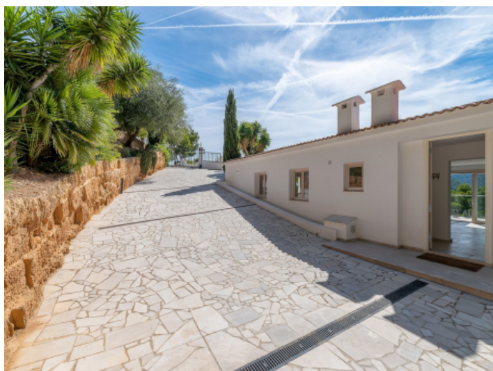
Fassade der am Hang liegenden Villa