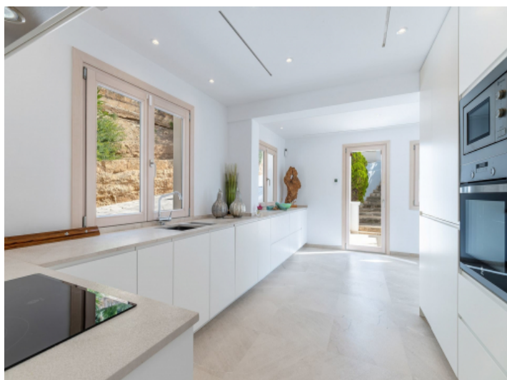
Die moderne Küche