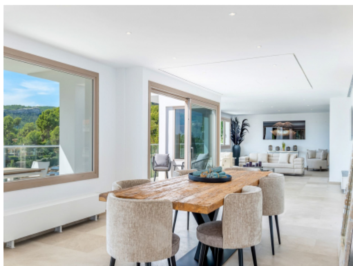
Heller Wohn und Essbereich