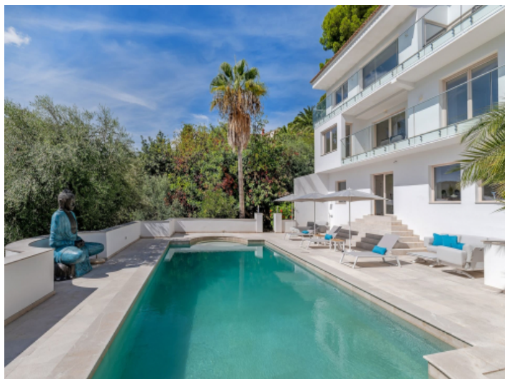
Ansicht auf die Villa