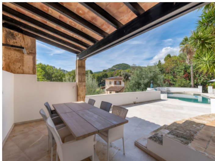
Überdachte Veranda am Poolbereich