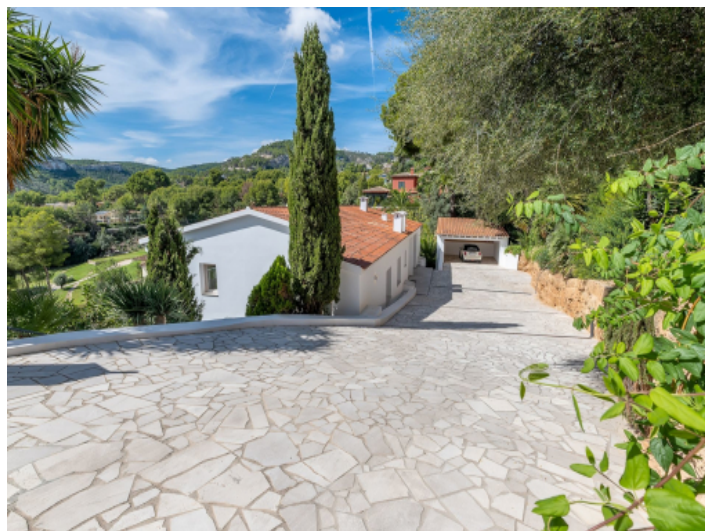
Einfahrt zur Villa