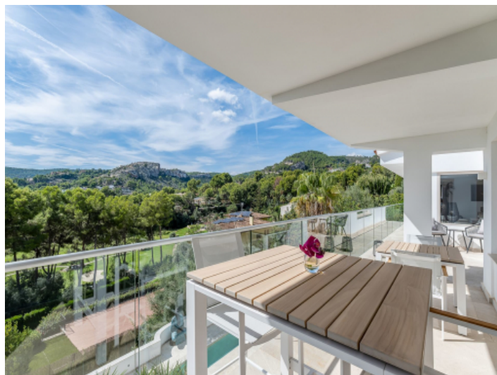
Terrasse mit Traumausblick über das Green von Son Vida Golf