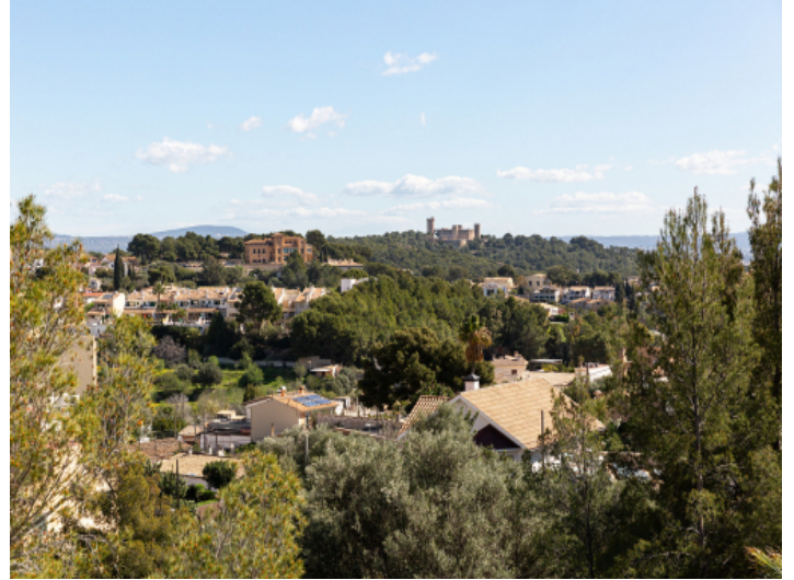
Aussicht bis zum Schloss Bellver