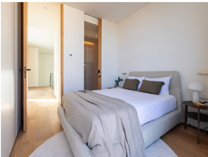
Eines von 5 Schlafzimmern