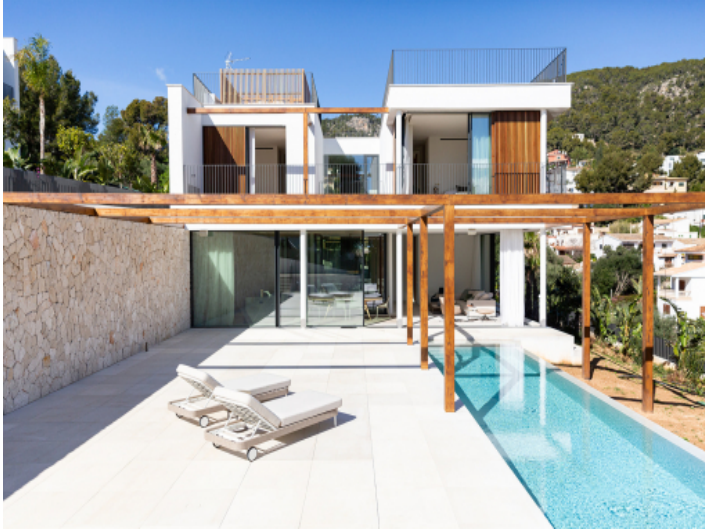
Garten mit Pool und Ansicht auf die Fassade