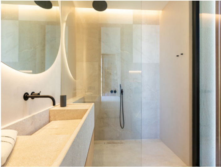
Eines von 5 Badezimmern