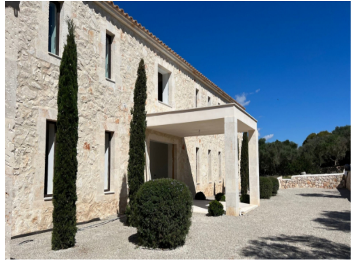
Finca gebaut aus Natursteinen