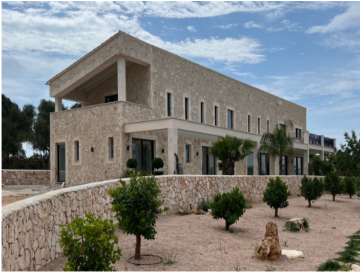
Mallorquinische Finca mit Garten