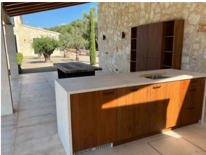
Überdachte Terrasse mit Sommerküche