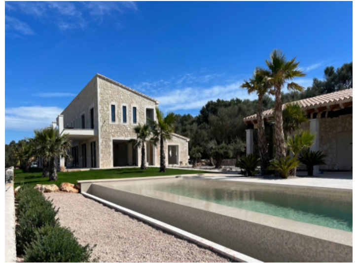
Blick vom Pool auf die Finca