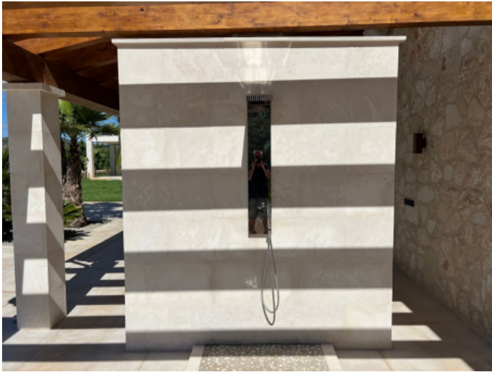
Außenbereich des Pools mit Dusche