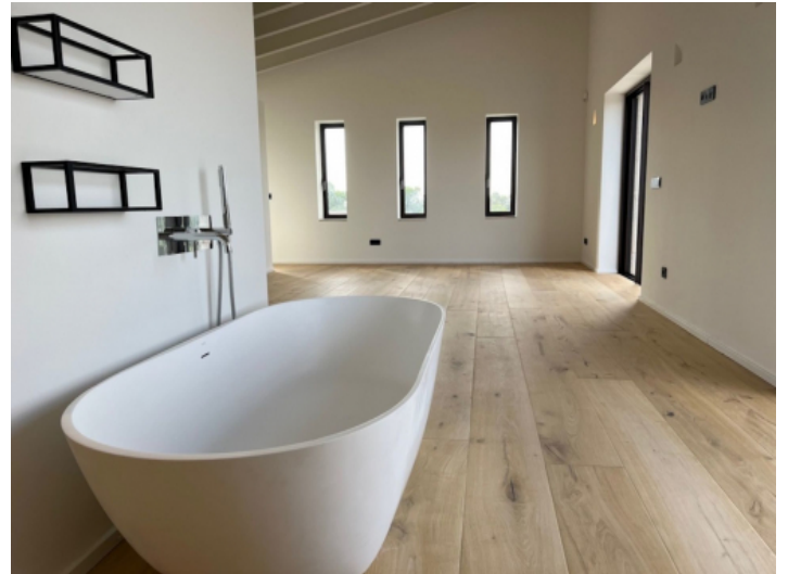
Offenes Badezimmer mit angrenzendem Schlafzimmer