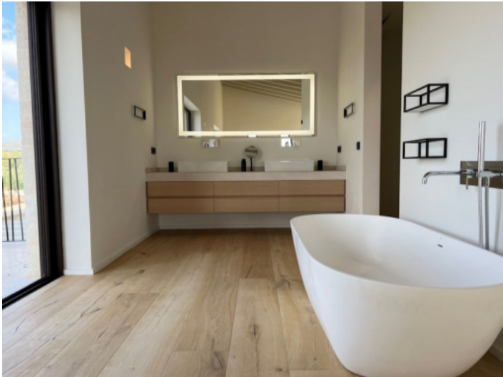
Badezimmer mit Badewanne