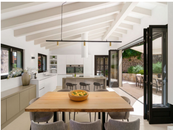
Weiter Zugang zur Küche