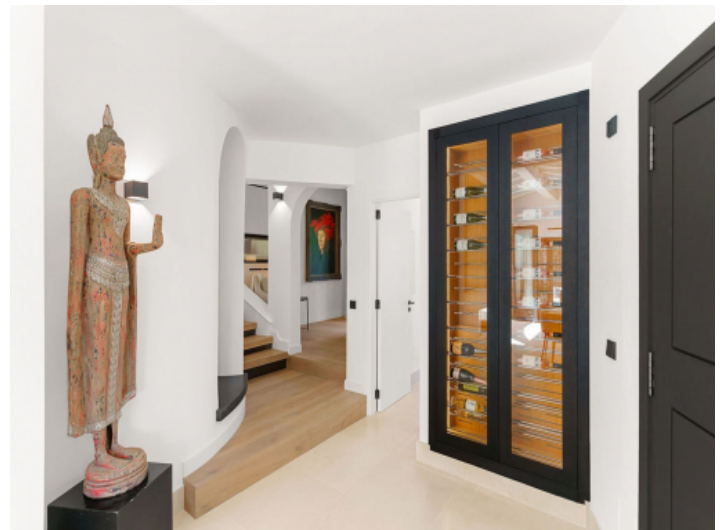
Flur mit Weinkühler