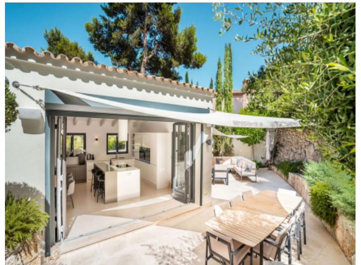
Schöner Essbereich im Freien