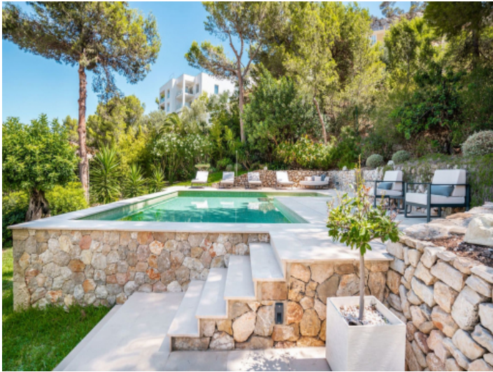
Wundervoll angelegter Außenbereich