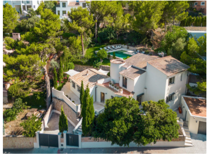
Blick von der Straße