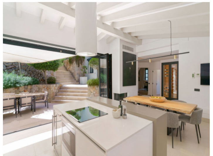
Moderne, offene Küche