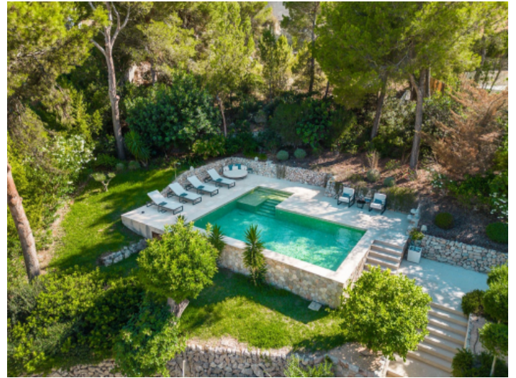
Pooloase inmitten eines grünen Gartens