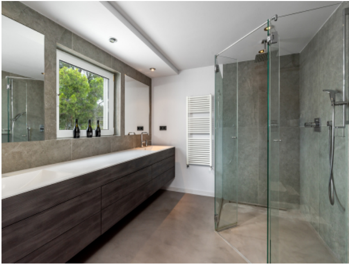
Badzimmer mit begehbare Dusche