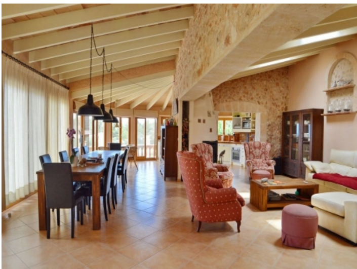
Offener Wohn-und Essbereich