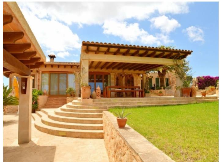
Finca und Terrasse