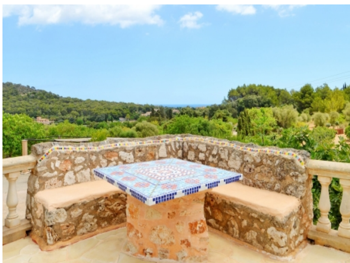
Terrasse mit Meerblick