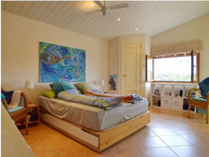
Eines von 6 Schlafzimmern