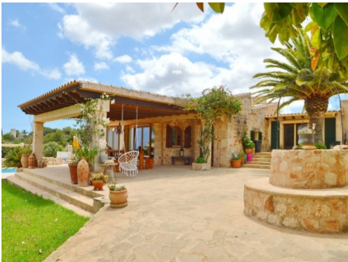
Finca mit überdachter Terrasse