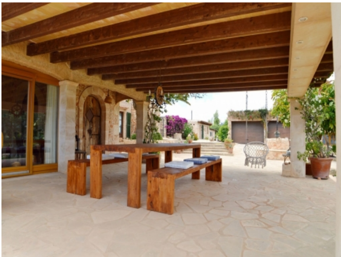
Große überdachte Terrasse