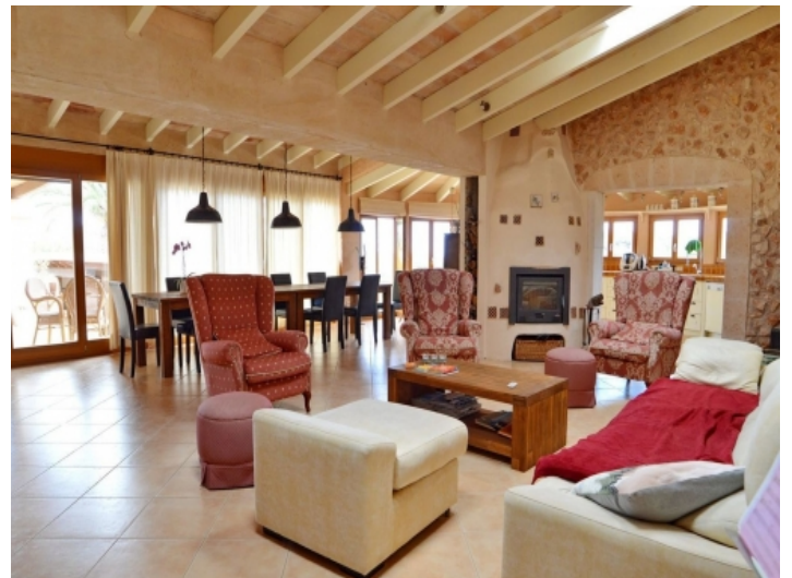
Großer Wohnbereich mit Kamin