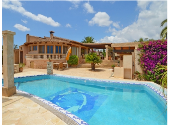
Pool und Sonnenterrasse