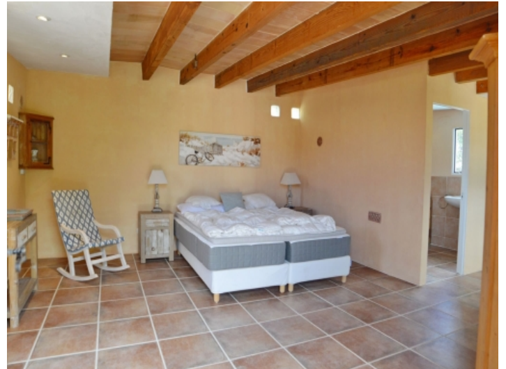
Eines von 6 Schlafzimmern