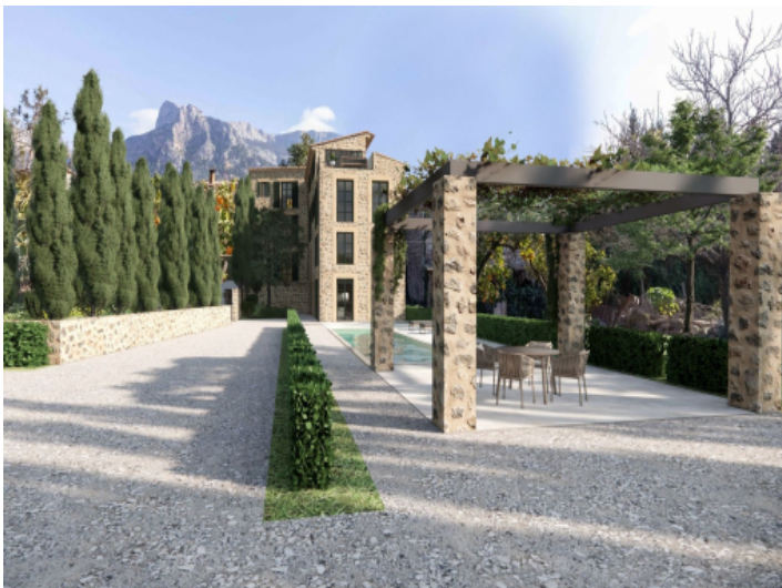
Pool und Außenbereich