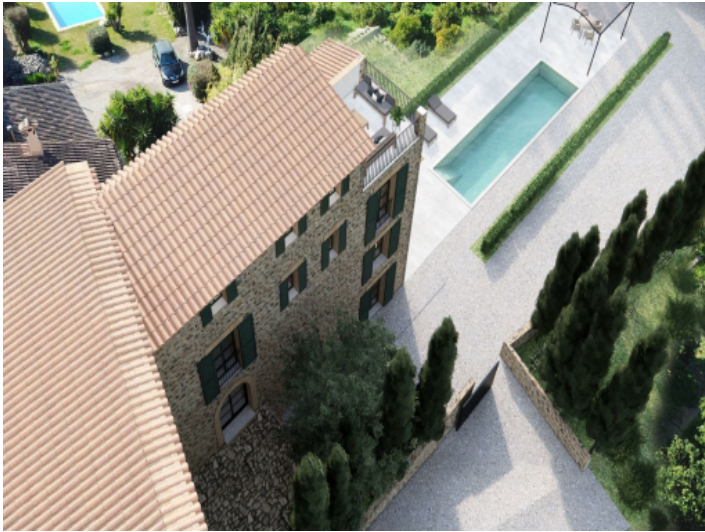
Pool und Außenbereich